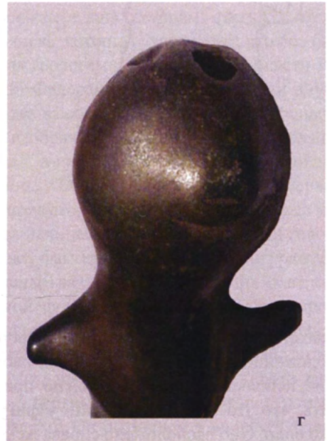
Рис. 7. Фигурка, найденная в Западной Сибири (Тюменская обл., Российская Федерация). Fig. 7. The figurine found in Western Siberia (Tyumen province, the Russian Federation)