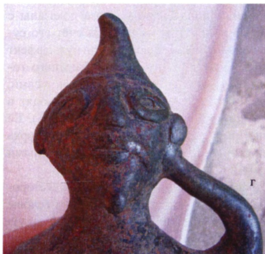
Рис. 9. Фигурка, найденная в низовьях р.Кубань (Краснодарский край, Российская Федерация).