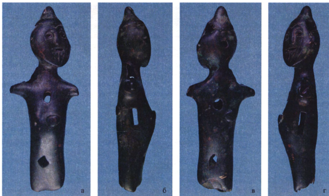
Рис. 2. Антропоморфная фигурка, найденная в верхнем течении р.Волчьа (Запорожская обл.). Fig. 2. The anthropomorphous figurine found in the upper reaches of the Volchia river (Zaporozhye province)