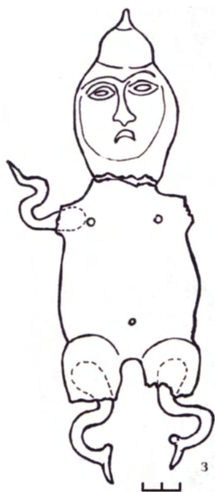
Fig. 6. The figurine found near Pristino village (Kremenskoï region, Lugansk province): а-ж – a photo; з – a reconstruction of the assembled figurine

ся сквозное отверстие прямоугольной формы, расположенное вертикально и также оконтуренное небольшим валиком. Можно предположить, что это – второй рот. Ухо у фигурки только одно. Оно расположено справа женской стороны головы (рис.7, в).