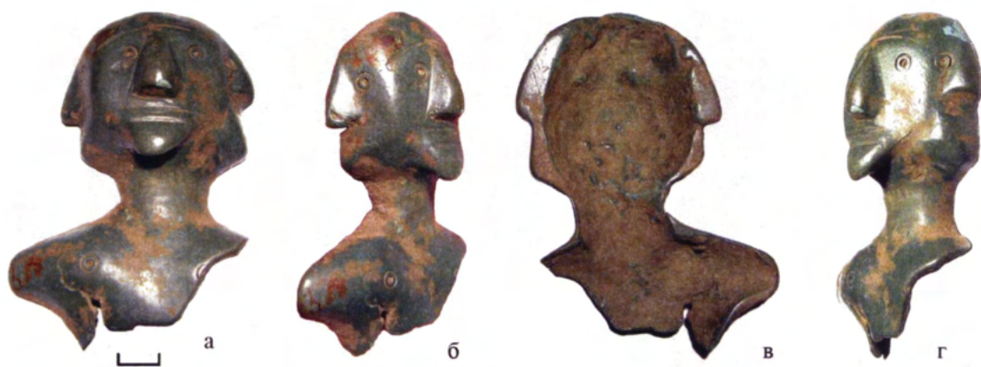
Рис. 5. Фигурка, найденная в окрестностях г.Ставрополь (Краснодарский край). Fig. 5. The figurine found near Stavropol (Krasnodar Territory)

литая полая внутри двусоставная статуэтка, одна половина которой изображает мужчину, вторая – женщину (рис.6, а-г). Высота одной из половинок составляет 25,4 см. Это, по всей видимости, изображение мужчины в конусовидном головном уборе, верхняя часть которого заканчивается остроконечным выступом. Голова этой части статуэтки имеет овальную форму. Рельефные дугообразные брови переходят в прямой расширяющийся книзу нос. Глаза миндалевидной формы. Рот с опущенными вниз уголками выполнен в виде небольшого углубления. Округлый подбородок плавно переходит в массивную шею. Руки отсутствуют. На торсе фигурки выделены грудные мышцы, живот немного выступает вперед. Обе ноги обломаны выше колен (рис.6, в, г).