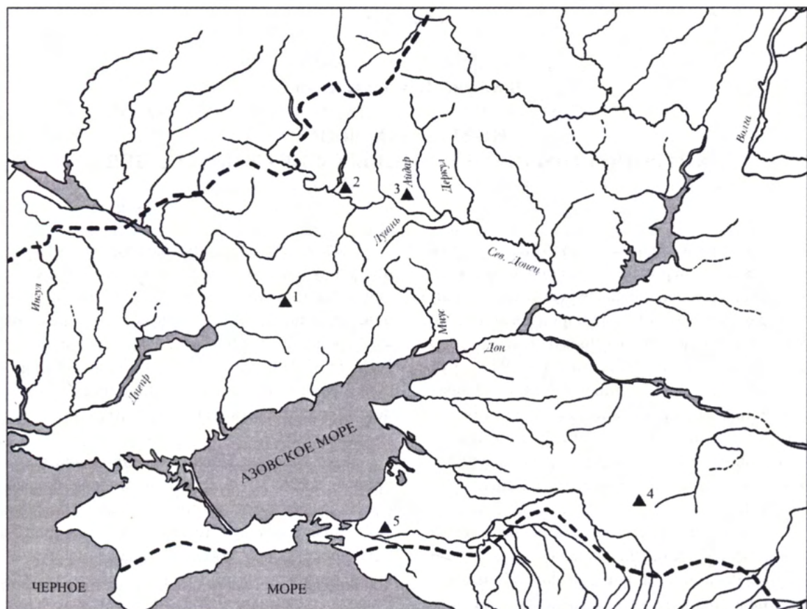
Рис. 1. Карта-схема местонахождений антропоморфных фигурок: 1 – верхнее течение р. Волчьа (Запорожская обл.); 2 – п.г.т. Яровая (Краснолиманский р-н, Донецкая обл.); 3 – с. Пристино (Кременской р-н, Луганская обл.); 4 – г. Ставрополь (Краснодарский край); 5 – низовья правого берега р. Кубань (Краснодарский край).