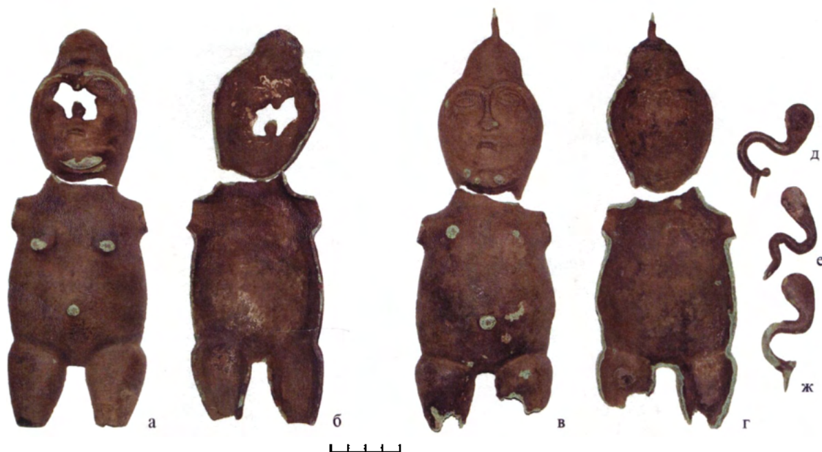
Рис. 6. Фигурка, найденная у с.Пристино (Кременской р-н, Луганская обл.): а-ж – фото; з – реконструкция фигурки в собранном виде.