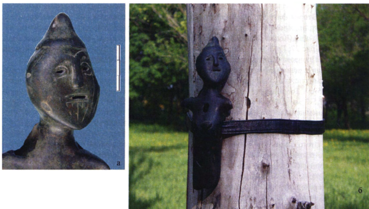
Рис. 3. Антропоморфная фигурка, найденная в верхнем течении р.Волчьа (Запорожская обл.): а – верхняя часть фигурки; б – реконструкция возможного использования фигурки в ритуальной практике. Fig. 3. The anthropomorphous figurine found in the upper reaches of the Volchia river (Zaporozhye province): а – the top part of a figurine; б – reconstruction of apt applicability of a figurine in ritual practice