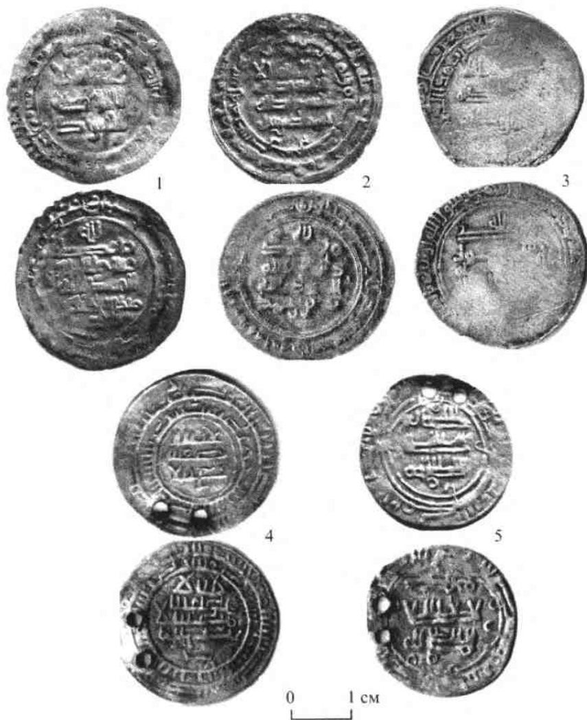
Рис. 3. Куфические дирхемы: 1 – Моршанский р-н Тамбовской обл.; 2 – с. Серповое Моршанского р-на; 3 – Давыдовское городище Моршанского р-на; 4-5 – с. Новая Ляда.

Fig. 3. Al-Kufa dirhems: 1 – Morshansk region of Tambov province; 2 – Serpovoiie village of Morshansk region; 3 – Davydovskoiie hillfort of Morshansk region; 4-5 – Novaia Liada village