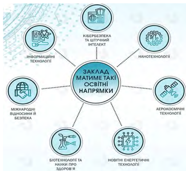
Рис. 5. Структура спеціальностей нового університету [17]

указу розбурхало цілий пласт невирішених проблем та поставило нові запитання з причини низки можливих ризиків та загроз для її реального втілення в життя та задля запобігання проявів корупційного розподілу коштів, що плануються на реалізацію проєкту.