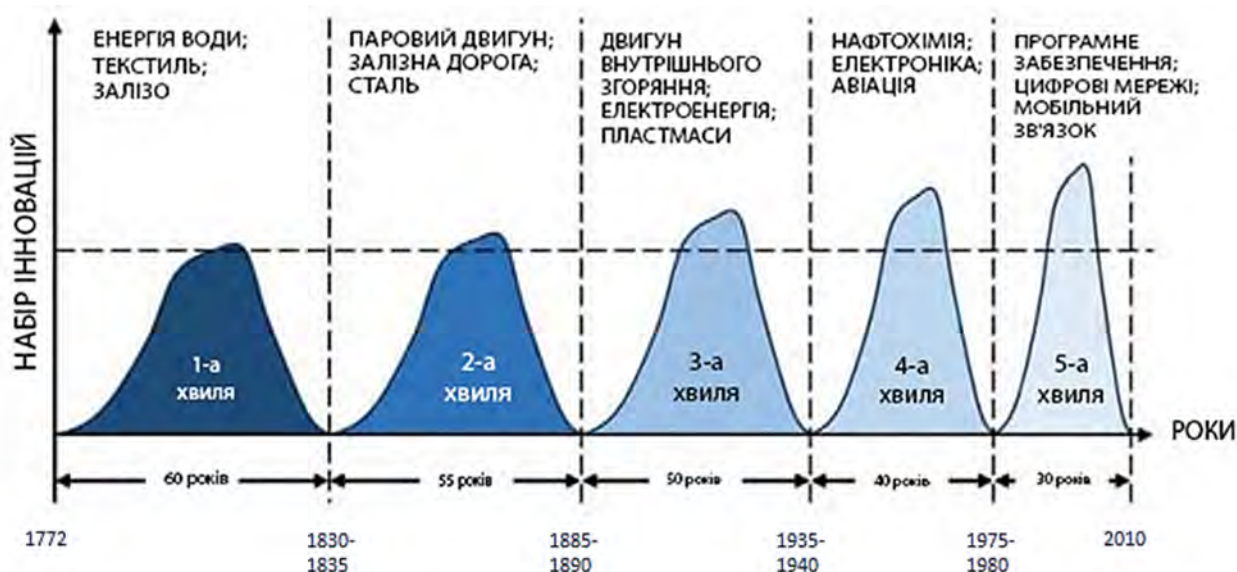
Рис. 1. Тенденція розвитку інноваційних циклів економічної кон'юнктури [4]

Варто зазначити, що відповідно до критеріїв віднесення розвитку країн та регіонів до територій неоіндустріального розвитку (табл. 1), а також показників динаміки питомої ваги валової доданої вартості (ВДВ) видів послуг у ВВП по Донецькій області (рис. 2), маємо наявні докази приналежності сучасного етапу соціально-економічного розвитку Донецького регіону до першої фази неоіндустріального етапу розвитку.