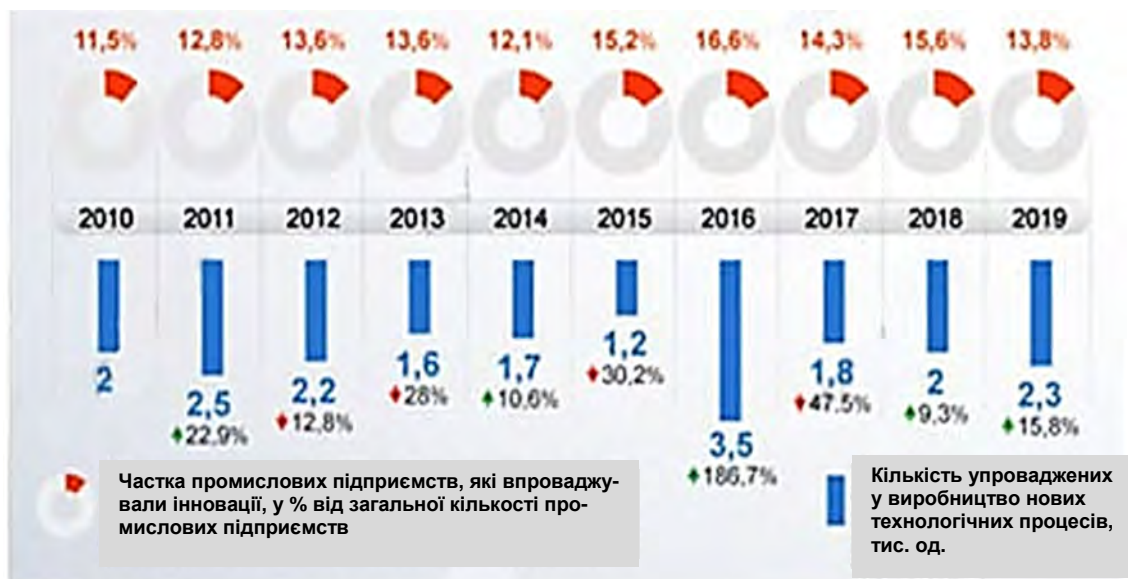
Рис. 4. Результати наукових досліджень у впровадженні інновацій на промислових підприємствах у 2010-2019 рр. [14]

від школи до Європи» [11; 15]. У той же час, за результатами аналітичних досліджень, за останні декілька років рівень наукоємності продукції на промислових підприємства залишається вкрай низьким (рис. 4).