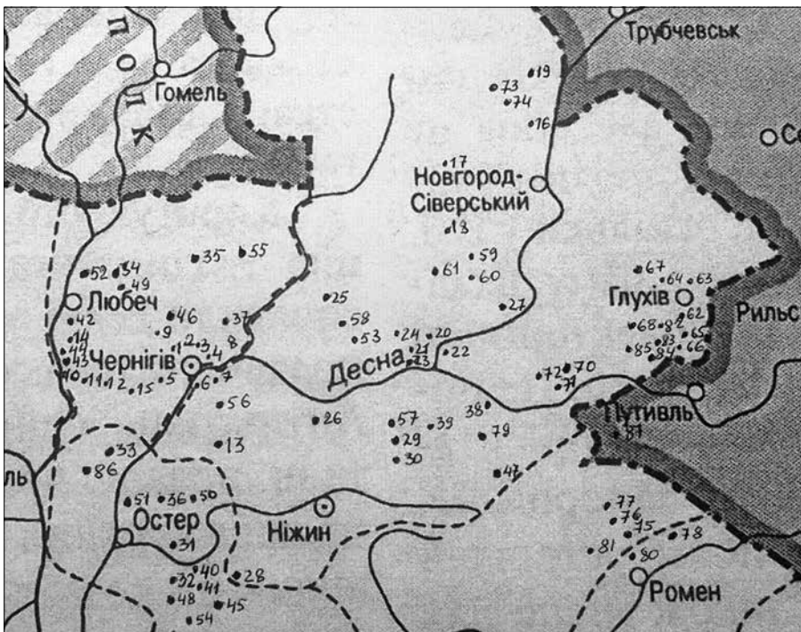
Рис. 1. Топографія розміщення скарбів монет Сіверщини другої половини XVII ст. (за даними А. Ключова)