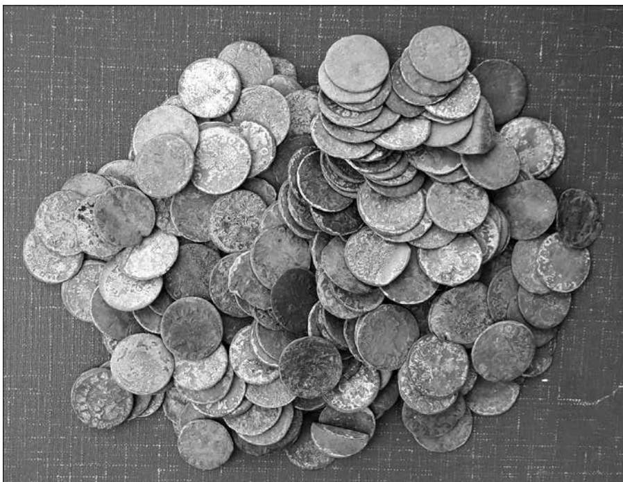
Рис. 2. Скарб XVII ст. із с. Будища Глухівського району, знайдений 2019 р. на території колишнього Глухівського Петропавлівського монастиря. Фонди Національного заповідника «Глухів»

Із 20 країн Європи та Сходу, зафіксованих у наших дослідженнях, монети Московського царства, переважно срібні «єфимки з признаком», копійки – «чешуйки» Михайла Романова (1613–1645) та Олексія Михайловича (1645–1676), займають 6 місце в загальному рейтингу країн-емітентів та здебільшого використовувалися у грошовому обігу разом із європейськими монетами переважно як дрібна