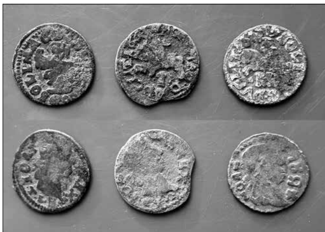
Рис. 4. Річ Посполита, Ян II Казимир (1648–1676), мідні соліди литовського карбування 1661, 1664, 1666 р. Село Будища Глухівського району Сумської області, 2019 р. Фонди Національного заповідника «Глухів»