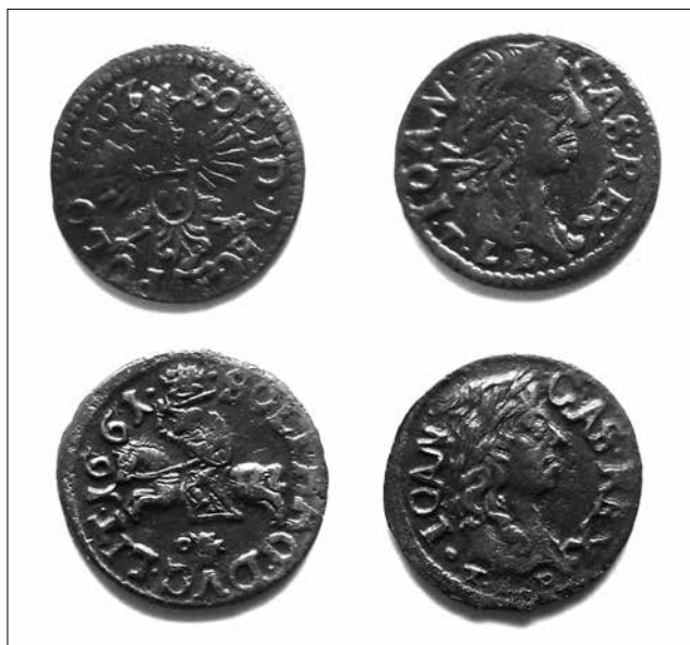
Рис. 6. Річ Посполита, Ян II Казимир (1648–1676), мідний солід коронний 1663 р., солід литовський 1661 р. Село Будища Глухівського району Сумської області, 2009 р.

у 1662 р. за 10 мідних копійок на ринку давали 1 срібну, а у 1663 р. вона коштувала вже 15–20 мідних копійок [17, с. 170.]. 15 червня 1663 р. карбування мідних копійок царським указом було припинено. Було відновлено карбування срібної копійки за монетною стопою 1632 р. та розпочалося прийняття до казни мідних копійок у наступному співвідношенні: за 100 мідних копійок видавали від 5 до 1 срібної копійки [13].