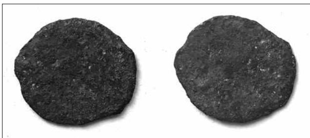
Рис. 7. Московське царство, Олексій Михайлович (1656–1663), мідна копійка. Вага 0,56 г, діаметр 13 x 11 мм. Село Будища Глухівського району Сумської області, 2019 р. Фонди Національного заповідника «Глухів»

Посполитої Яна II Казимира) складає 0,75 г, що удвічі менше встановленої метричної норми. Їх діаметр становить 14–16 мм. Великий розрив у діаметрі і вазі солідів від 0,24 г до 1,27 г окремих екземплярів свідчить про те, що серед них наявні фальшиві монети. Наприклад, у 30 монетах (25 %) вага коливається від 0,24 до 0,65 г, у 90 монетах (75 %) – від 0,66 до 1,27 г (Табл. 2).