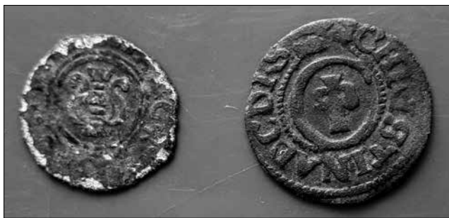
Рис. 3. Прибалтійські володіння Швеції, Христина (1632–1654), білонний та мідний соліди. Село Будища Глухівського району Сумської області, 2019 р. Фонди Національного заповідника «Глухів»