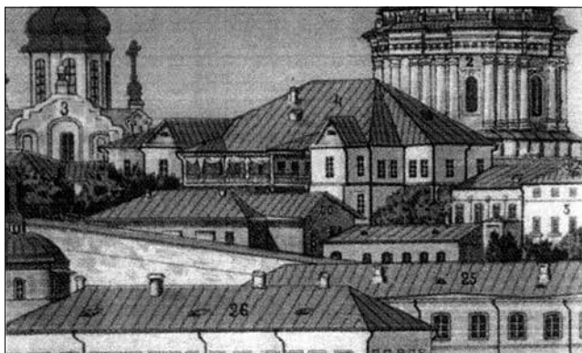
Рис. 3. Загальний вигляд Будинку митрополита з південного сходу. Хромолітографія. 1902 р. Фрагмент

робили фасади будівлі, вирішеної у бароковій стилістиці, дуже пластичними.