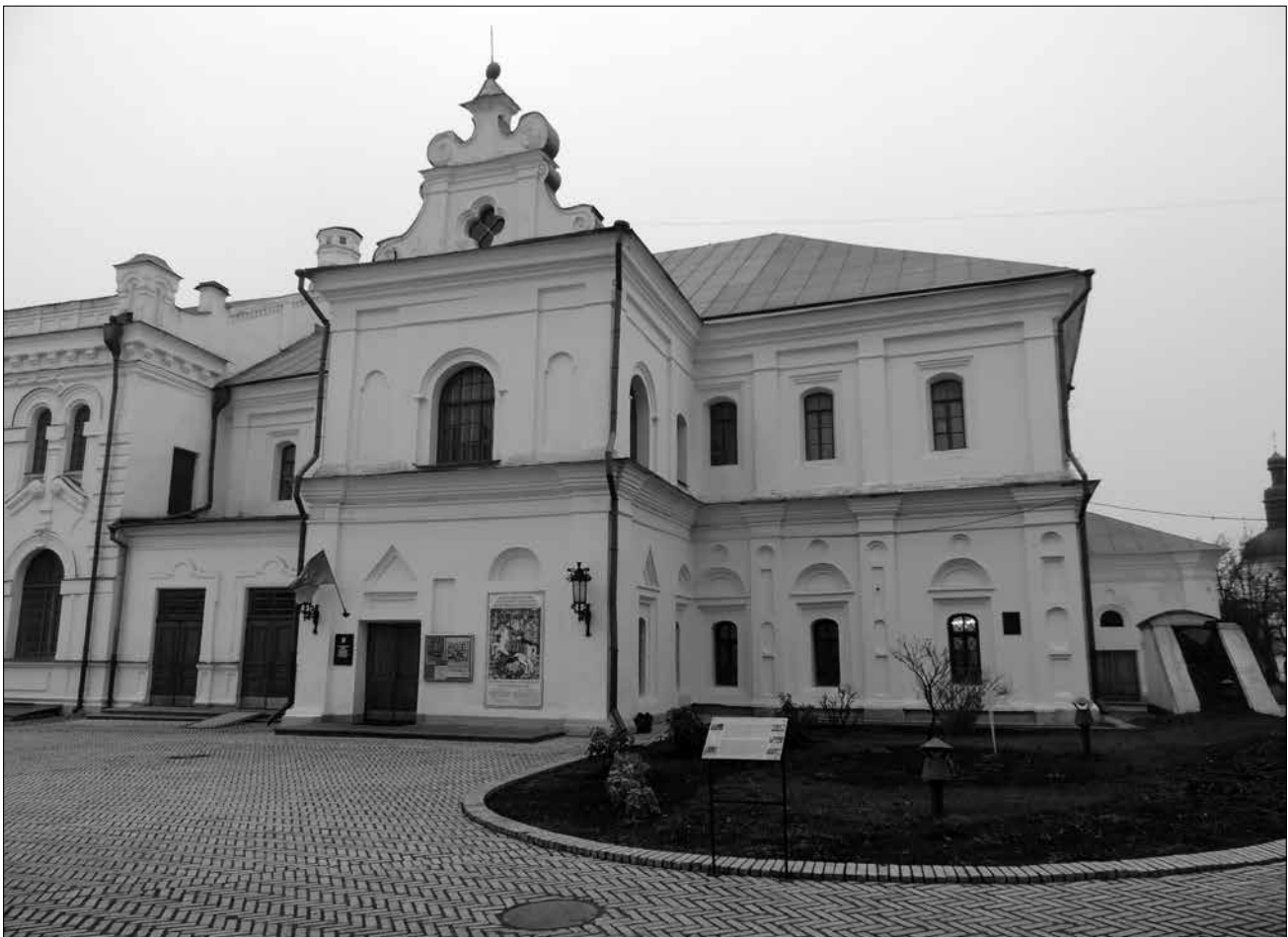
Рис. 1. Будинок митрополита. Сучасний стан. Загальний вигляд з боку головного фасаду.

які були виконані наприкінці 1950-х – на початку 1960-х років на одній із знакових пам'яток архітектурного ансамблю Києво-Печерської лаври – Будинку митрополита на території Верхньої лаври.