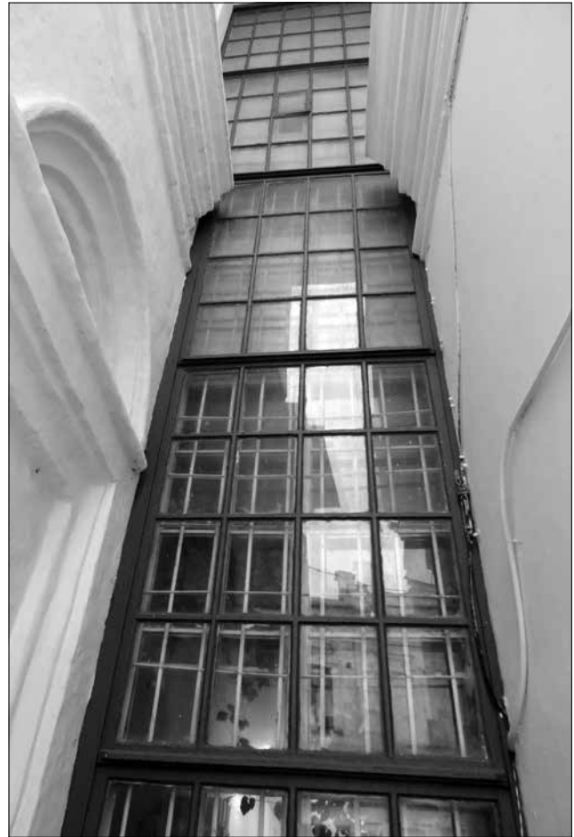
Рис. 9. Засклення прорізу на західному фасаді між північним і південним корпусами Будинку митрополита. Сучасний стан.

них прорізів, оскільки їхні сліди не знайдені;