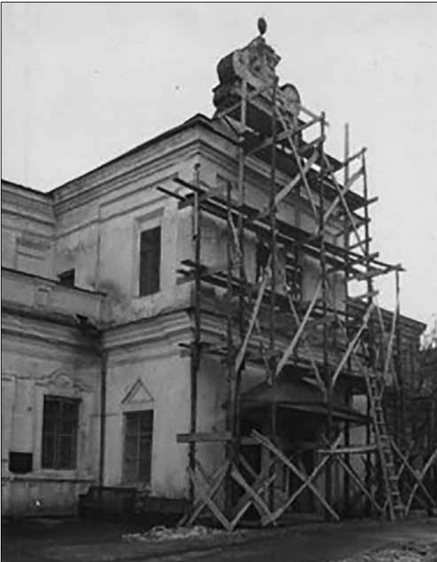
Рис. 8. Виконання реставраційних робіт об'єму двоповерхового тамбура з боку головного фасаду Будинку митрополита. Фото початку 1960-х рр.

Незадовго до завершення виконання реставраційних робіт замовник – Музей українського мистецтва – побажав змінити рішення щодо входу в музей (згідно з проектом вхід передбачався із східної сторони тамбура, на його первісному місці). Йдучи назустріч побажанням замовника, авторка проекту перенесла головний вхід на північний фасад тамбура на місце віконного прорізу (при цьому зберігалася верхня частина наличника цього віконного прорізу і трикутний сандрик над ним) (Рис. 8). По другому поверху після додаткових досліджень було віднайдено первісне профілювання наличників віконних прорізів [7, с. 16].