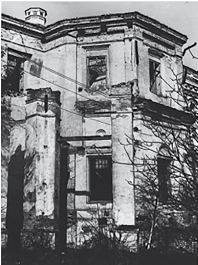
Рис. 6. Правий ризаліт південного фасаду Будинку митрополита з боку Митрополичого саду. Фото кінця 1950-х рр.

обох корпусів огинали зовнішні кути і заходили в цю щілину між корпусами [7, с. 8–9].