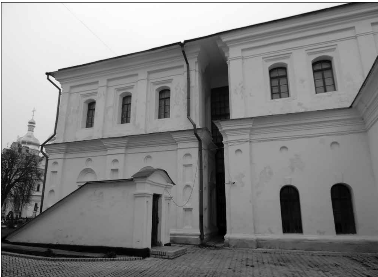
Рис. 5. Західний фасад Будинку митрополита. Сучасний стан.

ського державного заповідника-музею «Кієво-Печерська лавра» з метою його пристосування для розміщення музею українського мистецтва [14, с. 1–2]. Пристосування пам'ятки для музейної функції дозволяло максимально повно розкрити її історико-культурну цінність. При цьому передбачалося розташування на першому поверсі адміністративних кімнат, на другому – виставкових приміщень. Однією з основних умов такого характеру пристосування пам'ятки було виключення зустрічних потоків екскурсантів. Планове завдання передбачало здійснення авторського нагляду за виконанням реставраційних робіт, а після їх завершення складання наукового звіту. Особливо відзначалося, що в процесі реставрації можливі додаткові дослідження з обов'язковою їх фотофіксацією [14, с. 1–2].