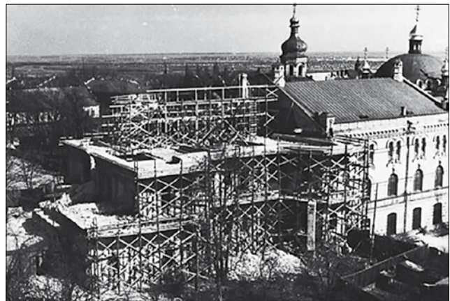
Рис. 7. Проведення реставраційно-відновлювальних робіт на Будинку митрополита. Загальний вигляд з півдня. Фото початку 1960-х рр.

Разом з тим, на ухвалення проєктних рішень певний