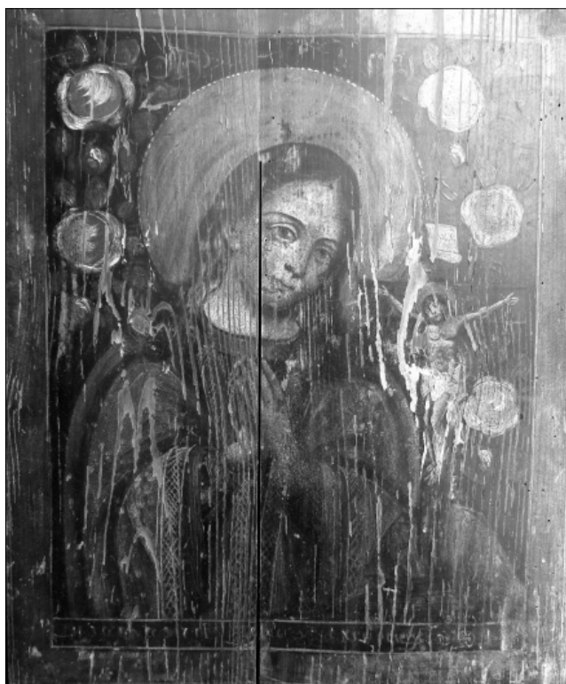
Рис. 9. Ікона «Охтирська Богородиця». Друга половина XIX ст. та орнаментована рамка, яка обрамляє зображення, може свідчити, що ікона була написана чугувським майстром. Внизу ікони – напис, як і на іконах із цього осередку, розділений зображенням двоголового орла (герб Російської