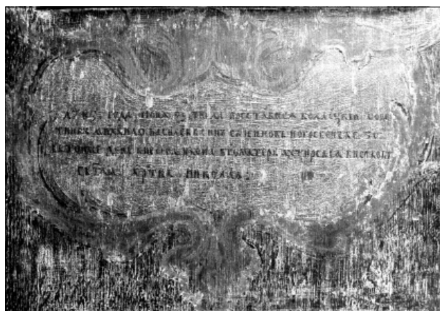
Рис. 4. Напис на зворотному боці ікони «Охтирська Богородиця». 1785 р.

якого була передача експресії, напруги, надзвичайної скорботи, екзальтованості, містичних настроїв та різних видів. Відомі, наприклад, картини знаних художників про моління святих, донаторів, духовних осіб перед Розп'яттям, наприклад: Ель Греко «Св. Франциск молиться пе-