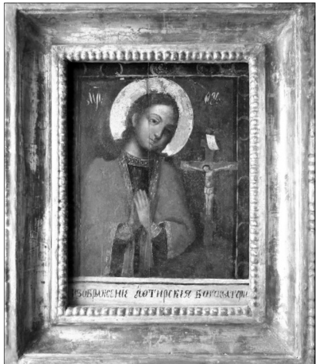
Рис. 1. Ікона «Охтирська Богородиця». Кінець XVIII – початок XIX ст.

Серед сільських і міських верств населення значного поширення та розповсюдження мали списки відомих чудотворних ікон. Поряд з такими чудотворними іконами Чернігівщини, як «Троїцько-Іллінська Богородиця», «Слецька Богородиця», «Домницька Богородиця», «Дігтярівська Богородиця», «Любецька Богородиця», «Ладинська Богородиця», «Іржавецька Богородиця», «Мохнатинська Богородиця», «Руденська Богородиця», «Леньківська Богородиця», «Баликінська Богородиця» у великій пошані була ікона «Охтирська Богородиця» – найбільш відома чудотворна ікона Слобожанщини, порубіжного з Чернігово-Сіверщиною регіону. Зібрання