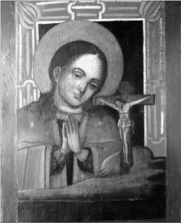
Рис. 10. Ікона «Охтирська Богородиця». Кінець XIX ст. – початок XX ст.

У зібранні заповідника зберігаються також дві ікони «Охтирська Богородиця», написані у манері народних ікон Північної Чернігівщини, близькій до народного малюнка та декоративного розпису: жовте орнаментоване тло, світле зображення Богородиці на всю площину ікони, досить схематичне та площинне, оздоблене по кутках крупними квітами, що свідчить про написання ікон у цьому регіоні. Ікони (КН-1633, И-2-821, КТВ-217/448) (Рис. 6, 7) мають практично однакові розміри (52 x 43 см), складаються з двох дошок, із двома шпугами. Для кожної ікони властива конкретна індивідуальність у зображенні Богородиці з широким золотавим німбом навколо голови, на якому є напис «Образъ Богородицы Ахтырскія». Близькою до цього кола ікон за розмірами та стилем є ікона «Охтирська Богородиця», яка була передана у 1988 р. з Миколаївської церкви с. Гірськ Щорського району Чернігівської обл. (КН-796/4, И-І-411) (Рис. 8), а також ікона «Охтирська Богородиця», що надійшла до заповідника 1995 року (КН-1177, И-2-736) (Рис. 9). Проте, ці ікони відрізняються від двох вищеназваних більш темним колоритом. Зображення Богородиці та крупнопелюсткові квіти угорі розміщені на темному тлі.