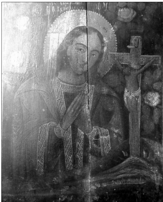
Рис. 8. Ікона «Охтирська Богородиця». Друга половина XIX ст.