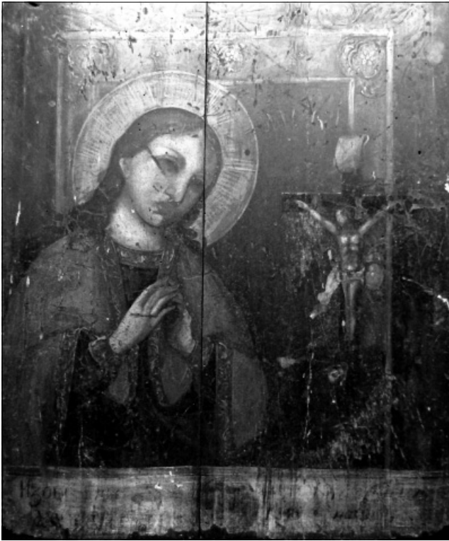
Рис. 5. Ікона «Охтирська Богородиця». 1848 р.

личчя створюють цікавий образ української Діви Марії. Перед Богородицею, зліва, на пагорбі – невелике Розп'яття, написане достатньо спрощено, проте з деякими реалістичними деталями: з ран, де цвяхи пробili руки та ноги Христа, з рани під ребром, виразно стікають червоні краплі крові. Ікона обрамлена невеликою рамкою. Внизу ікони напис: «Изображеніе Ахтирскія Богоматерь». Стилiстичні особливості ікони, яскравий, виразний колорит дозволяє датувати ікону кінцем XVIII – початком XIX ст.