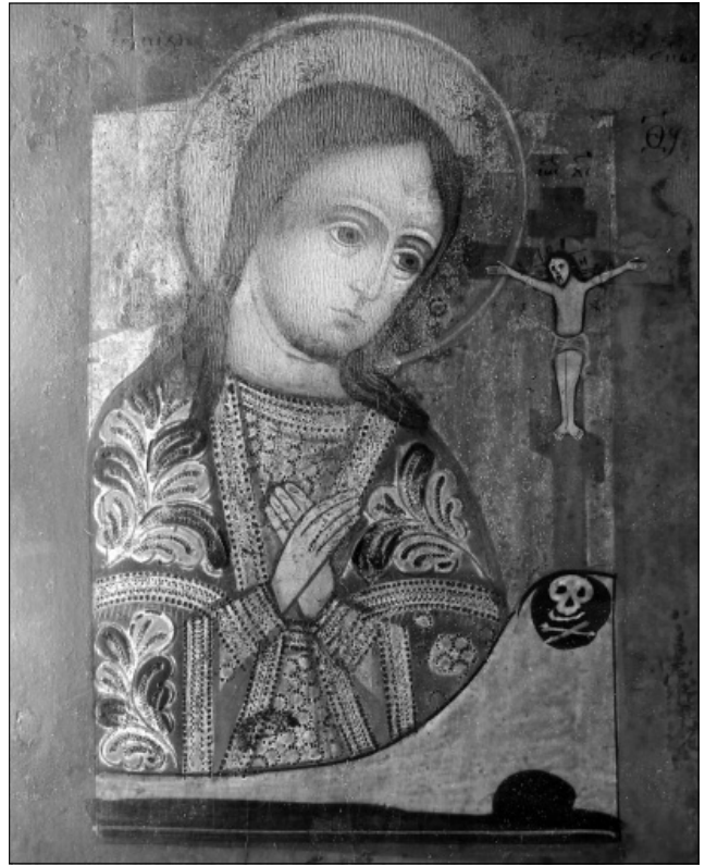
Рис. 11. Ікона «Охтирська Богородиця». XIX ст.

Ще одна народна ікона «Охтирська Богородиця» була придбана заповідником у 1998 р. (КН-1530, И-2-789) (Рис. 10). Її розміри 37 x 26 см, дошка з однією шпугою. На відміну від двох попередніх ікон із квітками, ця ікона написана у дещо іншій манері. Вона в якійсь мірі наслідує традиційні ікони «Охтирська Богородиця», на-