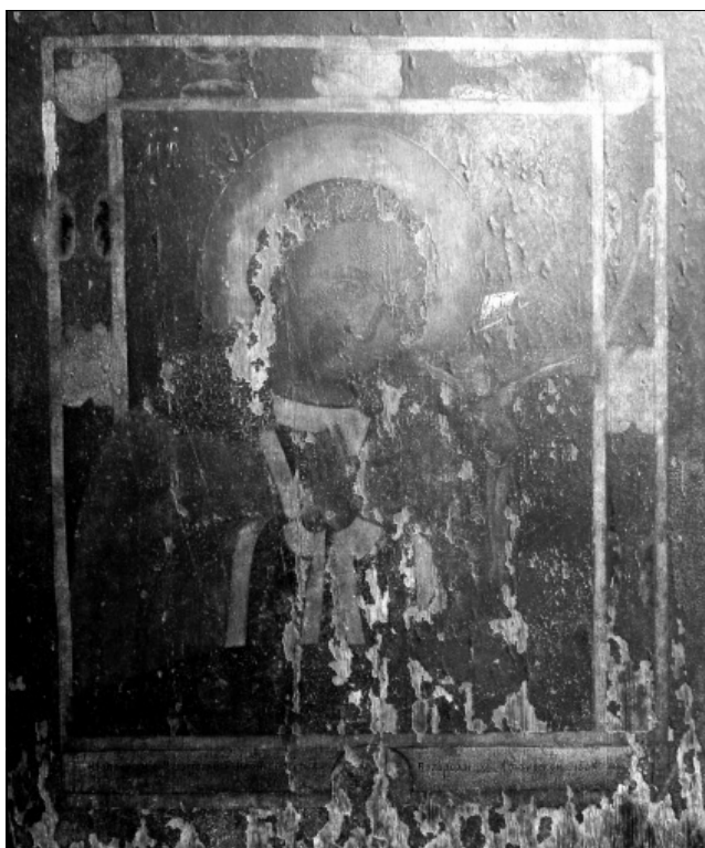
Рис. 3. Ікона «Охтирська Богородиця». 1785–1864 рр.

якого була передача експресії, напруги, надзвичайної скорботи, екзальтованості, містичних настроїв та різних видів. Відомі, наприклад, картини знаних художників про моління святих, донаторів, духовних осіб перед Розп'яттям, наприклад: Ель Греко «Св. Франциск молиться пе-