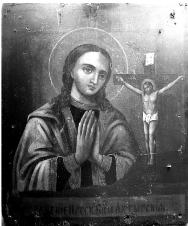
Рис. 2. Ікона «Охтирська Богородиця». Друга половина XIX ст.