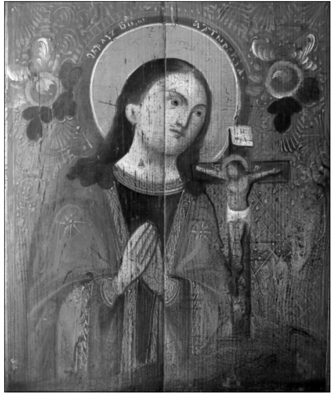
Рис. 6. Ікона «Охтирська Богородиця». Друга половина XIX ст.

Ікона «Охтирська Богородиця», яка була придбана у мешканця м. Чернігова 1985 р. (КН-673/2, И-2, 621) (Рис. 3), написана на дошці олійними фарбами, її розміри 39 x 31,5 см,