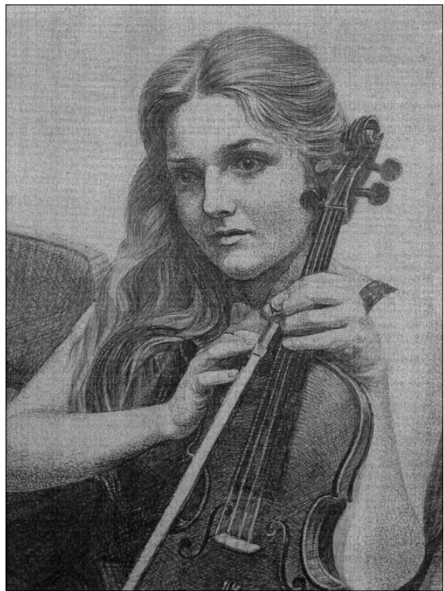
Лл. 3. М. Ковальов «Перший урок» (графіка)

Позначене рисами яскравої художньої самобутності, декоративно-прикладне і народне мистецтво зробило великий внесок в художню культуру того часу.