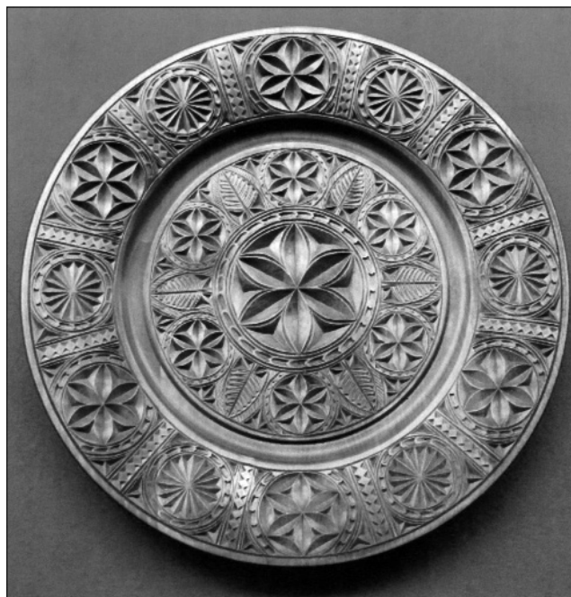
Лл. 5. А. Колошин «Таріль» (різьба по дереву)

Виготовлення побутових і господарських речей з дерева було поширене і набуло особливого розвитку в Чернігівській, Київській, Полтавській, Івано-Франківській та інших областях. Тут були зосереджені майстри-деревообробники, інколи цілі сім'ї, у яких майстерність передавалась від батька синові. Продукція таких майстерень, так само як гончарських і ткацьких, художньої вишивки, вивозилась для продажу на ярмарки, іноді на досить