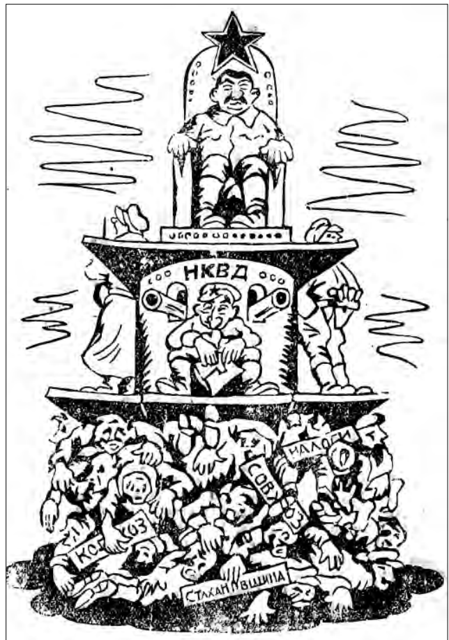
Рис. 1. Жовтень 1942 р. «Останні вісті» (Кролевець)

Історія преси періоду Другої світової війни продовжує залишатися недостатньо вивченою. Так, різняться думки істориків стосовно кількості видань, що виходили друком в адміністративно-територіальних межах сучасної України. Якщо І. Чайковський подавав перелік з 220 позицій [1],