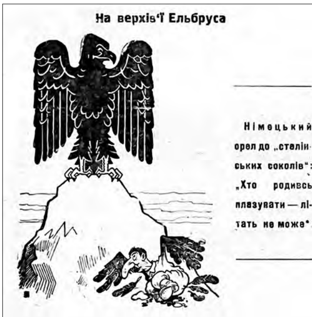
Рис. 8. «На верхів'ї Ельбруса». 23 грудня 1942 р. «Відродження» (Ромни)

ми радянськими гаслами: «колхоз», «стахановщина», «совхоз», «налоги» [21, с. 2].