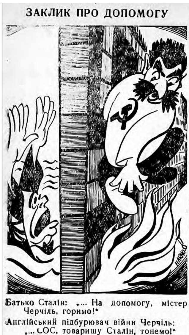
Рис. 6. «Заклик про допомогу». 2 жовтня 1942 р. «Голос Охтирщини»