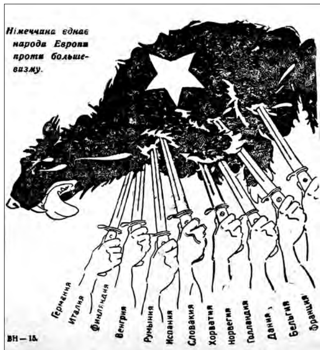
Рис. 9. «Німеччина єднає народи Європи проти большевизму». 29 квітня 1942 р. «Сумський вісник»

Головними персонажами даної тематичної групи були образи так званої «великої трійки»: Й. Сталін (СРСР), В. Черчилль (Англія), Ф. Рузвельт (США). Передусім критикувалися територіальні зазіхання лідерів