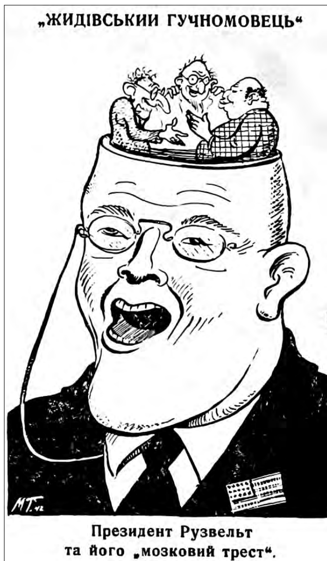
Рис. 12. «Жидівський гучномовець». 21 червня 1942 р. «Голос Охтирщини»