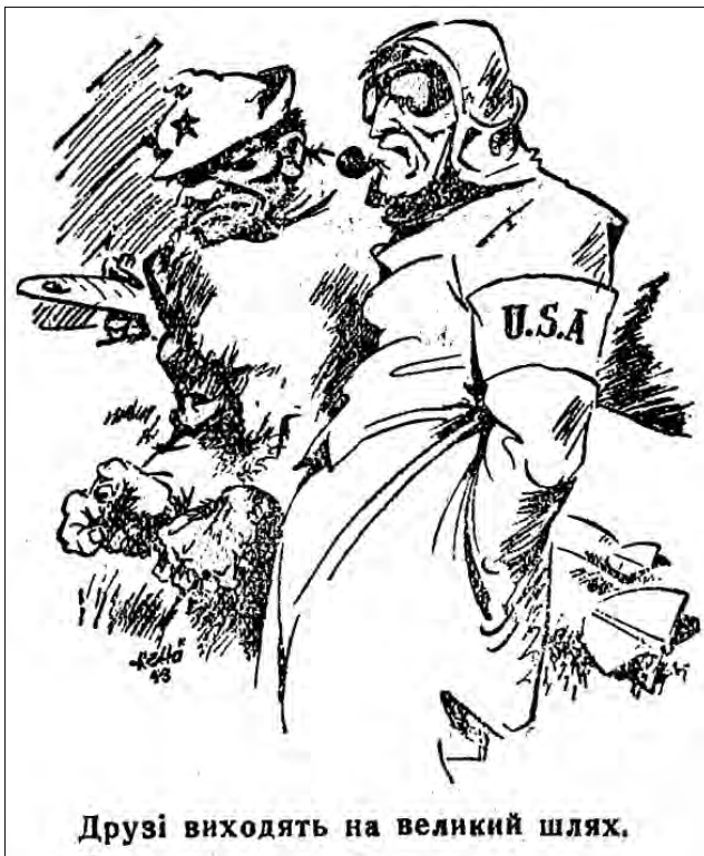
Рис. 2. «Друзі виходять на великий шлях». 6 серпня 1943 р. «Голос Охтирщини»