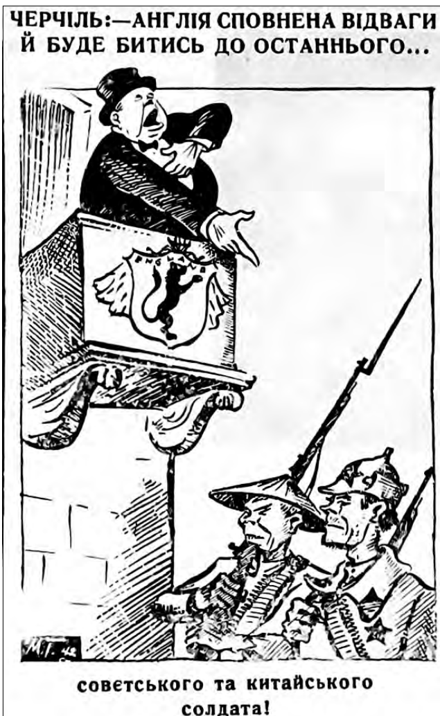
Рис. 11. «Англія сповнена відваги й буде битись до останнього...». 21 червня 1942 р. «Голос Охтирщини»

ків: «А ну ще трохи, Сталіночку, ану принатужся, куме, може й ухопиш!» [28, с. 3].