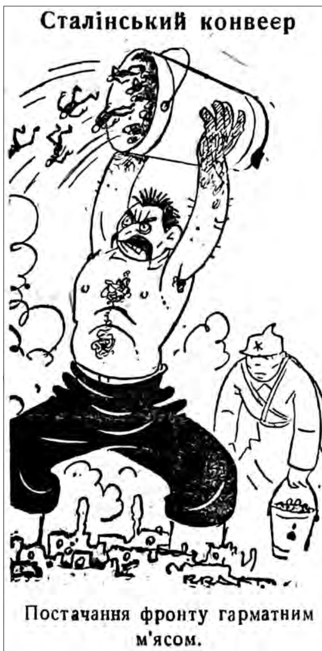
Рис. 17. «Сталінський конвеєр». 23 травня 1942 р. «Голос Охтирщини»

англо-саксів у безвихід». Символічним є зображення у «Сумському віснику» за 28 жовтня 1942 р., де британський солдат стоїть на кладці (переправі), тримаючи в руках величезну кам'яну брилу (другий фронт), яка з легкістю потягне його на дно водоймища [75, с. 3]. За таких обставин цілком передбачуваним є подив «батьки Сталіна» з карикатури «Перейшли до наступу» у «Сумському віснику» за 25 вересня 1942 р., коли до нього долітає радіоповідомлення про наступ німців: «Що? Наці?! А не англійці, як обіцяно?!» [76, с. 2].