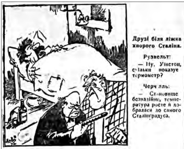
Рис. 20. «Друзі біля ліжка хворого Сталіна». 14 жовтня 1942 р. «Сумський вісник»