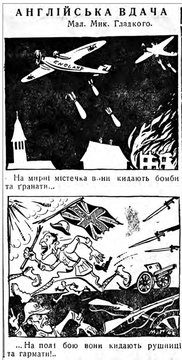
Рис. 18. «Англійська вдача» (мал. Мик. Гладкого). 2 липня 1942 р. «Голос Охтирщини»

Успіхи та невдачі на Східному фронті суттєво залежали від своєчасної допомоги союзників, яку ті надавали за програмою ленд-лізу. За її умовами в СРСР надхо-