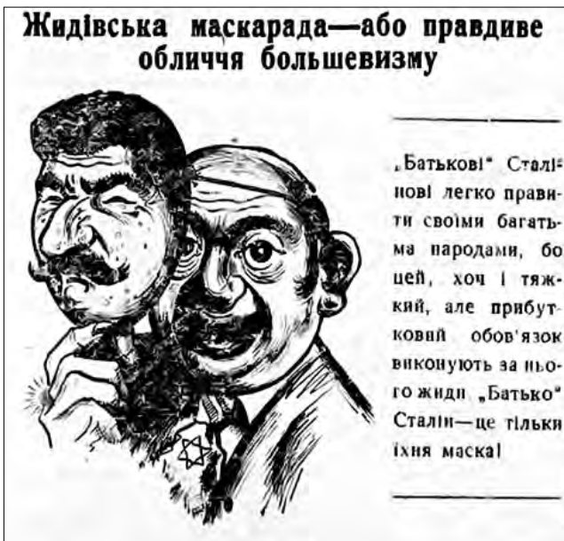
Рис. 10. «Жидівська маскарада – або правдиве обличчя большевизму». 21 серпня 1942 р. «Відродження» (Ромни)