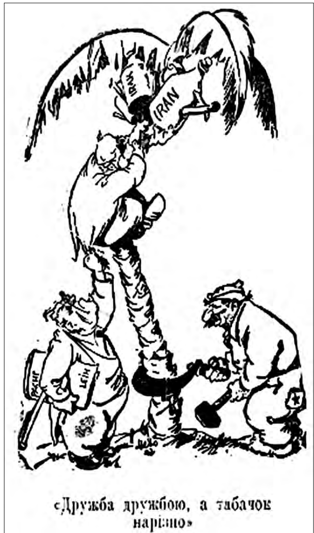
Рис. 5. «Дружба дружбою, а табачок нарізно». 26 липня 1942 р. «Сумський вісник»

Графічний матеріал для видань переважно створювався на території Німеччини підвідомчими структурами пропаганди, натомість місцеві пропагандисти могли хіба що наповнювати його своїми підтекстовками. До речі, відповідно до інструкцій міністерства східних окупованих територій від березня 1942 р. пресу на міс-