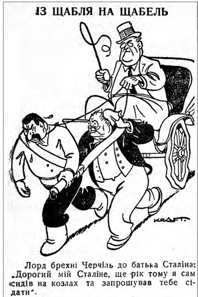
Лорд брехні Черчіль до батька Сталіна: «Дорогий мій Сталіне, ще рік тому я сам сидів на козлах та запрошував тебе сидати».