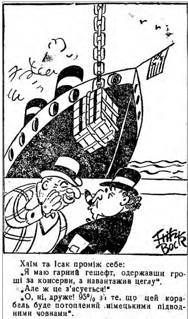
Рис. 16. «Я маю гарний гешефт...» 1 серпня 1943 р. «Голос Охтирщини»

Тематично близьким до теми взаємин між союзни- ками було питання відкриття другого фронту, вирі-