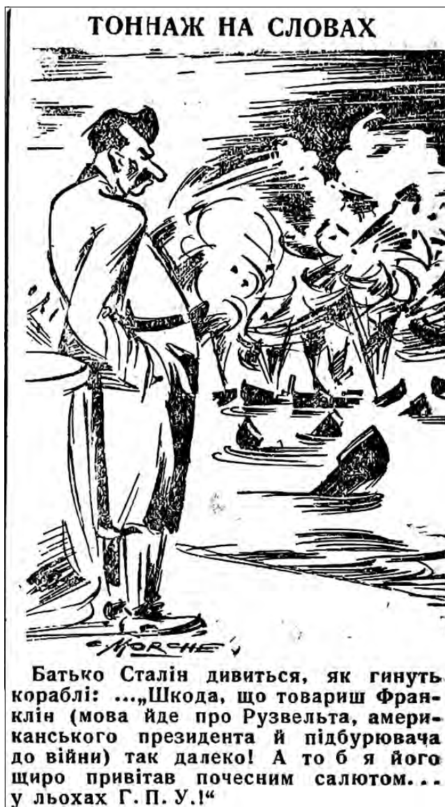
Рис. 14. «Тоннаж на словах». 27 вересня 1942 р. «Голос Охтирщини»

пробудженні Сталіна» (газета «Сумський вісник» за 22 липня 1942 р.). «Де ГПУ? – Я ж казав, що советська зима тягнеться до кінця вересня!...» – гнівно вигукував він [28, с. 2]. З приходом весни, натякав «Сумський вісник», війна на Сході завершиться перемогою Третього Рейху. Безкраї поля СРСР вкриються квітами зі свастикою на бутонах («Прокляття! Ось-ось весна почнеться!») [51, с. 3], а сталінський серп буде безсилим перед міцністю німецьких ножів-багнетів («Його турботи») [52, с. 2]).