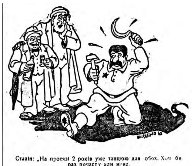
Рис. 13. «На протязі 2 років уже танцюю для обох...». 13 січня 1943 р. «Сумський вісник»

Окремо можемо згрупувати карикатури, в яких висміюються деякі постаті антигітлерівської коаліції.