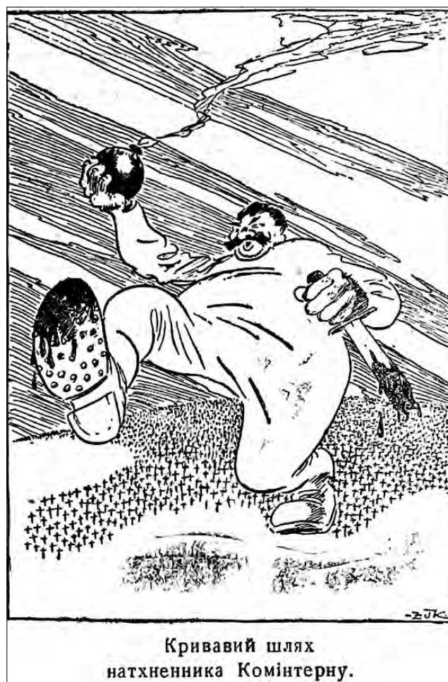
Рис. 7. «Кривавий шлях натхненника Комінтерну». 30 травня 1943 р. «Голос Охтирщини»

У карикатурах даної тематичної групи художники насамперед звертали увагу на «справжню природу більшовизму» як людиноненависницького режиму. Так, карикатура «Советський душогуб» зображувала енкаведиста, який серед ночі виймає з торбини людей та вкидає їх до задалегідь викопаних ям. Поряд подано інформаційну довідку: «У Вінниці по-звірячому було замордовано енкаведистськими катами в період 1937–