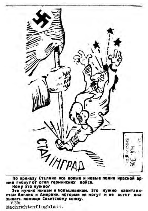
Рис. 21. 3 жовтня 1942 р. «Последние известия»

мецьких ножів-багнетів у карикатурі «Запізно Сталін переконався!» («Відродження», 29 червня 1943 р.) [92, с. 1], він відрами і без перестану кидає на фронт «гарматне м'ясо» у малюнку «Сталінський конвеєр» («Голос Охтирщини», 23 травня 1942 р., рис. 17) [93, с. 2], радянські гармати вже після першого пострілу направляють дула в свій бік, як на зображенні «Пізно схаменуся» («Голос Охтирщини», 16 жовтня 1942 р.) [94, с. 2].