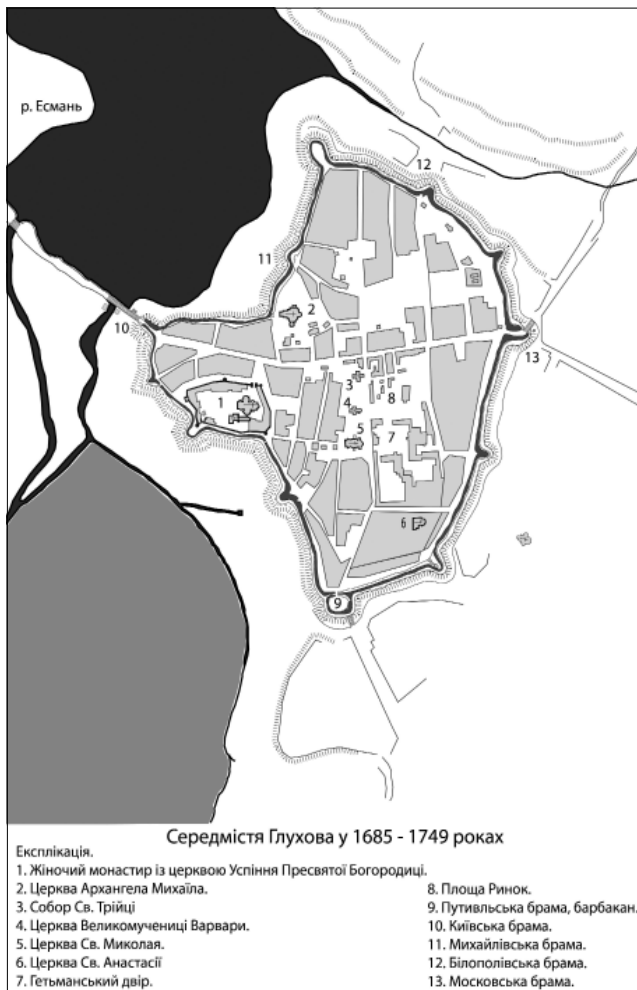
Рис. 2. Середмістя Глухова у 1685–1749 роках. Опрацювання автора

старанням пані гетьманової Анастасії Скоропадської споруджують муровану церкву Святої Анастасії [15, с. 31].