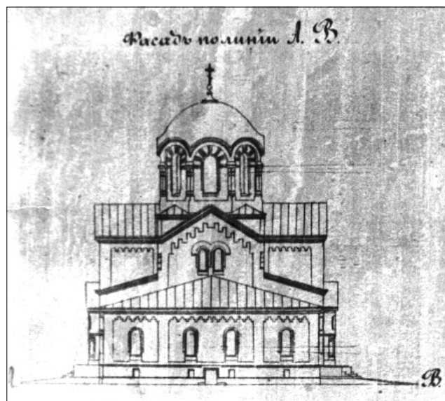
Рис. 4. Западный фасад храма согласно «изменительному» проекту [РГИА, ф. 220, оп. 1, д. 447, л. 14]