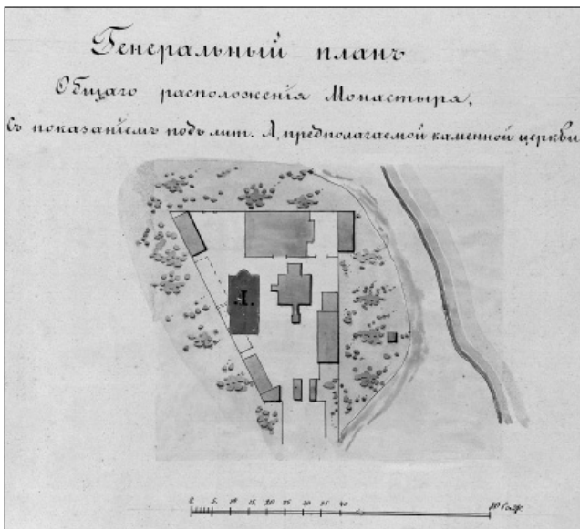
Рис. 5. Генеральный план общего расположения [Молченского] монастыря [РГИА, ф. 220, оп. 1, д. 447, л. 9] принято решение снести «два ветхих каменных флигеля, ненужных для обители» [2, л. б/н].

Исходя из плана, два «ненужных» флигеля стояли на одной линии с северными фасадами трапезной и корпуса бывшего духовного училища (рис. 5), то есть представляли собой пристройки к древней крепостной стене. Снос этих небольших флигелей мог решить проблему лишь частично, поэтому подрядчик (возможно, сам игумен Иоасаф) пошел на смелый шаг – решил вынести северный фасад будущего храма за пределы древней крепостной стены, пристроив к ней сводчатую галерею (параллельно казематам). Таким образом появилась площадь, достаточная для возведения довольно обширного храма. При этом южный фасад новой церкви не выходил за красную линию уже существовавших зданий, что позволило сохранить прежнюю планировку тесного монастырского двора.