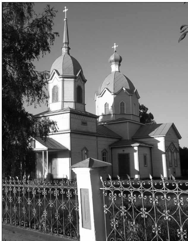
Іл. 1. Михайло-Олександринська церква в с. Шатура. 1886 р. Загальний вигляд.

Зазначена проблематика знайшла відображення у публікаціях Р. Маньковської «Сакральна дерев'яна архітектура України у світовій спадщині» [1], Б. Ворони «Вдосконалення чи спотворення: вплив Синодального указу 1830 року на церковне будівництво на Волині» [2], Я. Тараса «Сакральна дерев'яна архітектура України (X–XXI ст.)» [3], В. Вечерського «Пам'ятки архітектури й містобудування Лівобережної України: виявлення, дослідження, фіксація» [4], І. Бондаренко «Передумови і тенденції стильового розвитку храмової архітектури Слобожанщини (др. пол. XIX – поч. XX ст.)» [5],