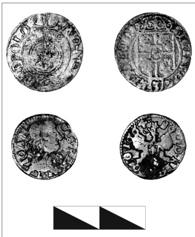
Fig. 6. Obverse and reverse of 17th-century Polish-Lithuanian coins (silver above, copper below). 2018 excavations at Baturyn.

evidence further revealed the destruction of the town's trade and craft districts by the Russian army in 1708. Field research at Baturyn will be renewed in August 2019.