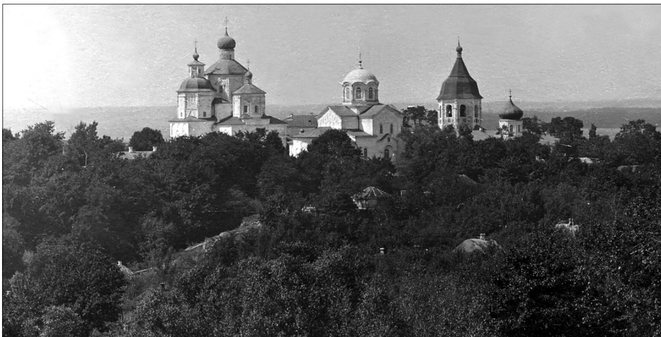
Рис. 1. Общий вид Путивльского Молченского монастыря. Начало XX века.

гих обителях строились храмы в честь Иоанна Предтечи. Путивльский Молченский монастырь – не исключение.