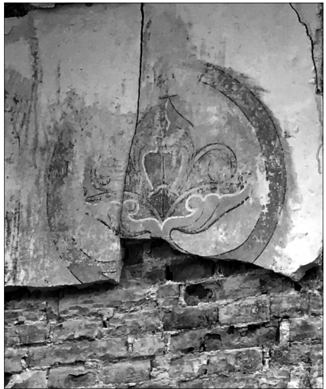
Рис. 6. Фрагмент орнаментальной росписи.

Отдельными деталями своей композиции и декора церковь Рождества Иоанна Предтечи отдаленно напоминает более раннее произведение Давида Гримма – Владимирский собор в Херсонесе Таврическом. Несмотря на различие строительных материалов (тёсаный