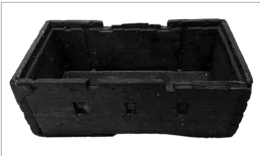
Фото 2. Вулик із пасіки П. Прокоповича інв. № Е-2980

умовами утримання комах, технологією виготовлення, формою, розміром, матеріалом виготовлення. У інвентарній групі «Е» під ін. № 2995 та ін. № 2980» [6] значені вулики з Чернігівщини (2 одиниці) з пасіки, яка належала П.І. Прокоповичу. Вулики експонуються у «Музеї історії бджільництва Середньої Наддніпрянщини». Це – унікальні експонати, які ще не були об'єктами наукового дослідження і заслуговують на окрему увагу.