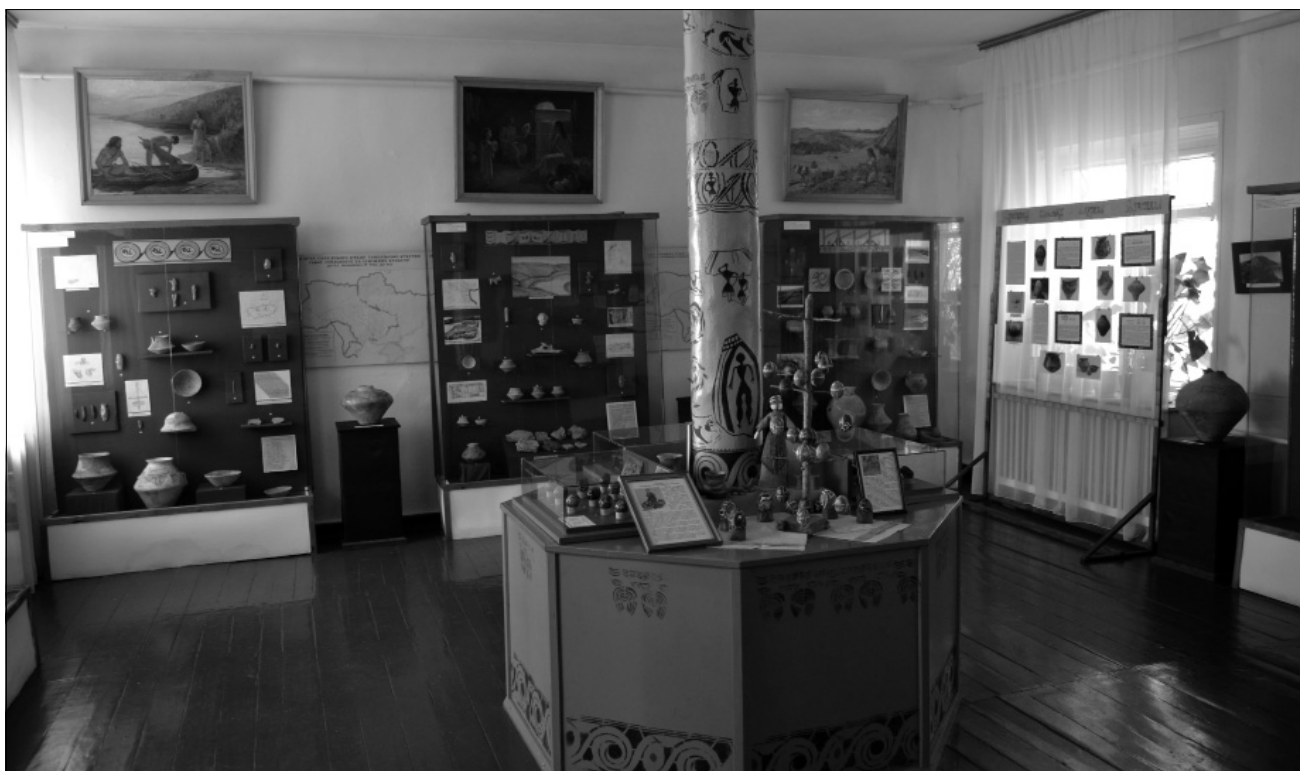
Рис. 4. Фрагмент експозиції Музею трипільської культури НІЕЗ «Переяслав», 2017 р.

па трипільського населення на Лівобережжі Дніпра і, таким чином, ця територія із повним правом включена до основного регіону розповсюдження Трипілля. Представлені археологічні колекції із місцевих пам'яток та з багатьох районів України дали змогу значно розширити та вдосконалити експозицію. Масштабні археологічні розкопки протягом кількох польових сезонів були проведені на поселенні Крутуха-Жолоб на західній околиці Переяслава-Хмельницького [7] та поблизу с. Циблі-Узвіз [2]. В результаті цих робіт вивчено залишки п'яти наземних жител на першому та решток одного на другому поселенні. Проведені дослідження дали змогу встановити розміри поселень, їх планіграфію, характер культурного шару та зібрати значну кількість речових матеріалів.