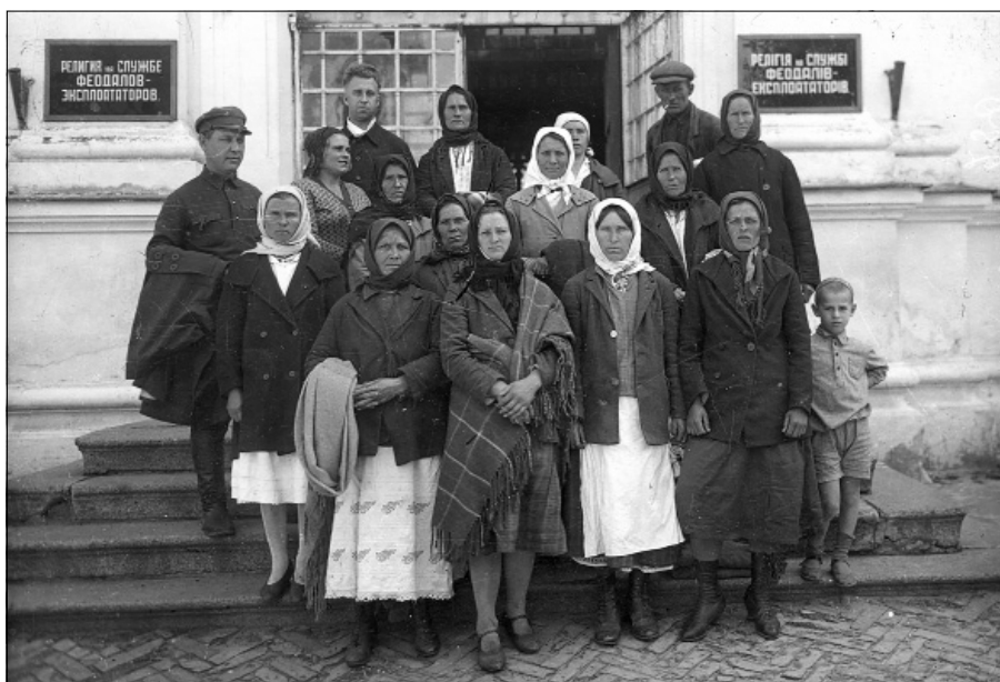
Іл. 5. Відвідувачі Музейного городка біля входу до експозиційного відділу «Релігія на службі феодалів-експлуататорів»

«українського селянського шиття». В музеї нема відділу, що показував би зміст і форми попівського вбрання, як знаряддя класового гніту...» [14].