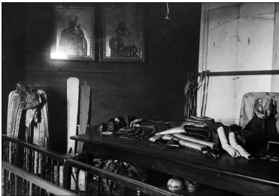
Лл. 10. Експозиційний об'єкт «Майстерня мощей». 1930-ті рр.

ною. «Советская Украина» (лютий 1940 р.) повідомляла, що протягом 2–3 років в музейному містечку «перебывало более десятка директоров, большинство которых на этой работе были случайными людьми». На думку автора статті, безперервна директорська чехарда, невмілий добір кадрів, відсутність належного керівництва з боку Управління у справах мистецтв і НКО УРСР, у відданні яких знаходилися музеї та заповідники Києва, призводили до «вкрай слабкої організаційної постановки справи» в музеях. Не було виявлено належної бережливості до музейних фондів УЦАМ [37].