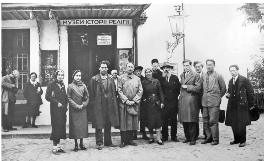
Лл. 1. Група екскурсантів перед входом до Музею історії релігії. Початок 1930-х рр.

Метою цієї розвідки є комплексне вивчення, узагальнення і аналіз експозиційно-виставкової роботи ВМГ та його структурних одиниць – відділів/секцій/фондів/музеїв протягом 1930-х рр.