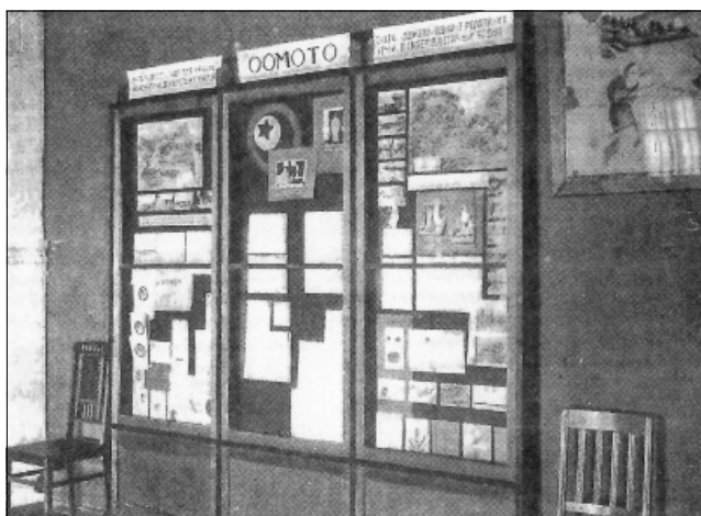
Іл. 3. Виставка матеріалів релігійного вчення «Оомото»

шинізацію сільського господарства, реконструкцію та зріст промисловості, зріст народного прибутку, культурне будівництво та безвірницький рух. Влаштували галерею безвірників, де розмістили портрети «великих буржуазних та пролетарських безвірників» з цитатами з їхніх творів та відповідний етикетаж. Для музею вготували нові тексти задля втілення «самомовности» експозиції [11, арк. 61–62].