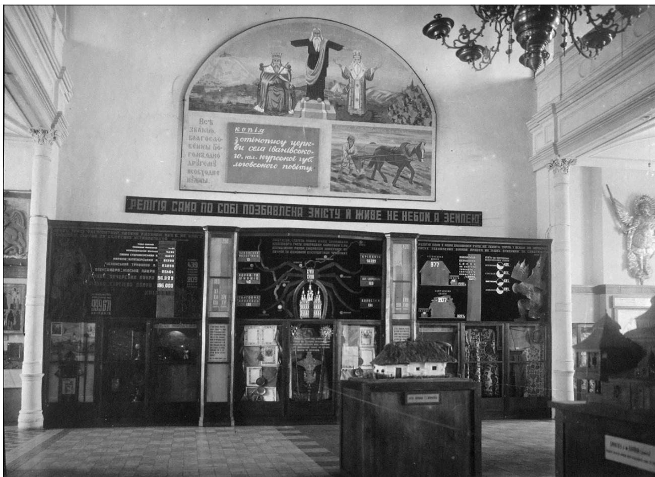
Лл. 6. Фрагмент експозиції відділу «Релігія на службі феодалів-експлуататорів». 30 січня 1935 р.

революційних селянських повстань» [18, с. 307] (іл. 6–8). Побудова експозиції «Релігія на службі феодалів-експлуататорів» розглядалась дирекцією як «перше значне досягнення Музейного городка», що дозволило звільнитись «від буржуазно-націоналістичного мотлоху поданого в вигляді музейного відділу “Православія”» [4, с. 18]. На Ближніх печерах 5 1934 р. змонтували виставку муміфікації, де експонувалися «зразки штучної й природної муміфікації не тільки людей, а й різних тварин» [4, с. 10] (іл. 9) 6 . Новим експозиційним об'єктом ВМГ стали виявлені в Антонієвих печерах «чотири тюремні камери з кільцями» [26, с. 34–35]. У довідкових матеріалах по Музейному городку зазначалося, що «шлях екскурсії у ближні печери йде так: спуска-