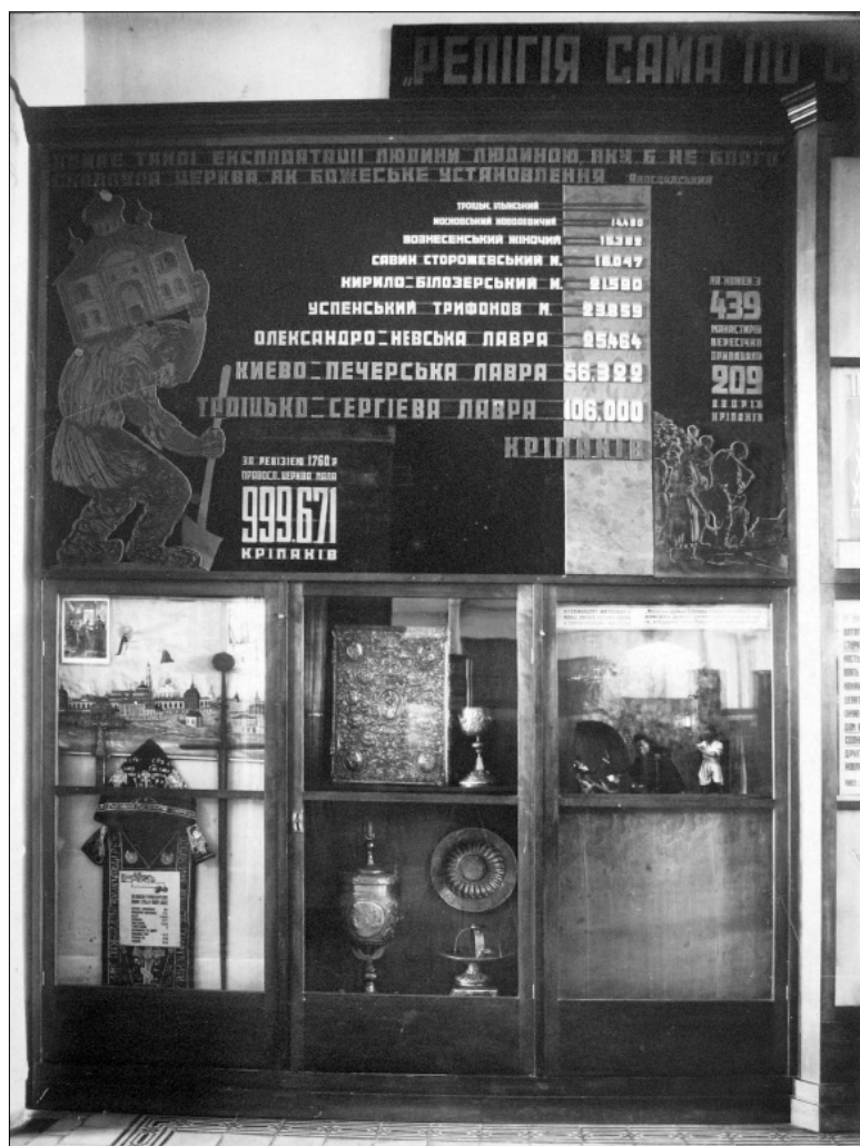
Іл. 7. Фрагмент експозиції відділу «Релігія на службі феодалів-експлуататорів». 30 січня 1935 р. (ІР НБУВ, ф. 243, од. зб. 690)

ції [22, арк. 67]. Однак, враховуючи той факт, що 1935 р. фонди ВІМіШ були переміщені на території ВМГ і музей тимчасово не мав експозицій, Музей України продовжував працювати, приймав відвідувачів до 1937 р. 19 червня 1937 р. Центральний історичний музей 7 видав наказ, згідно з яким відвідувати музей України дозволялося тільки за перепустками вченого секретаря установи, як єдиний експозиційний об'єкт Збірка П.П. Потоцького припинила своє існування [23, с. 293–294]. Станом на 1937 р. «вся збірка (картини, художня мебля, бібліотека тощо) [була] розміщена в 4-х кімнатах і коридорі, з яких в 2-х кімнатах і коридорі розміщені картини, мебля і в решті 2-х кімнатах – бібліотека» [22, арк. 67].