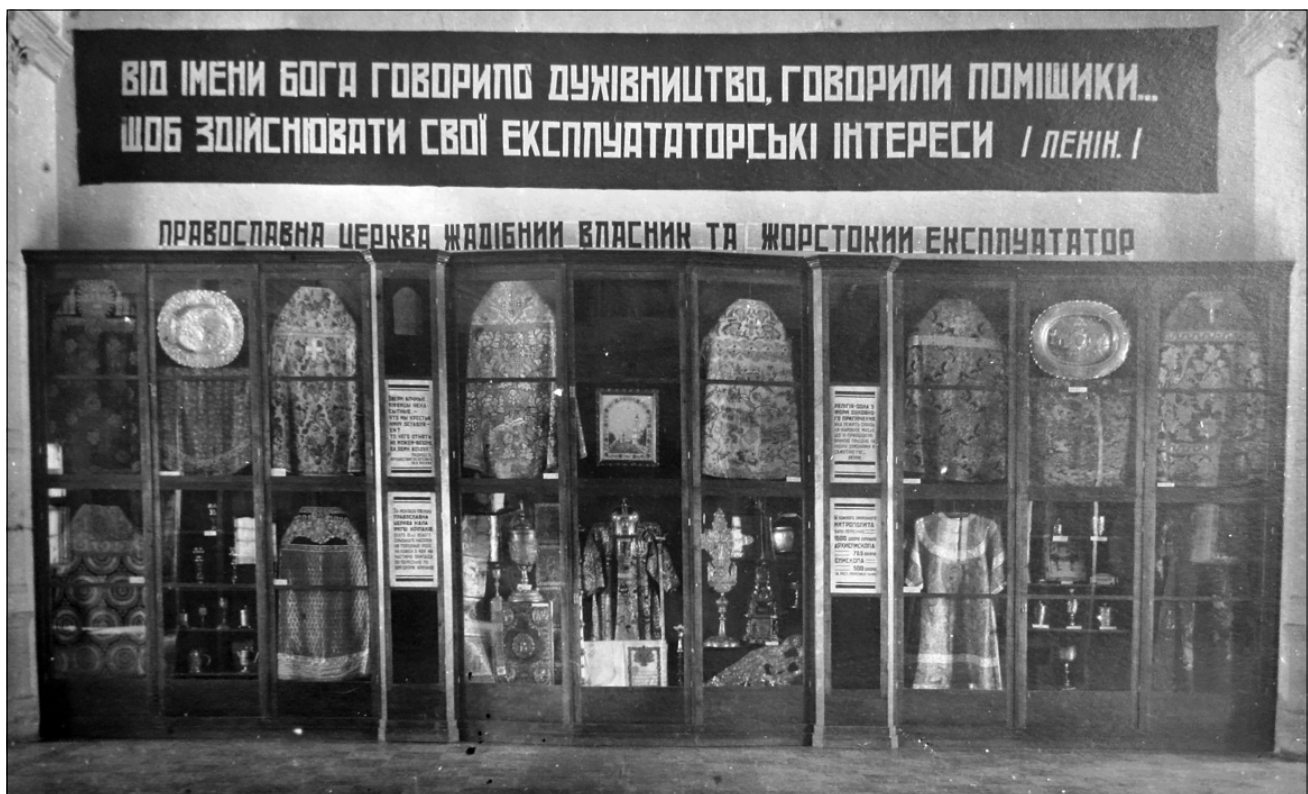
Лл. 8. Фрагмент експозиції відділу «Релігія на службі феодалів-експлуаторів». 1930-ті рр.

далів» 8 і «Церква доби капіталізму» 9 ...». Замість ліквідованих відділів Управління в справах мистецтв вирішило організувати новий музей «історії лаври». Утім, на думку Ю.А. Лесневського і Н.В. Геппенер, кошти, виділені на організацію нової експозиції, використовувалися недоцільно, оскільки ані профіль, ані цільове спрямування музею не були чітко визначені [26].