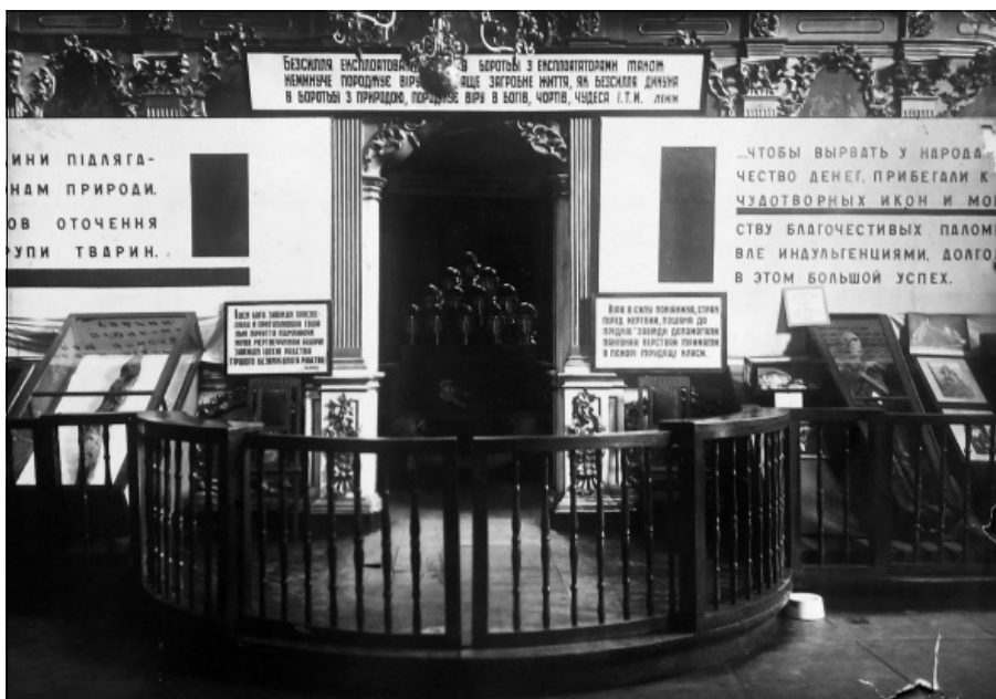
Іл. 9. Виставка муміфікації у Хрестовоздвиженській церкві

кетки і цитати, але й картини. Наприклад, «Духовенство зустрічає Богдана Хмельницького і козачу старшину біля Софійського собору в Києві» – на той час це була ілюстрація до тезису про те, що завжди і всюди церква підтримувала тільки пануючі класи. Відділ був «завершений, схвалений і прийнятий комісією» у грудні 1937 р. [30, с. 166–167].