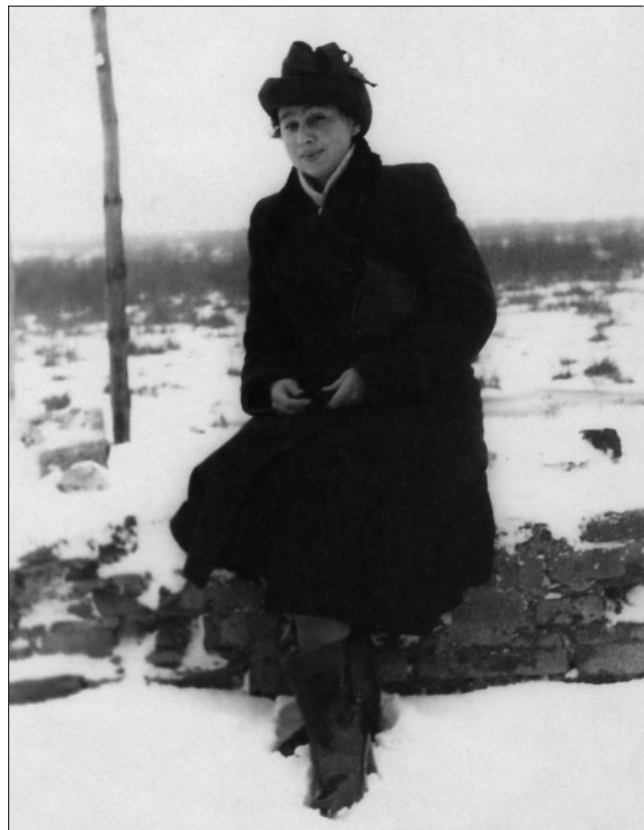
Рис. 1. Т.Г. Мовша, 1951 р.

Сьогодні поглиблюється інтерес до історії створення, діяльності та перспектив розвитку музейних установ України. Значна увага в цьому питанні приділяється вивченню тих особистостей, які безпосередньо причетні до музеєзнавчої роботи. До них відноситься й ім'я Тамари Григорівни Мовші (1922–2003) – відомого археолога, музеєзнавця та пам'яткоохоронця другої половини ХХ ст. Вона належить