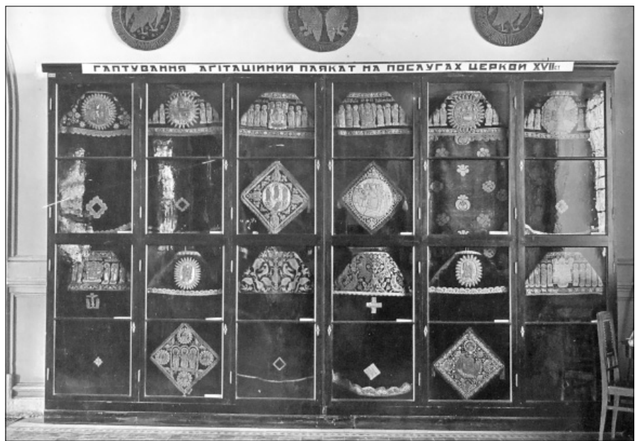
Лл. 4. Відділ шитва й тканини ВМГ. 1931 р.

Протягом 1932 р. ВМГ був відкритий для відвідувачів щодня, за виключенням вихідних днів (одного на шестиденку), протягом 5 ½ годин. Окрім Музею історії релігії, Музею історії Лаври, Музею джерел вивчення історії України (Збірка П.П. Потоцького) (останній для масового відвідування відкритий один день на шестиденку у загальний вихідний день, решту днів – лише для окре-