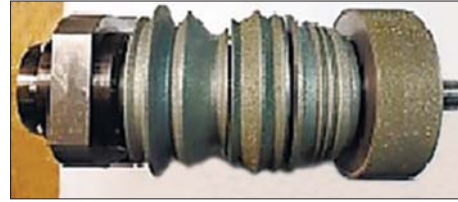
Рис. 3. Виготовлені в Інституті надтвердих матеріалів ім. В.М. Бакуля НАН України дослідні зразки правлячих алмазних роликів для глибинного шліфування

Ролики, що мають складний фасонний профіль, дозволяють здійснювати одночасне виправлення кругів по кількох робочих поверхнях: прямолінійних, криволінійних, і завдяки