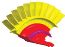
Рис. 1. Розрахункова модель сектора біметалевого диска турбіни для технології зварювання, розробленої в Інституті електрозварювання ім. Є.О. Патона НАН України