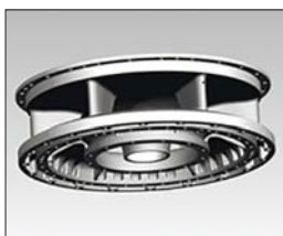
Рис. 2. 3D-модель корпусної деталі для сімейства двигунів AI-450, що планується виготовляти з високоміцного алюмінієвого ливарного сплаву розробки Інституту металофізики ім. Г.В. Курдюмова НАН України

тряних сил (ITWL, м. Варшава), на томографі X-Ray фірми General Electric), а також металографічно на технологічному зразку. Тривала міцність цього типу з'єднання становить не менш як 80% міцності основного матеріалу.