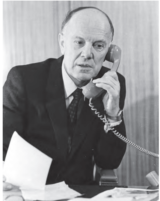
Ілюстр.11. Президент АН УРСР Борис Євгенович Патон. Київ, грудень 1983 р.