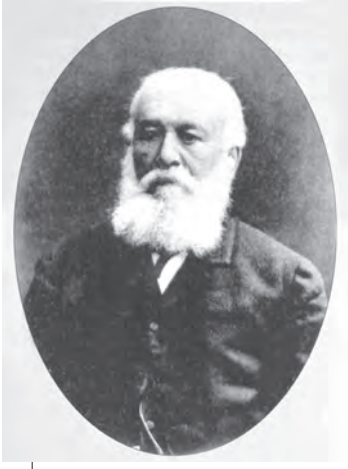
Ілюстр.3. Оскар Петрович Патон. 1900 р.