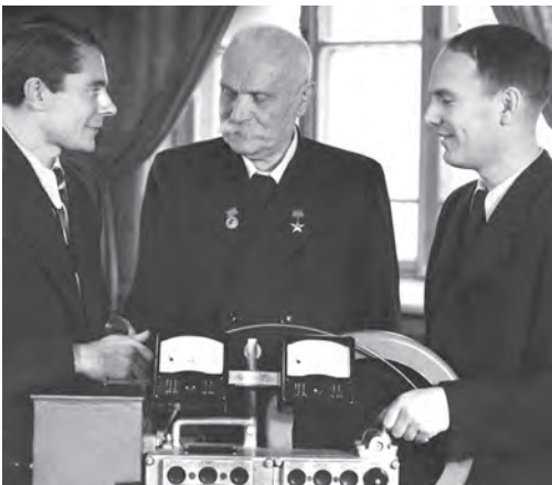
Ілюстр.8. Євген Оскарович Патон із синами Володимиром (ліворуч) та Борисом (праворуч) біля нового універсального зварювального автомата ТС-17. Київ, 1949 р.