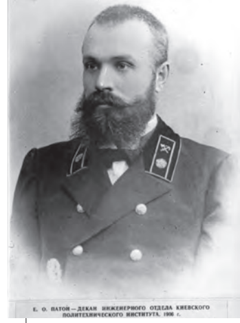
Ілюстр.5. Декан інженерного відділення Київського політех- нічного інституту Євген Оска- рович Патон. Київ, 1906 р.