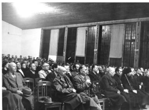
Ілюстр.2. Засідання І сесії УНРади