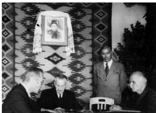
Ілюстр.3. Нарада у президента УНР А.Лівицького