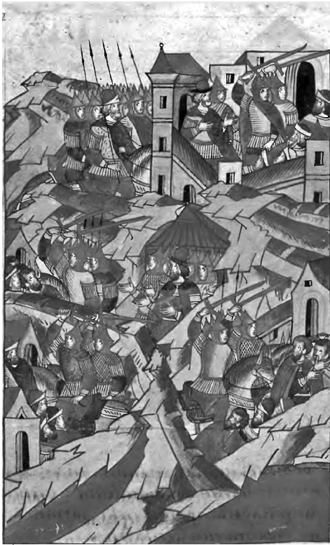
Ілюстр.1. Похід Ольгерда 1362 р. Синьоводська битва (за вид.: Лицевой летописный свод XVI века: Русская летописная история. – Кн.8 [1343–1372]. – Москва, 2014. – С.276)