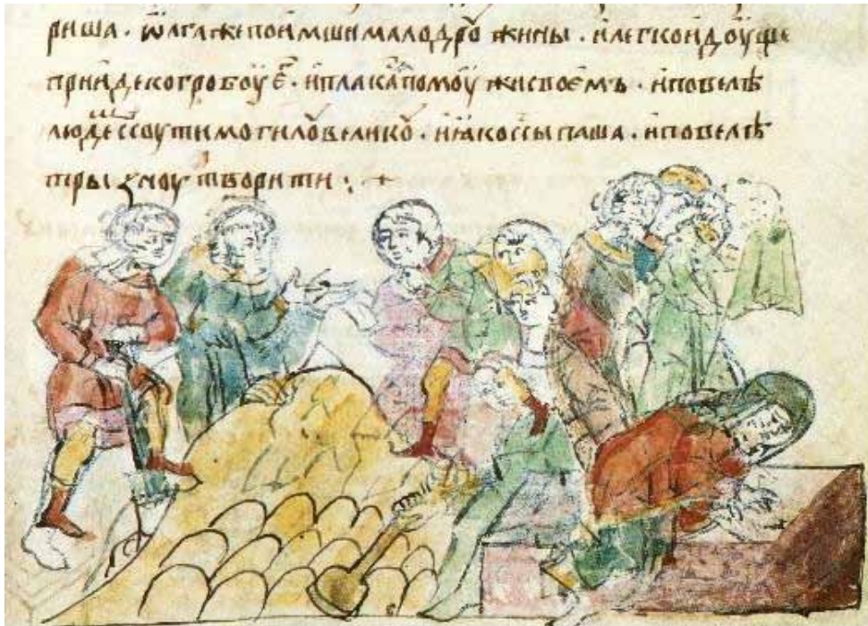
Рис. 6. Насыпання могили над місцем загибелі князя Ігоря. Ольга плаче над гробом. Радзивилівський літопис, арк. 29

Так, усі необхідні дії поховального ритуалу київського князя виконано через певний час після його загибелі з наказу Ольги. Вона також розпорядилася насипати поховальний курган – “могилу велику” 41 . Судячи з пізніших паралелей із практики московського царського двору, поховальна церемонія передбачала також, що вдову приносили на могилу в ритуальних саних. На нашу думку, саме згадку про Ольжині сани, що використовували в ритуалі, здійсненому на місці загибелі чоловіка, пізніший новгородський автор штучно приєднав до літописної розповіді про похід Ольги в Новгородську землю, який О. Шахматов та інші дослідники вважали вигадкою новітніх компіляторів.