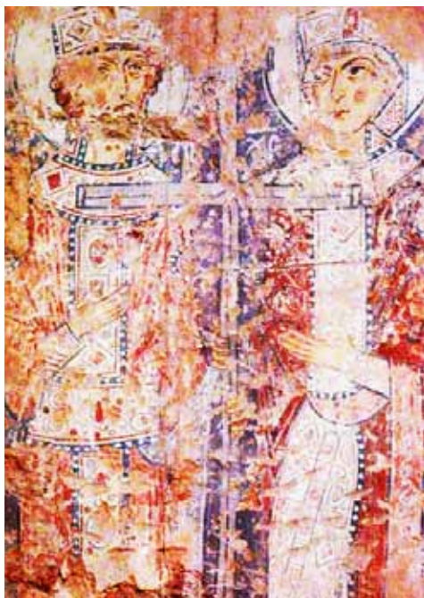
Рис. 8. Рівноапостольні Константин та Єлєна. Фреска Мартирієвої паперті собору Святої Софії у Новгороді. Кінець XI – початок XII ст.

Новгородська традиція вшанування святих рівноапостольних Константина та Єлєни спонукала Антонія до прискіпливого їх вивчення у Константинополі, а відтак – і пов’язування з іменем київської княгині Ольги як нової Єлєни. Саме цим можна пояснити демонстративний розрив