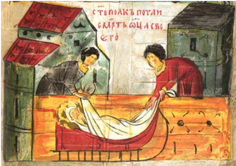
Рис. 1. Тіло князя Володимира кладуть у сани. “Сказание о святых Борисе и Глебе”, список XIV ст., арк. 57.

Під 1194 р. літопис повідомляє про перевезення влітку на санях князя Святослава Всеволодовича, у якого була хвора нога: “и возвратиса Сѣославъ ис Карачева съ Юрьева днѣи. и ѣхаша лѣтъ на санехъ. бѣ бо нѣчто извергълося емоу на нозѣ” 21 . Отож, нагальної необхідності змінювати полозний транспорт на колісний у княгині Ольги не було. Відтак поява літописної згадки повинна мати інші й, очевидно, не сезонні, а практичні, причини. Нагадаємо й про роль саней як транспортного засобу для поховального ритуалу. У цьому ракурсі тема Ольжиних саней не розглядалася. Ще на початку XIX ст. можливість поховання із застосуванням саней ставилася під сумнів. Так, Гавриїл Успенський вважав згадані в писемних джерелах поховальні сани чимось на зразок нош, якими переносили покійника, чи невеликим колісним візком, на якому його везли 22 . Відкликаючись до його тверджень, Олександр Котляревський доводив, що під цим словом навряд чи можна розуміти сани в теперішньому значенні. На його думку, йшлося, радше, про вид “особой повозки, покойной и небольшой, на ней ездили и летом, ее же с мертвецом иногда поставляли в церкви” 23 .