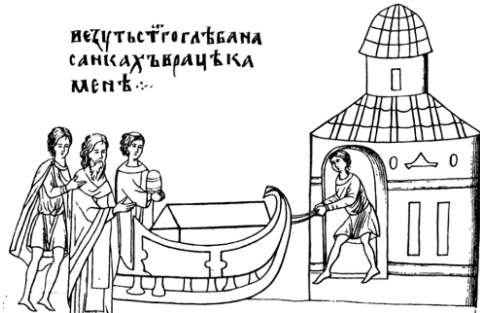
Рис 3. Тіло князя Гліба везуть в санях у кам'яному саркофазі.

“Сказание о святых Борисе и Глебе”, список XIV ст., арк. 128 (за І. Срезневскім)