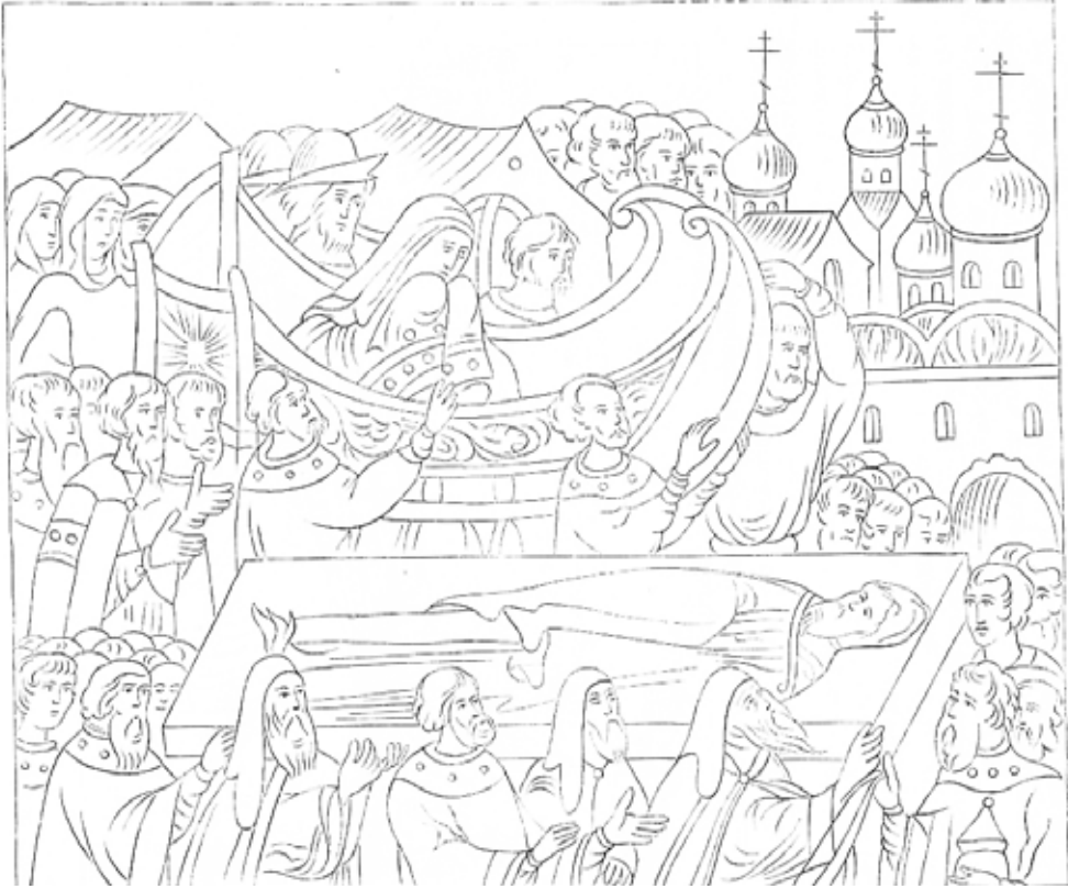
Рис 5. Велику княгиню Єлену несуть у санях на церемонії поховання великого московського князя Василя Івановича.

Мініатюра "Царственої книги" (за Д. Анучіним)