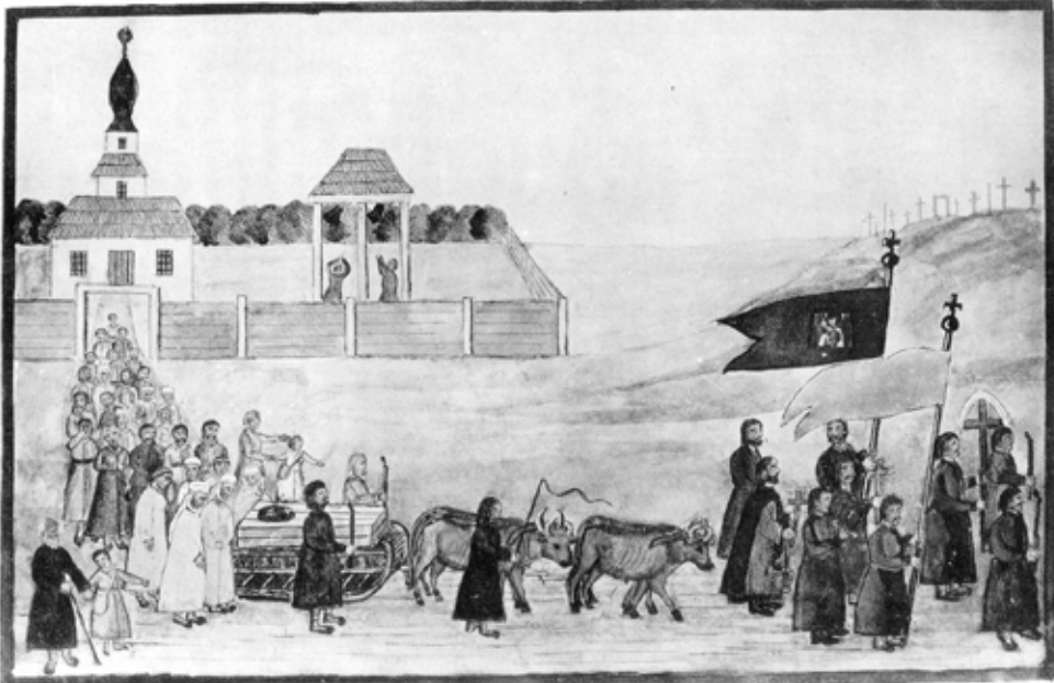
Рис 4. Обряд поховання селянина на санях. 50-ті роки XIX ст. Радомишльський пов. Київської губ. З альбому де ля Фліза (за М. Біляшівським)

двома парами волів. За свідченням селян із Косарів, у їхньому селі та в сусідніх так ховали шанованих, старших людей й тих, хто довго хворів 31 . За дослідженнями Романа Гузія, особливо довго сани використовували в Карпатському регіоні: "...ще в 20–30-х рр. XX ст. в багатьох місцевостях Карпат побутувала практика виключного використання (у будь-яку пору року, в т. ч. й улітку) для цієї мети саней. Подекуди в горах залишки цієї традиції зберігались ще в 70–80-х, а в окремих селах Великоберезнянського, Рахівського, Косівського р-нів і на початку 90-х рр. XX ст." 32