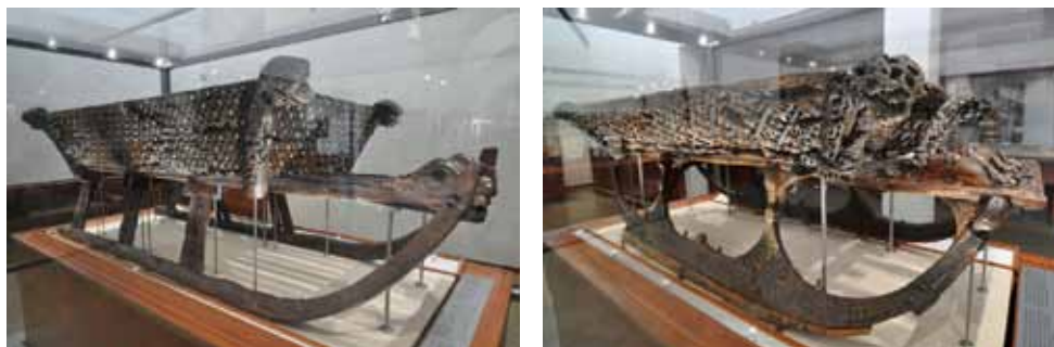
Рис. 7. Сани із поховального човна з Усеберга. Осло. Музей човнів вікінгів

і не залишали, то їх обмивали після церемонії, але голоблі повертали, як це робили і на кладовищі 48 .