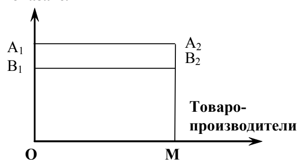
Рис. 2. Экономика в равновесном представлении (на схеме: прямая A_1A_2 — линия равновесной рыночной цены; прямая B_1B_2 — линия себестоимости)

Однако останавливаться на этом этапе в нашем анализе было бы не совсем целесообразно, поскольку со стороны апологетов «невидимой руки» объявятся те, которые заявят, что рынок не виноват в том, что некоторые люди не могут полностью удовлетворить свои потребности. Наоборот, он возможности по удовлетворению потребностей представляет, но люди не могут ими воспользоваться лишь по собственной вине. Поэтому перейдем к следующему этапу рассуждений.