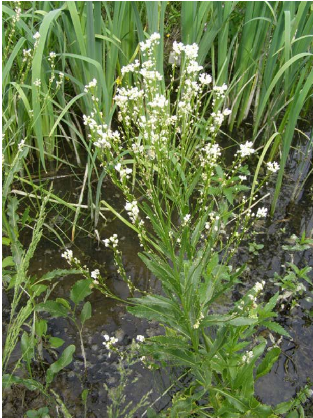
Рис. 3. Armoracia macrocarpa у фазі цвітіння 22.05.2013 (о-в Анкудинів, Дунайський біосферний заповідник)