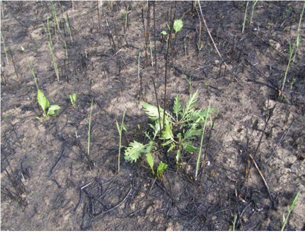
Рис. 7. Явище пірогенної гетерофілії у Armoracia macrocarpa (придамбова прируслова ділянка о-ва Кислицький, 26.09.2013)