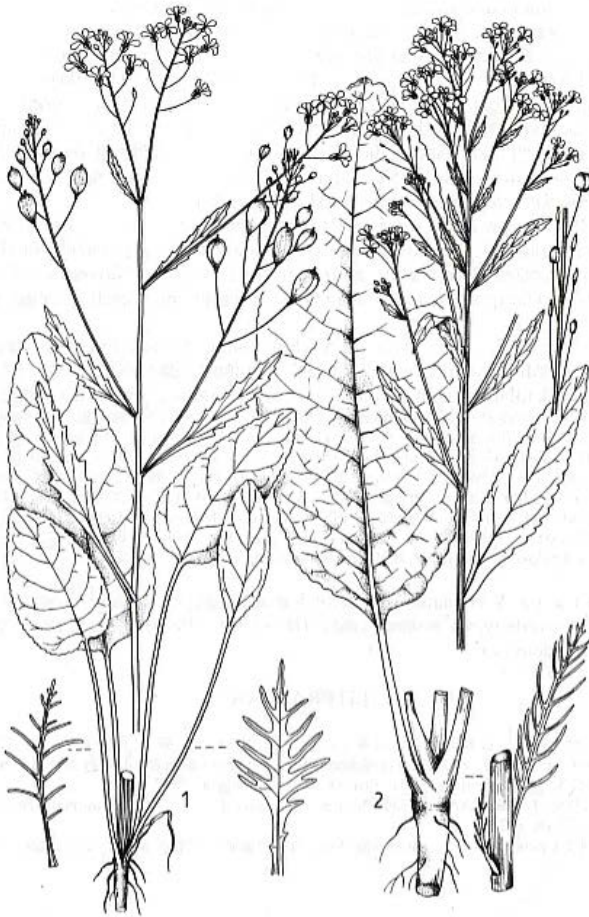
Рис. 1. Загальний вигляд Armoracia macrocarpa (1) і A. rusticana (2) за Flóra Slovenska [Flora of Slovakia] (2002) Fig. 1. General form of Armoracia macrocarpa (1) and A. rusticana (2) by Flóra Slovenska [Flora of Slovakia] (2002)

генетичних ресурсів. Автори встановили, що відсутність насінневого поновлення в A. rusticana зумовлена тривалим (протягом багатьох сторіч) його вегетативним розмноженням. Молекулярні дослідження європейських видів роду Armoracia , поєднані з цитологічними і морфологічними, не підтвердили гібридного походження Armoracia rusticana (Miller et al., 2010). Автори також довели, що популяції A. rusticana у репродуктивному аспекті є несумісними, переважна більшість особин відзначається стерильністю чоловічої сфери, що й зумовлює стерильність особин цього виду та підтверджує значущість охорони та збереження природних місцезростань його ймовірного предка A. macrocarpa (Sampliner, Miller, 2009; Miller et al., 2010).