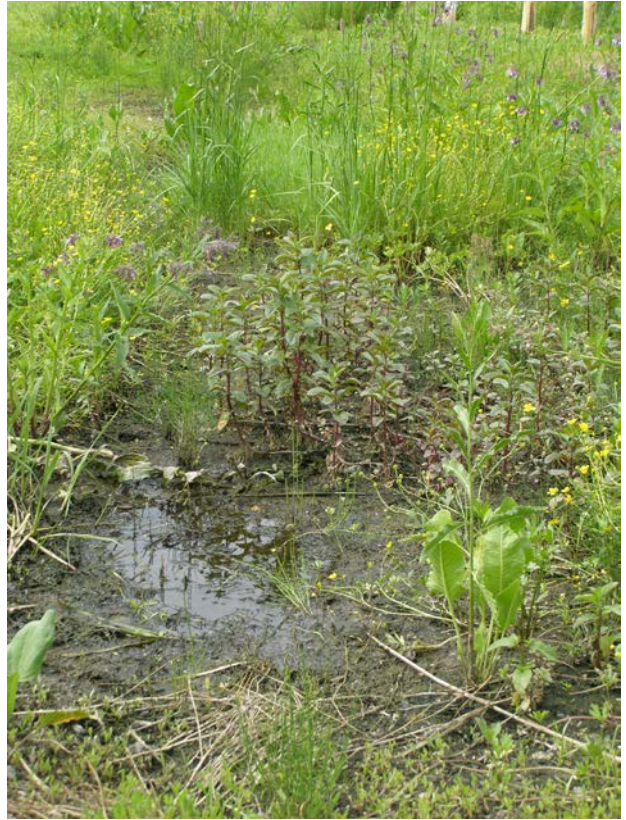
Рис. 4. Заболочені прируслові ділянки з молодими генеративними особинами Armoracia macrocarpa

На українській частині долини Дунаю A. macrocarpa частіше приурочений до місцезростань з алювіальними ґрунтами, рідше трапляється на болотних і лучних (рис. 3, 4). За екологічною шкалою Г. Елленберга (Ellenberg et al., 1992) належить до групи видів, що зростають на освітлених місцях, але витримують і притінення (до 30%). Armoracia macrocarpa є індикатором свіжих ґрунтів, його оптимум припадає на середньозволожені, на сирих і пересихаючих вид відсутній. Він є також індикатором ґрунтів від слабкокислих до слабколужних, добре забезпечених сполуками азоту, на кислих і засолених –