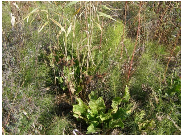
Рис. 6. Рідкісне угруповання з домінуванням Phragmites australis за участі Armoracia macrocarpa і Equisetum telmateia на придамбовій зарусловій ділянці о-ва Кислицький (окол. м. Кілія, Одеська обл.)

Fig. 5. Armoracia macrocarpa as an assectator of the communities formed by Phragmites australis under a dam channel site of the Kyslytskyi Island (outskirts of Kiliya, Odesa Region)