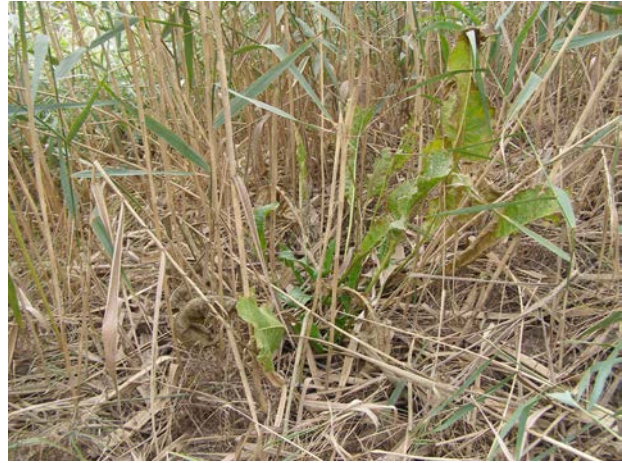
Рис. 5. Armoracia macrocarpa як асектатор угруповань, утворених Phragmites australis на придамбовій прирусловій ділянці о-ва Кислицький (окол. м. Кілія, Одеська обл.)

Armoracia macrocarpa належить до групи геофітів. Багаторічна трав'яна рослина, стебло прямостояче, слабогалузисте, голе. Прикореневі листки