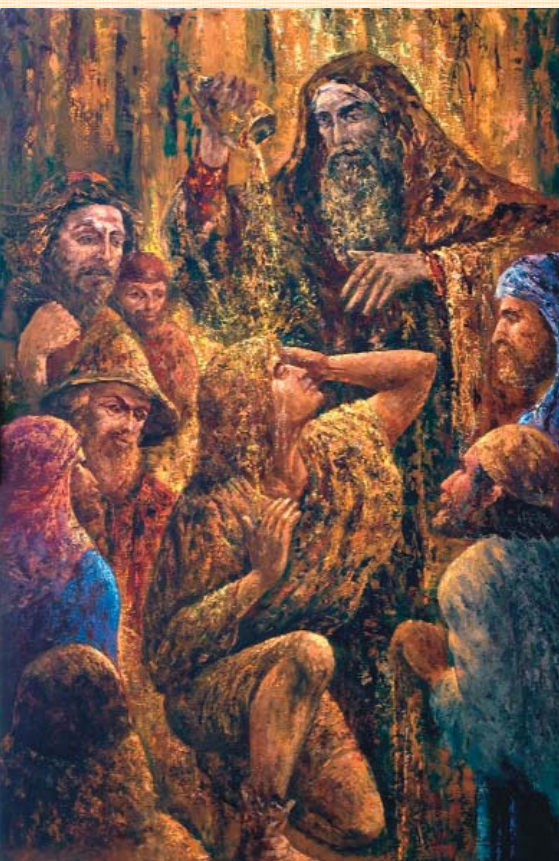
Обранець. 2009. П., м.