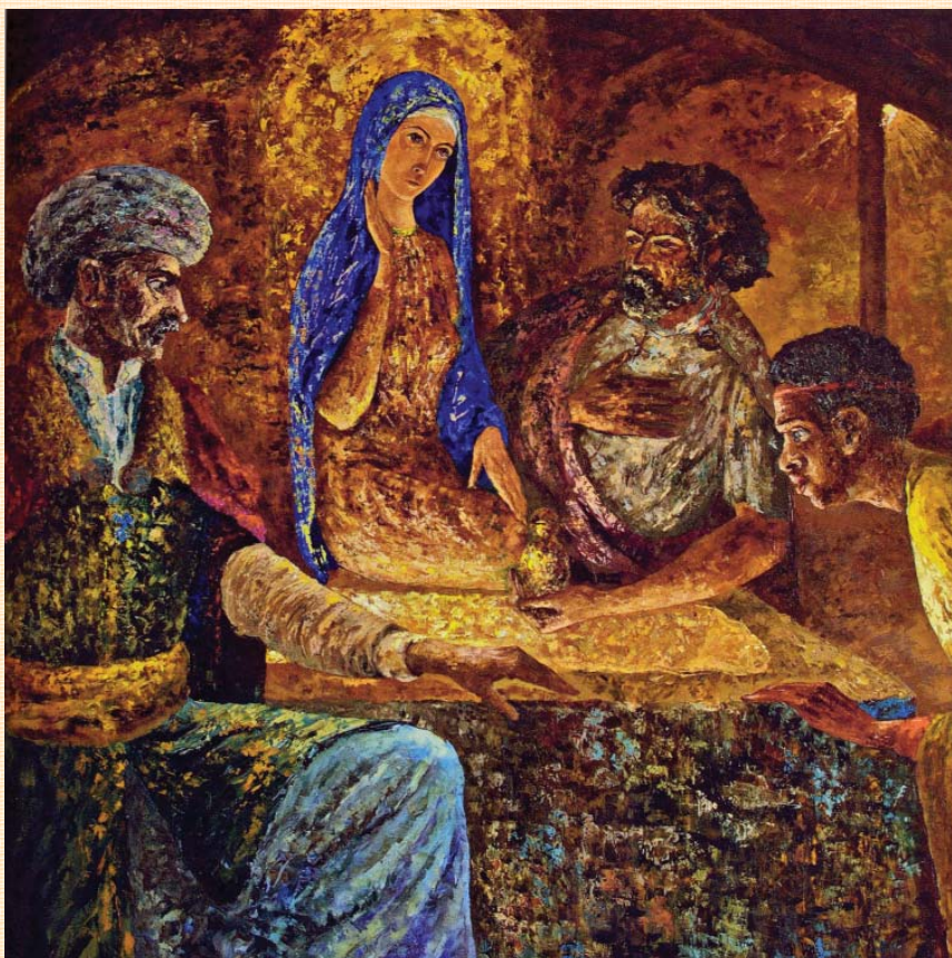
Волхви. 2005. П., м.