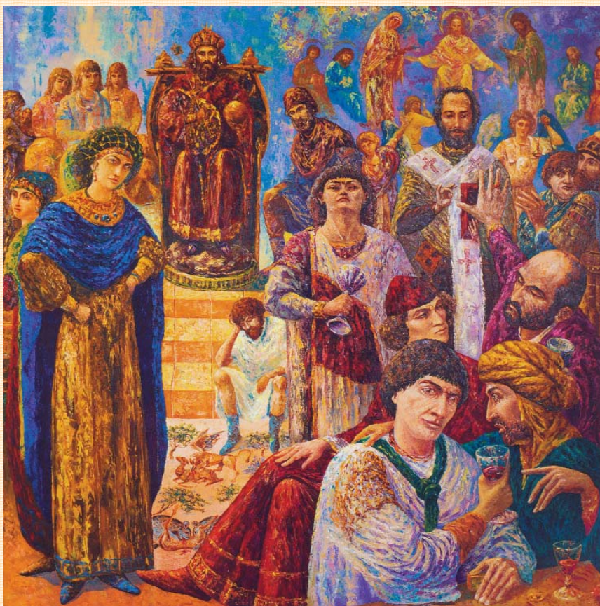
"Винуватцем" свята став презентований на виставці триптих автора, який він пообіцяв подарувати майбутньому новообраному президентові України. Триптих є композицією з трьох картин: "Візантія I. Нуммія", "Візантія II. Вино", "Візантія III. Книга".

Чи вдалося це художнику – оцінювати глядачам... Але на-