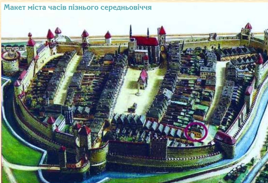
Макет міста часів пізнього середньовіччя

Бардіїв був вже третім пунктом Словаччини, що входив до програми наших архітектурних досліджень. У Кошицях і Пряшеві ми спостерігали лише поодинокі фрагменти фортифікаційних споруд, натомість, сакральних об'єктів, на наш погляд, було забагато. Композиційними центрами старовинних міст були й залишилися величезні готичні костели, саме вони домінують серед житлової забудови XVI–XVIII ст. Бардіїв не є в цьому сенсі виключенням, але в ньому добре збереглися й розташовані поруч з цивільними спорудами стіни й башти укріплень, які оточували місто. Історично достовірне міське середовище — ось що захопило нас на декілька