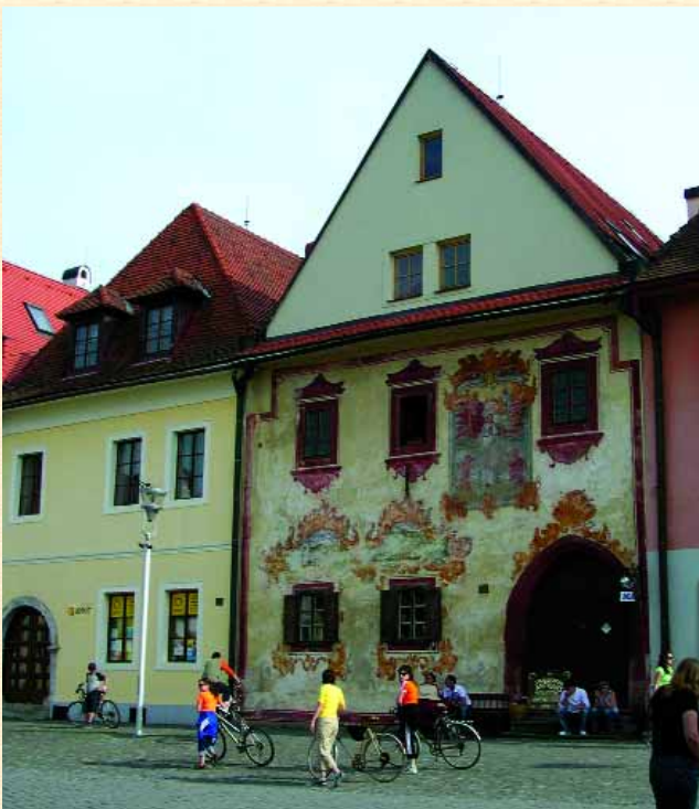
Живописні фасади середньовічних будинків.

Реставровані фортифікації мають досить привабливий вигляд, хоча збереглися й не повністю. Тут не намагаються добудувувати їх із сучасної цегли (як це, скажімо, відбувається в Збаражі або навіть у Києві: башти Бардієва аж ніяк не можна порівнювати із шпитальними укріпленнями нашої столиці, де відбувається фактично новобудова). Залишки стін дбайливо консервують, в усякому разі ми бачимо патину часу, а не прояви анти-архітектурної діяльності. Початок їх зведення відносять до XIV ст., коли 1352 р. король Людовик Перший зажадав, аби місто було зміцнене мурами і вежами. З привілею 1376 р. дізнаємось, що на той час забудова була вже переважно мурованою, на початку XV ст. місто мало п'ять брам. Через постійну небезпеку військових дій, які протягом декількох століть не оминали Бардіїв, на належне утримання фортифікацій виділялися значні суми, самі укріплення час від часу модернізувалися.