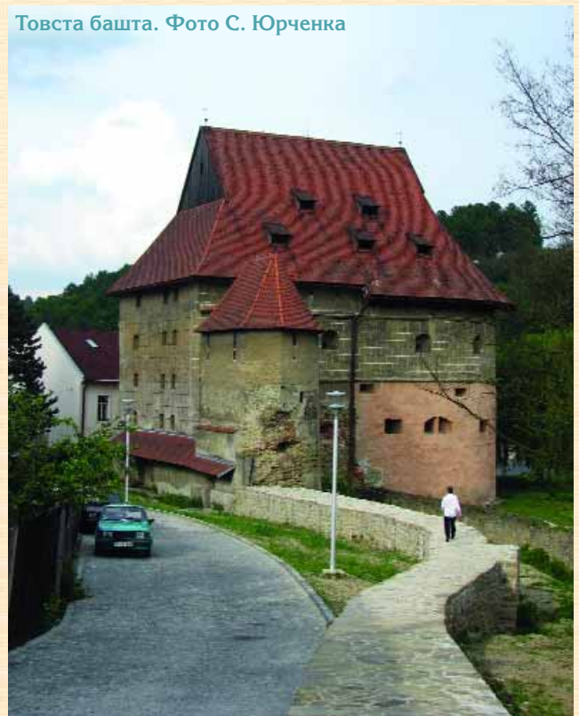
Товста башта.

А де ж сучасні багатоповерхівки, невже для них не знайшлося зайвого газону? На щастя, ми навіть не переймалися цими думками, як і у кожному місті, що розвивається й має сьогоденні потреби, є й тут сучасні житлові квартали, тільки знаходяться вони на значній відстані від історичного центру, за межі якого наша екскурсія не виходила.