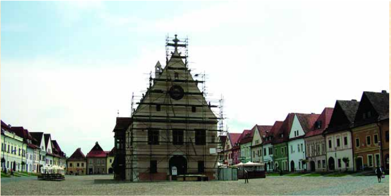
Міська ратуша.