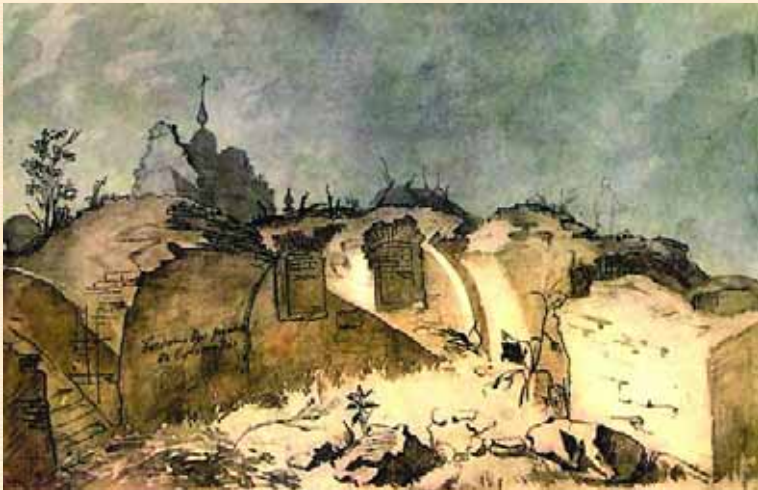
Т. Шевченко. Богданові руїни в Суботіві. 1845. Папір, акварель.