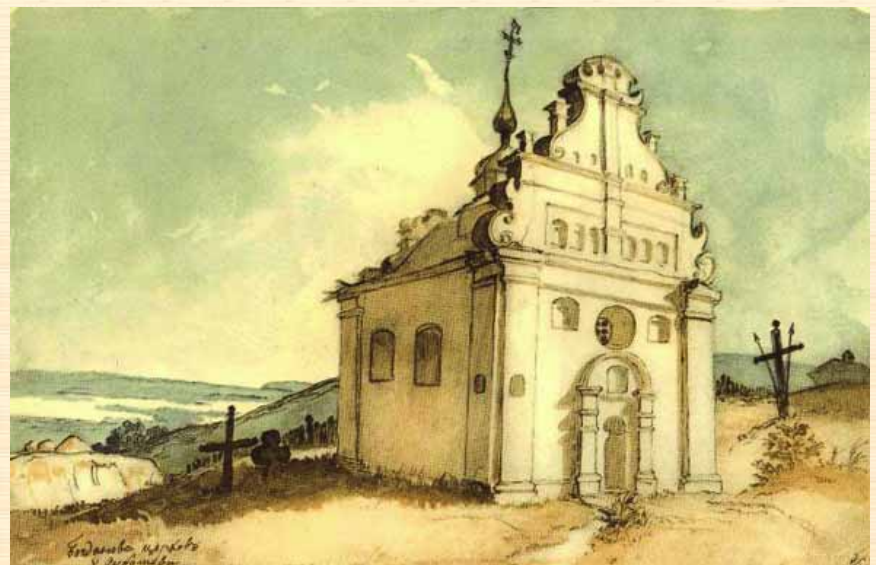
Т. Шевченко. Богданова церква в Суботіві. 1845. Папір, акварель.

Дещо інакше історію, пов'язану з другим одруженням Б. Хмельницького, описує у своєму літописі Самійло Величко. Він свідчить про те, що "Хмельницький, прийшовши з козацьким військом із Запорозжя до Чигирини, піймав був свого ворога Чаплинського і відтяв йому голову. Після того він пойняв собі в жінки його дружину" [6, 35]. Ці відомості є цілковитим вимислом, адже гетьман і пізніше вимагав у поляків видачі Чаплинського. Восстаннє його ім'я зустрічається в документах 1660 р. [6, 67].