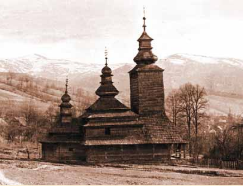
Покровська церква в с. Канора Закарпатської обл. (1792 р.)

Покровська церква з с. Канора після перевезення та реставрації в експозиції Національного музею народної архітектури та побуту в м. Києві.