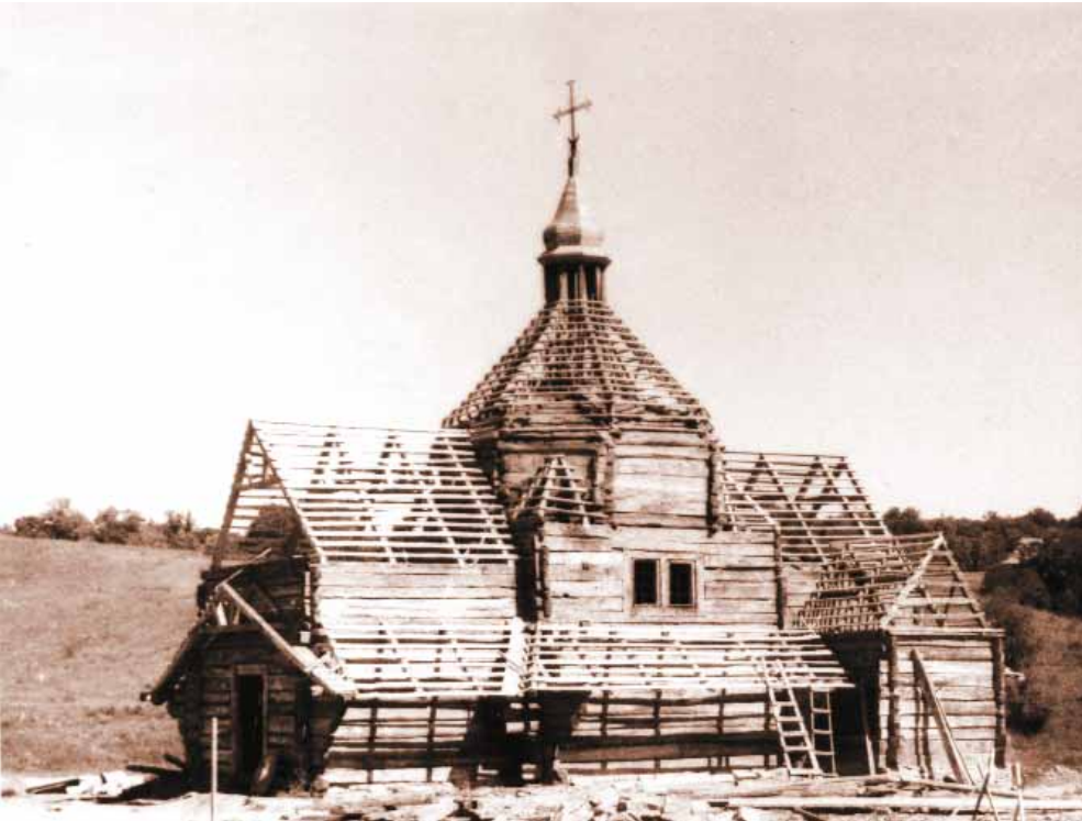
Миколаївська церква з с. Зелене Тернопільської обл. (1817 р.) під час реставрації в експозиції Національного музею народної архітектури та побуту в м. Києві.