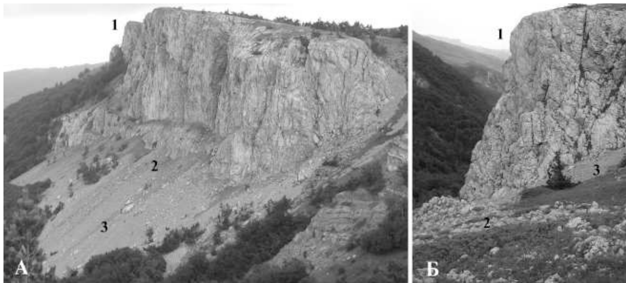
Рис. 1. Осыпь возле скалы Шаган-Кая. А — уклон возле северо-восточного борта Шаган-Кая; Б — общий вид осыпи. Условные обозначения: 1 — денудационный склон; 2 — стабильная часть осыпи с маломощным слоем щебня и сообществами петрофитов; 3 — подвижная часть осыпи с чехлом щебня