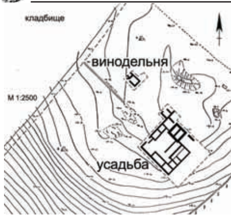
Рис. 1. Схема расположения сельской усадьбы 340 и винодельни.