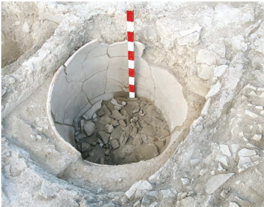
Рис. 4. Остатки пифоса в приёмнике для сула.