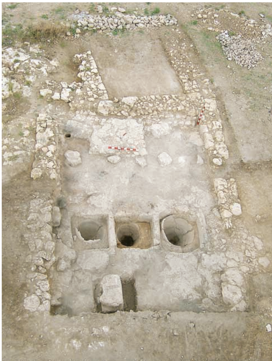
Рис. 3. Помещение винодельни (вид сверху).