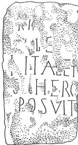
Рис. 4. Известковый столб с латинским посвящением, найденный в 1905 г.

Исходя из этого, в настоящее время пока, видимо, нет достаточных оснований говорить даже о кратковременном пребывании стационарного римского гарнизона в городе 71 , так как полевая армия использовалась для решения конкретных оперативных и тактических задач 72 , а не для защиты границ или городов на территории империи 73 . Следовательно, появление в Херсонесе отряда римских войск было, скорее всего, вызвано каким-то экстраординарным военно-политическим событием, которое заставило перебросить сюда военную вексиляцию, во главе которой был скорее поставлен центурион, а не трибун полевой армии, имевший титул протектора. Не исключено, как об этом свидетельствуют имеющиеся в нашем распоряжении источники, что римские войска были направлены сюда для ведения боевых действий вместе с херсонесским отрядом против боспорцев, вторгнувшихся в пределы империи, а после победоносного завершения войны были выведены в места постоянной дислокации в Подунавье 74 .