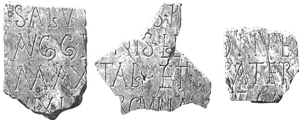
Рис. 3. Три фрагмента латинской надписи, найденные в различных местах Юго-Восточной части Херсонесского городища в начале XX ст.

Константин Багрянородный пишет, что когда в Риме правил император Диоклетиан, Савромат, сын Крискорона, беспорядки, собрал "скифов", населивших берега Меотиды, выступил против римлян, захватил страну лазов и дошел до р. Галис 61 . Император отправил против варваров войска под командованием трибуна Константа, которые однако не смогли разгромить "скифов". Тогда Диоклетиан обратился за помощью к Херсонесу. Херсонеситы, собрав мужей из соседних крепостей, нанесли удар в тыл Савромату, захватили его столицу, что в конечном итоге и позволило заключить с варварами мир на выгодных для империи условиях. В награду за помощь и верность империи Херсонесу были дарованы права "свободы" и освобождение от налогов. Император также установил выдчу тысяч пайков и материалов для баллиств, что должно было способствовать поддержанию боеспособности херсонесских войск на должном уровне 62 . Если исходить из того, что