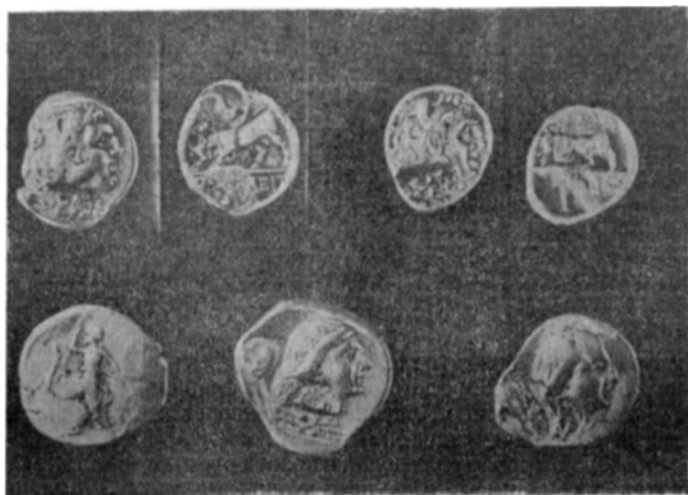
Рис. 2. Серебряные драхмы III—II вв. до н. э. с изображением Геракла и бодающегося быка (верхний ряд) и дидрахмы с изображением головы Девы и Девы, поражающей льва, с обратной стороны.

110 монет, часть их он раздарил, одну (бронзовую) разрубил для исследования металла. Монеты, по его словам, были найдены в горшочке, разбитом при извлечении из земли. Проверить это указание не удалось.