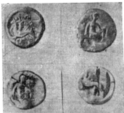
Рис. 3. Бронзовые дихалки IV в. до н. э. с изображением богини Девы и грифона.

Об. ст. Дева, припавшая на правое колено с луком и стрелой, вправо. Под ней — надпись ΧΕΡ читается на 14 экземплярах. За ней — ΚΡΑ, ΚΡ — на 15 экземплярах, ΑΡ[Ι] на одном экземпляре и ΠΑ на двух экземплярах; на остальных 12 надписи стерты. Надчеканка дельфин на 7 экземплярах. Диамет. 22—24 мм. Ср. вес 9,4 гр.