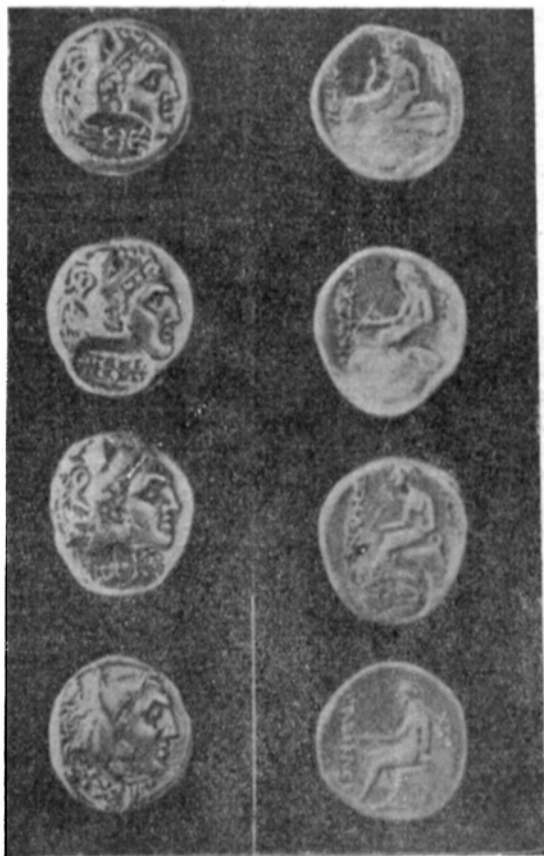
Рис. 4. Серебряные дидрахмы III—II вв. до н.э. с изображением Геракла и богини Девы.

Л. ст. Дева, припавшая на правое колено с луком и стрелой, вправо. Надчеканка—дельфин на 8 экземплярах.