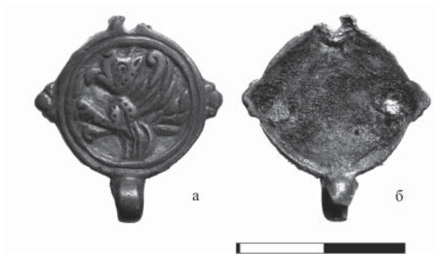
Рис. 2. Бляшка с изображением Сэнмурва

«восточного» облика – серебряная литая подвеска с невнятным изображением (рис. 1). Центральное поле обрамлено двойным гладким ободком, вдоль края подвески – три пирамидки, каждая из которых составлена тремя «каплями» псевдозерни.