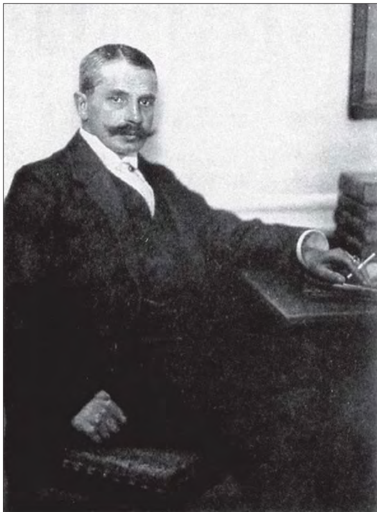
Рис. 1. Эрнест Романович фон Штерн в одесский период деятельности.