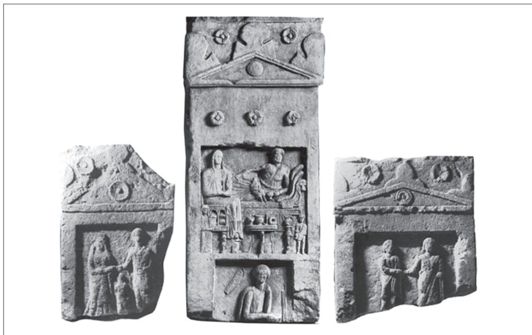
Рис. 2. Антропоморфные акротерии на боспорских рельефных стелах первых веков н.э.