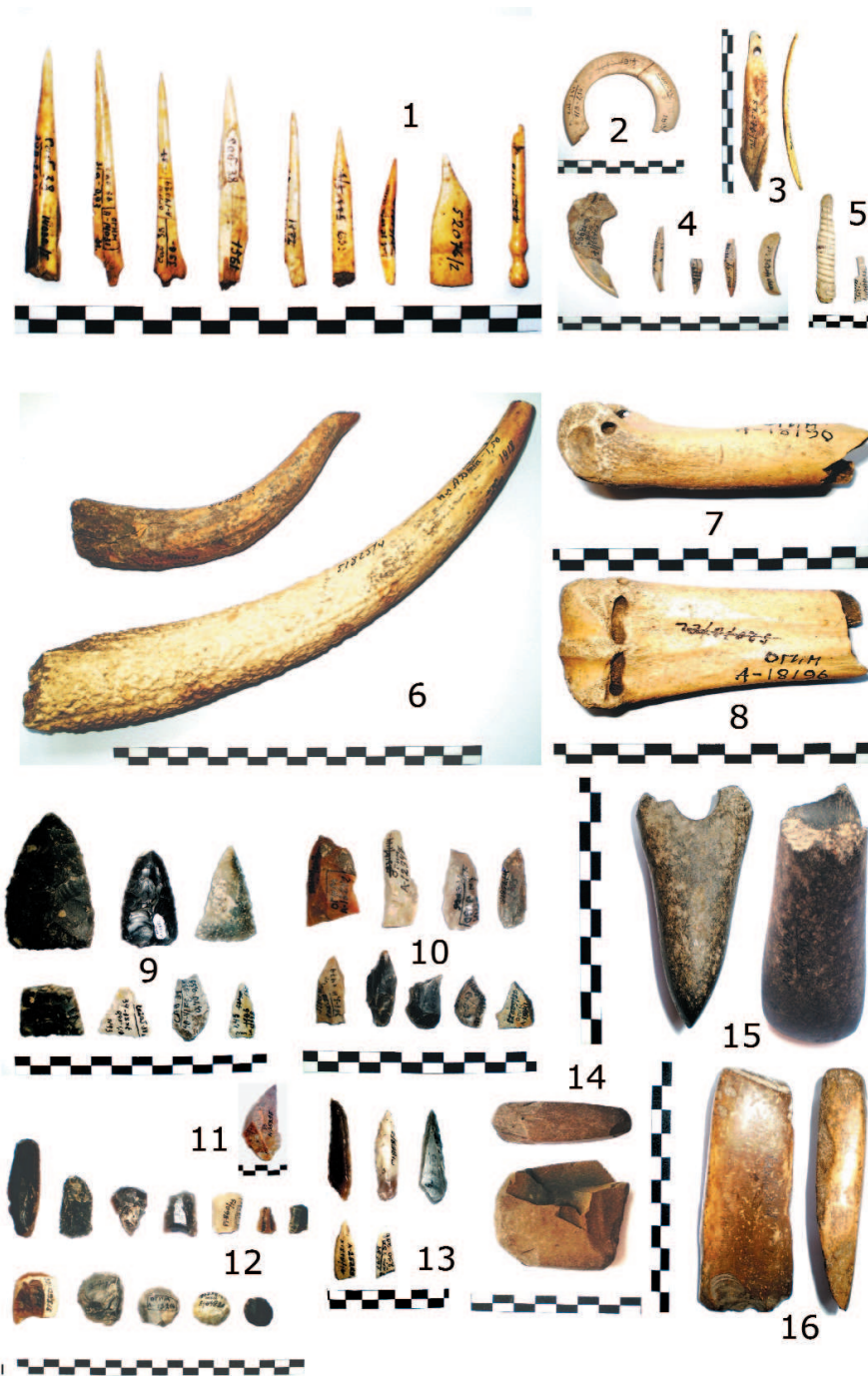
Рис. 5. Изделия из кости и камня.