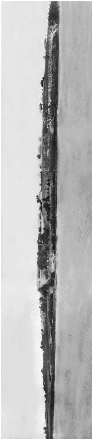
Рис. 1. Вид на «Жовтякову Кручу», участок надпойменной террасы при впадении р. Синица в р. Южный Буг, месторасположение поселения Сабагиновка I с открытым раскопом.