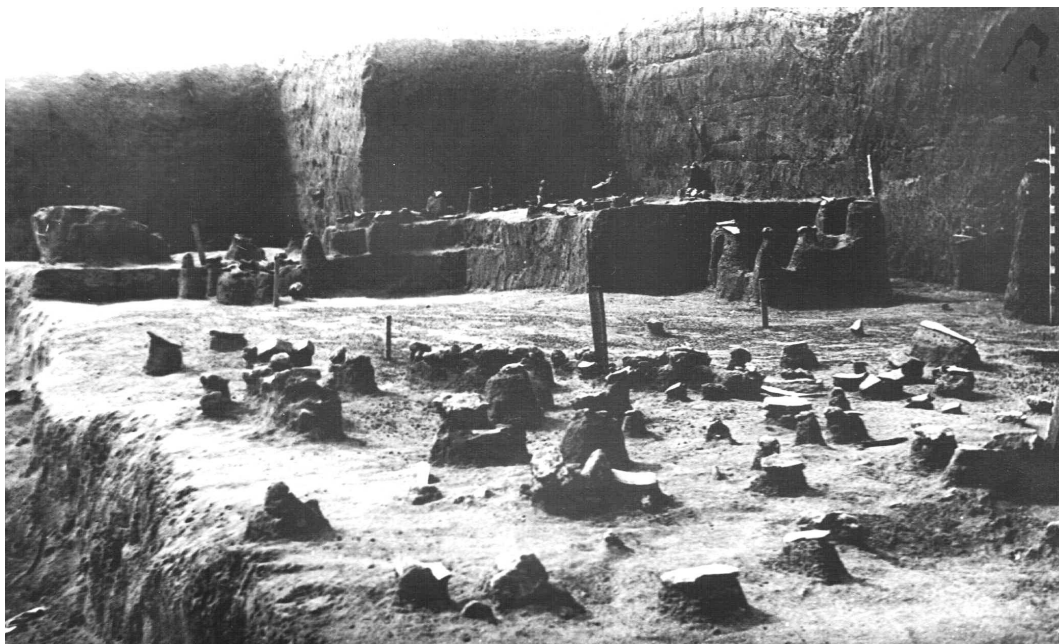
Рис. 2. Вид раскопа 1930-х годов с юго-востока.