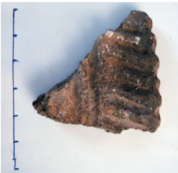
Рис. 4. Фрагмент вінця посудини.