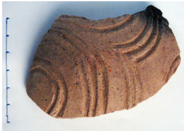
Рис. 3. Фрагмент стінки столової посудини з концентричним візерунком, виконаним прогладженими лініями.