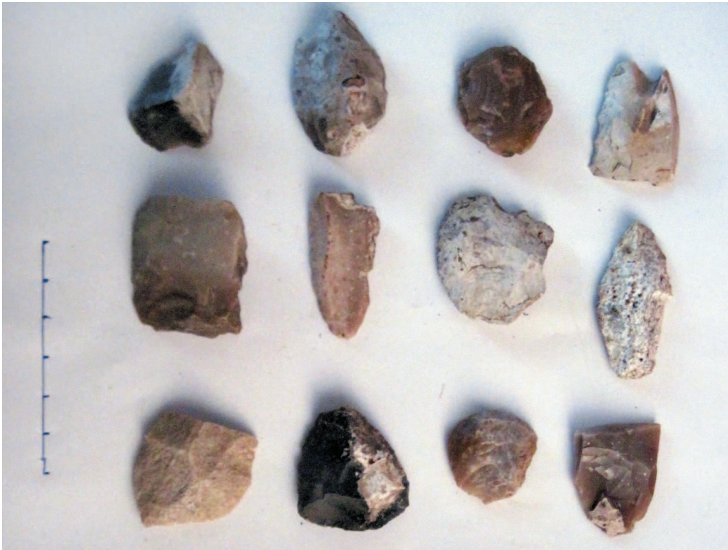
Рис. 5. Скребки. Кремій.