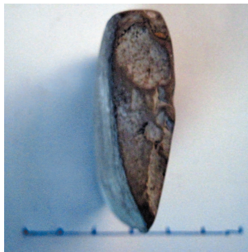
Рис. 7. Профіль мотики. Камінь.