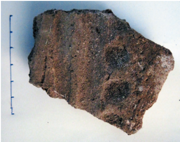
Рис. 2. Фрагмент стінки кухонної посудини.