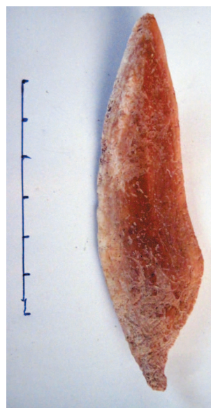
Рис. 10. Кістяне знаряддя.