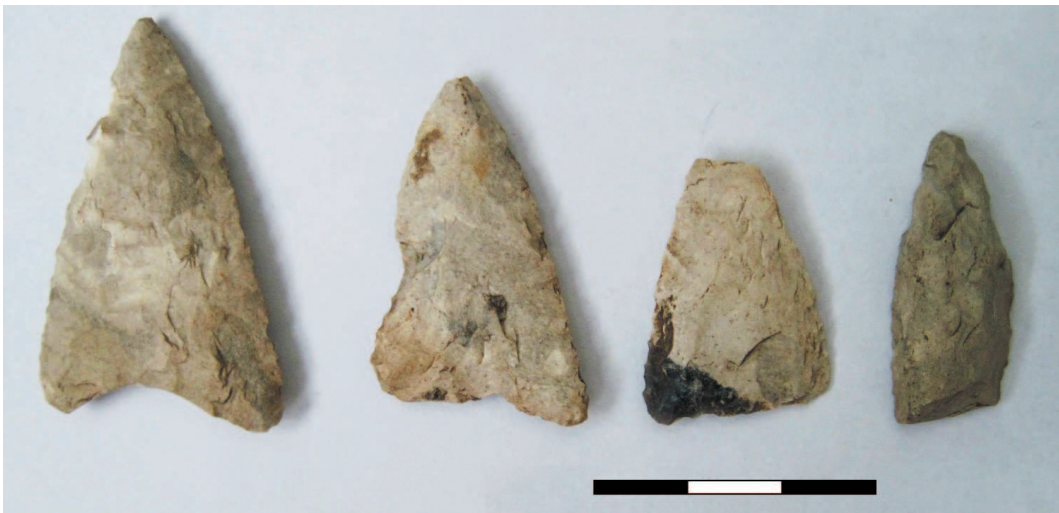
Рис. 6. Наконечники металльного озброєння. Кремій.