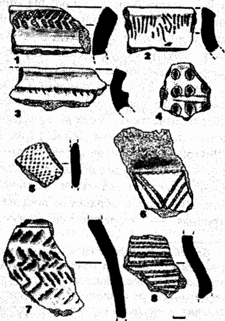
Рис. 2. Керамика местонахождения Покровское (1-8).

Район Хаджибейского лимана с указанием разведанных археологических местонахождений: 1 — Богнатово — южный мыс; 2 — Богнатово; 3 — поселение Ведьмина Гора; 4 — Покровское; 5 — Алистарово-залив; 6 — Алистарово-1; 7 — Алистарово-2; 8 — Щорсово.