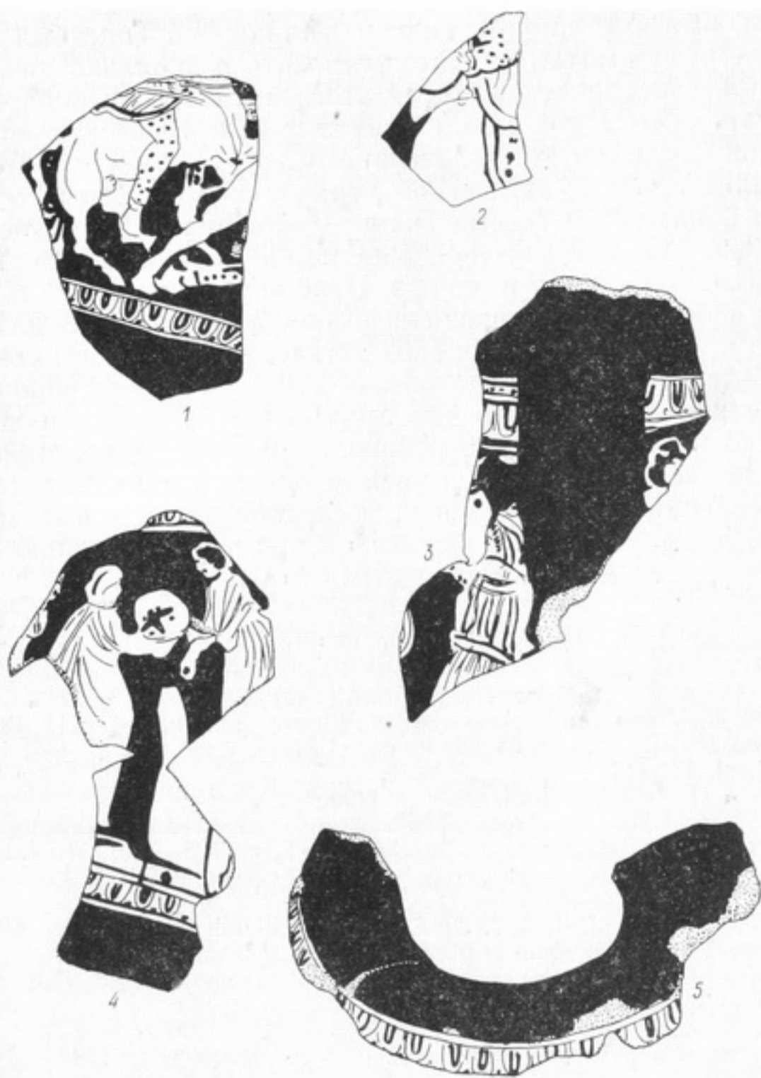
Рис. 3. Фрагменты боспорских пелик (1—5).

ми помещаются стела-алтарь или диск, в руках они держат стригиль, палку-посох. Эти детали могут сочетаться. Складки гиматия передаются скупыми штрихами, едва намечаются лицо и руки. Примером может служить фрагмент оборотной части пелики из Тиры (рис. 3, 4). Сохранилась также часть венчика этой пелики с отогнутым профилированным краем, по которому нанесен пояс ов (рис. 3, 5). И хотя мы не располагаем ни одним полным профилем вазы этого типа, можно утверждать, что все фрагменты тирских пелик полностью соответствуют массовой продукции, производившейся главным образом во второй половине IV в. до н. э.