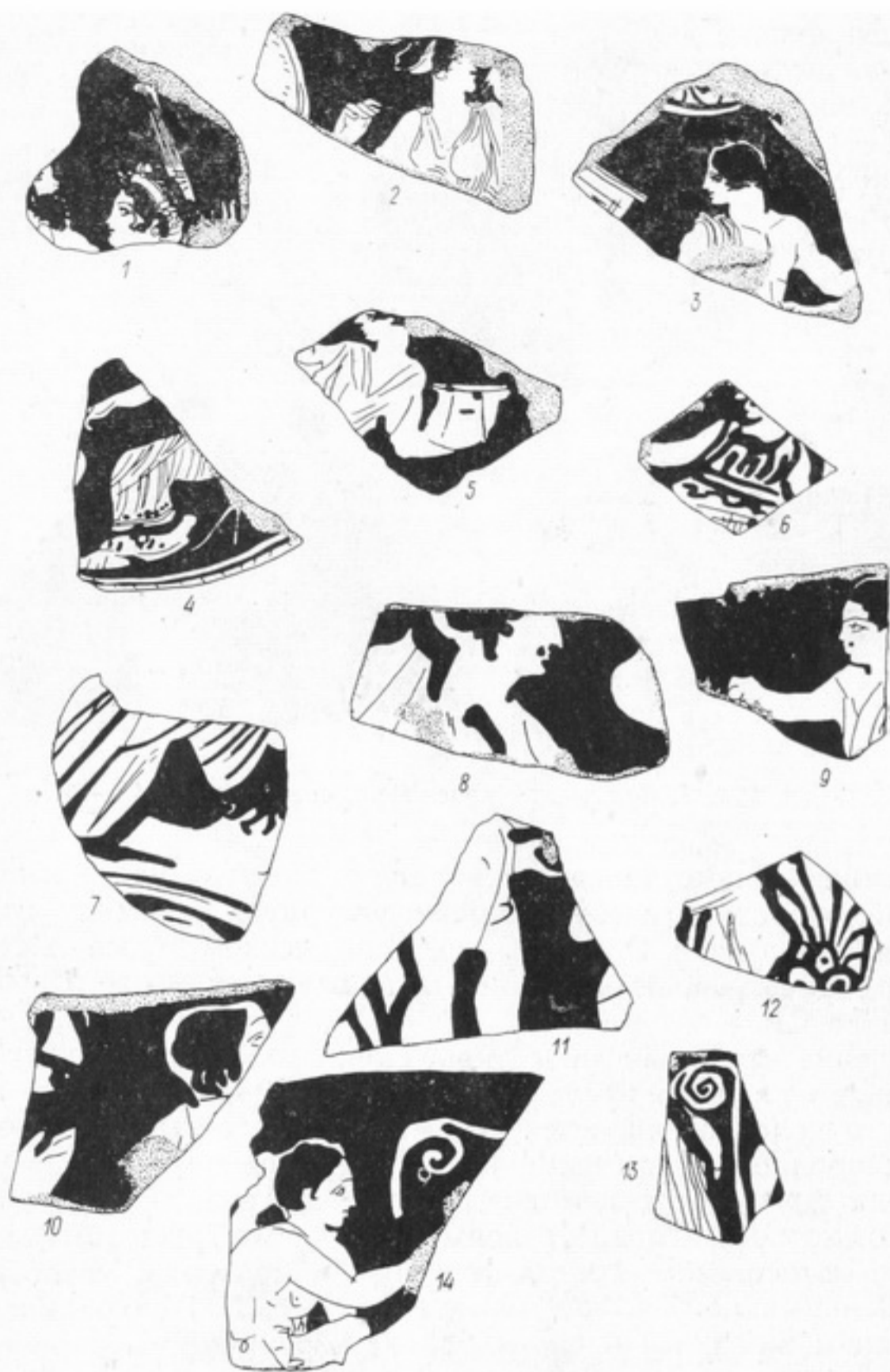
Рис. 2. Фрагменты расписной керамики (1—14).

аналогией нашему фрагменту является обломок большого кратера из Олинфа 3 .