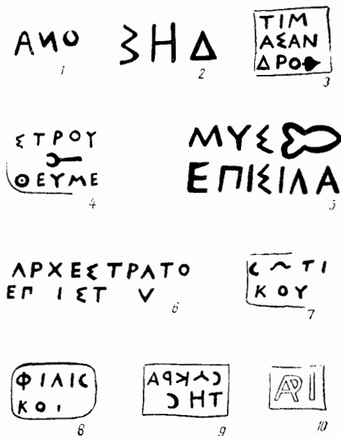
Рис. 1. Клейма Гераклеи Понтийской

На основании вышесказанного можно утверждать, что подобные клейма наклады-