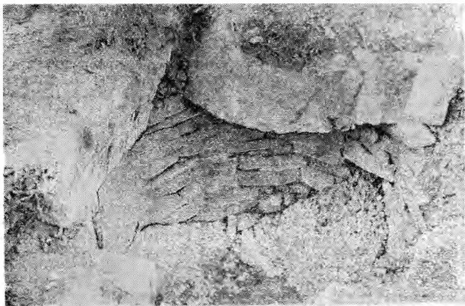
Рис. 2. Архитектурный вид памятника.

Не установлено точно, что было найдено в результате произведенных раскопок памятника, в частности, найдены ли были какие-либо металлические предметы. Однако удалось установить, что в памятнике было заключено древнее одиночное погребение. На дне у южной стены располагался в полусидячем положении костяк человека, а около него находились глиняные сосуды. Из того обстоятельства, что основная часть сосудов была найдена до обнаружения костяка, в верхней части памятника, следует, что часть сосудов, повидимому, расположена была на какой-то подставке, возможно каменной полочке, пристроенной к верхней части стены. Другие сосуды находились на дне.