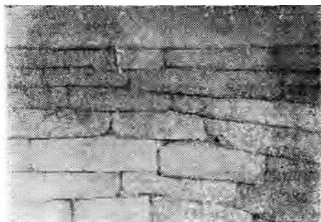
Рис. 3. Внутренний вид второго памятника. 1949 г.

Все сооружение с внешней стороны представляет небольшой холм. Под действием времени земля с одной стороны осыпалась и это дало возможность обнаружить плиту и весь памятник. Как и первый, этот памятник представляет полууглубленное в землю цилиндрической формы помещение диаметром в 2 м и высотой в 1,14 м. Следовательно, это сооружение несколько больше первого. Стены также выложены из ровно отесанных каменных блоков из песчаника длиной от 37 до 55 см, шириной в 20—27 см и толщиной 12—13 см. Кладка камней сухая. (Рис. 3).