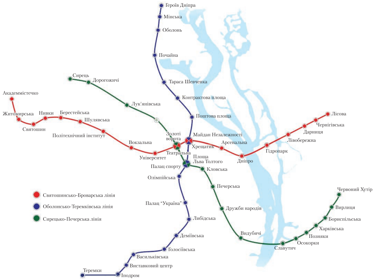
Рис. 1. Схема ліній Київського метрополітену

На сьогодні встановлено значні просторово-часові зміни магнітного поля природного і техногенного характеру, що потребує їх детального опису. Зауважимо, що в межах мегаполісів геомагнітне поле істотно спотворюється техногенною складовою від різних електричних і магнітних джерел [8–12]. Найбільш інтенсивні зміни як фонових значень індукції магнітного поля, так і його різночастотних варіацій приурочені до метрополітену.