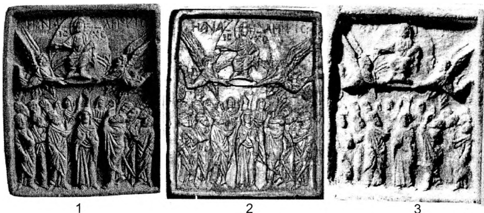
Рис. 1. Иконки из коллекции П.И. Севастьянова (1), Херсонеса (2), Червена (3).