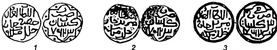
Рис. 1. 1 – анахроничный выпуск: Хызр – Гюлистан 763 г.х (Ф.-Д., 1980, № 272); 2 – монетный тип: Мурид, Гюлистан 763 г.х. (Фр., № 150); 3 – то же, вариант (Янина, 1958, № 95а).

2. (Гюлистан 762 г.х., Мурид) 8 , – Гюлистан 763 г.х., Мурид. Неверно прочтенная дата на экземплярах с зеркальным отображением цифр десятков и единиц в дате (Рис.1, 2-3) 9 .