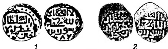
Рис. 8. Монеты Тулака без обозначения места чеканки: 1- Фр., № 177; 2- экземпляр из клада из Восточного Крыма.

В надписях проработаны мелкие элементы, в том числе и таъшид над именем Аллаха.