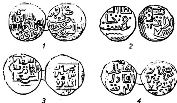
Рис. 7. Мухаммед, Орду 771 г.х.: 1 – Сав., № 93, табл. II, 25; Токтамыш, Азак 787 г.х.: 2 – Сав., № 435; подражания – Токтамыш, Сарай ал-Джедид: 3-4 – Сав., №№ 433, 434.

16. (Орду 777 г.х., Мухаммед Булак) 41 – Орду 771 г.х., Мухаммед. На опубликованном рисунке монеты (Рис.7,1) хорошо видна единица даты, а разделяющая две верхние цифры надпись представляет собой не повторение слова санат – «год», как ее понимал П.С.Савельев, а окончание числительных разряда десятков – بين , которое вместе с цифрой 7 образует числительное 70. Замечание относится только к опубликованному П.С.Савельевым типу, и не распространяется на другие монеты с именем Мухаммеда и датой 777.