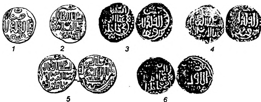
Рис. 6. Мухаммед, город 777 г.х.: 1-2 – Сав., №№ 85, 86; 3-4 – монеты из клада из Восточного Крыма; Мухаммед, Орду 773 г.х.: 5 – Сав., № 82; 6 – монета из клада из Восточного Крыма.

14. Орду 777 г.х., Мухаммед-Булак 35 (рис.6,1-2) – Кунгур? 777 г.х., Мухаммед. Для монеты с уверенно читаемым именем Токтамыша Х.М.Френ замечал, что оборотная сторона ее бита штемпелем монет Мухаммеда Буляка 36 . Действительно, они имеют практически идентичные надписи, но общих штемпелей для них не отмечено.