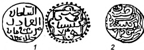
Рис. 3. 1 – Ф.-Д., 1980, № 294; 2 – Гр., № 118, табл. II, 21.

6. (Гюлистан 765 г.х., Мурид) 15 – Гюлистан 764 г.х., Мурид 16 . Цифра 6 (Ч) отображена зеркально в виде «двойки», а 4 (К) – наклонена и нечетким написанием напоминает пятерку, или же эти цифры меняют порядок расположения, причём «шестерка» наклонена влево (Рис.3,1). Вариант: по мнению В.В.Григорьева, составленному по четырем экземплярам, цифра единиц отсутствует, а за нее принимается слово «санат» (Рис.3,2) 17 .