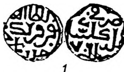
Рис. 2. 1 – Науруз, Гюлистан 761 г.х. (Фр., № 122).

3. (Гюлистан 763 г.х., Науруз) 10 – Гюлистан 761 г.х., Науруз 11 ; за цифру 3 ошибочно принимается сливающееся с единицей окончание характерно опущенного из предыдущей строки слова «белед» при неполном оттиске (Рис. 2, 1).