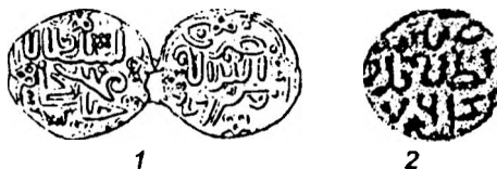
Рис. 4. Абдуллах, Сарай ал-Джедид 764 г.х.: 1 – Сав., № 7, табл. I, 10; 2 – Кротков, 1913, № 42 в.

10. (Сарай 768 г.х., Абдуллах) 23 – Сарай ал-Джедид 764 г.х., Абдуллах. П.С.Савельевым была прочитана дата 876, однако за первую цифру, очевидно, принят уголок вензетки в картуше из четырех дуг, на приводимом рисунке следом за мелкой, расположенной боком «восьмеркой» хорошо видна дата 764, цифры которой выполнены с наклоном вправо (Рис.4,1). Более крупная, чем другие цифры, «четверка» характерна для монет Абдуллаха чеканки Сарая ал-Джедид (Рис.4,2).