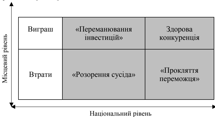
Рис. 3. Матриця сценаріїв для місцевої та національної економіки, що виникли в результаті застосування інвестиційних стимулів [19, с. 11]

з основ інноваційного потенціалу, та створенні ефективної інфраструктури, яка сприятиме перетворенню результатів досліджень у продукт, придатний до комерціалізації» [1, с. 7]. Держава акцентує увагу на необхідності створення інноваційної інфраструктури, як нового дієвого та успішного підходу до реалізації державної інноваційної політики, відходячи при цьому від підходу, що полягає у встановленні галузевих пріоритетів, які «погано піддаються стратегічному плануванню, оскільки інновації є важко прогнозованим процесом» [1, с. 7].