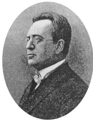
Броніслав Григорович Пржевальський

Броніслав Пржевальський (1862–1933) відомий як видатний хірург та науковець. А ще з його ім'ям та прізвищем неодмінно пов'язується польське коріння лікаря – більшість дослідників історії медицини, як українських, так і польських, впевнені у тому, що Броніслав Пржевальський поляк. Доказів тому обмаль, лише гучне польське ім'я та прізвище, проте для людської свідомості цього цілком достатньо. Настав час дослідити походження лікаря та відтворити цілісно його біографію.