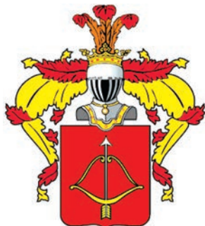
Родовий герб Пржевальських

инство возводитъ его Самого и потомков Его на вечные времена. Желая притом Герб, а равно и Дворянским Достоинством и всеми правами и преимуществами Дворянству присвоенными, он с потомством своим пользоваться имеет по примеру прочих дворян Великого Княжества Литовского.