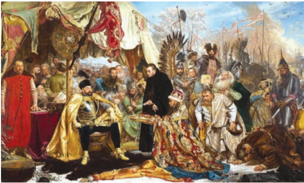
Стефан Баторій під Псковом, Ян Матейко, 1872

Повертаючись до невдалої облоги Пскова 12 , зауважимо – козаки скаржилися, що, не дивлячись на вірне служіння Речі Посполитій, їхні