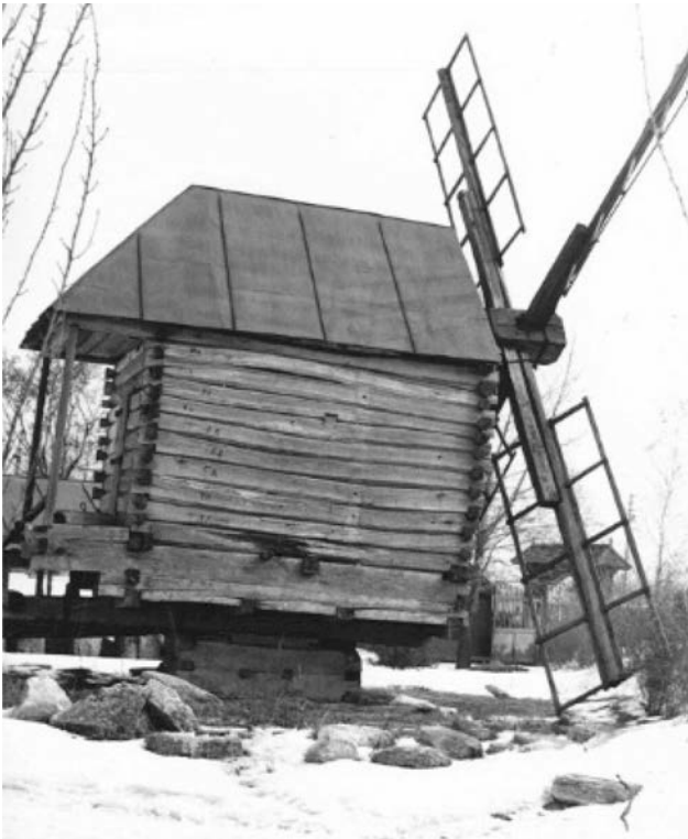
Вітряк з с. Галиця Ніжинського р-ну Чернігівської обл. в Музеї народної архітектури та побуту Середньої Наддніпрянщини, поч. 70-х рр. ХХ ст.

тах не було можливості для відбору і музеєфікації такого вітряка. А згодом з'ясувалося, що всі вітряки цієї зони вже втрачені. І лише в с. Смолин вдалось виявити міцний дубовий кругляк з рештками даху, валу, колеса, крил, але без внутрішнього обладнання. Щоб відновити робочий механізм довелося шукати аналоги. З дозволу М.І. Сікорського було обстежено вітряк з с. Ліски Менського р-ну Чернігівської обл., завдяки чому вдалось відтворити необхідне обладнання вітряка з с. Смолин 20 . Під кінець роботи спільної експедиції переяславських і київських музейників на Чернігівщину в с. Галиця Прилуцького р-ну був виявлений ще один вітряк, на відміну від попереднього, стовпової конструкції. Через рік, 8-16 жовтня 1970 р. цей вітряк був перевезений і встановлений в Музеї народної архітектури та побуту Середньої Наддніпрянщини