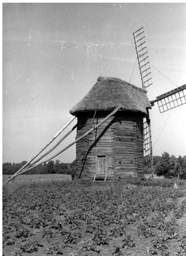
Вітряк з с. Ліски Менського р-ну Чернігівської обл. в Музеї народної архітектури та побуту Середньої Наддніпрянщини, поч. 70-х рр. XX ст.

колегам-киянам, але не забували й про свої інтереси. Так, на хуторі Ліски Менського р-ну виявили унікальний вітряк поч. XIX ст. доброго збереження типу «голландка» 19 . 15-21 листопада 1969 р. вище згаданий вітряк був перевезений на територію переяславського скансену (наказ № 57 від 13.11.1969 р.). С.В. Верговський згадував, що історія з цим вітряком згодом знову торкнулася київського скансену. У 1971 р. він провів експедицію навколо Чернігова і виявив з десяток зрубних соснових вітряків кругляків, та за величезним навантаженням у реставраційних роботах, при обмежених виробничих потужнос-