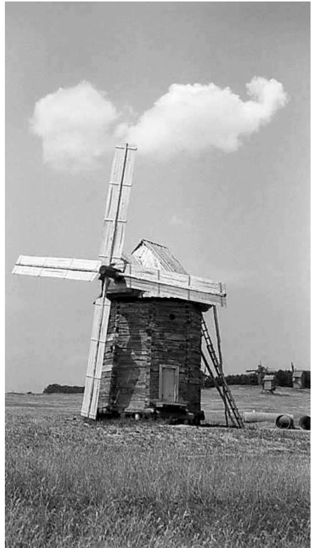
Вітряк в с. Смолин Чернігівського р-ну Чернігівської обл. в Музеї народної архітектури та побуту України, 14 червня 1979 р., автор М.І. Жарких.

(наказ № 50 від 8.10.1970 р.) 21 . В ході експедиції, пригадував М.І. Жам, в с. Обичів Прилуцького р-ну Чернігівської обл. був виявлений вітряк шатрового типу, одноповерховий, зрубний, шестикрилий, критий бляхою, дах фігурний. Музейники з Переяслава провели перемовини з головою колгоспу ім. 8-го Березня тов. Кащенком про можливість перевезення пам'ятки до