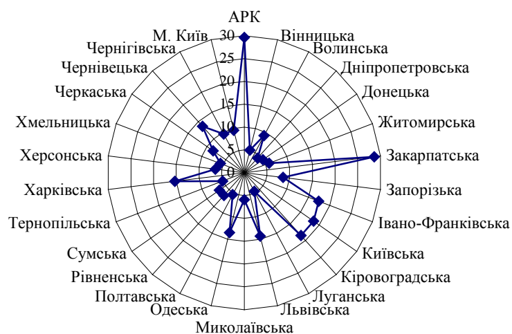
Рисунок 2. Територіальні відмінності частки рекреаційних ресурсів у загальному обсязі природних ресурсів, %

Реалізації цієї моделі в кожному регіоні сприяє те, що всі регіони володіють водними, лісовими, фауністичними та рекреаційними ресурсами, щоправда, зі значними територіальними відмінностями. Скажімо, рекреаційні ресурси в АРК становлять 29,6% від загального обсягу ресурсів, тоді як у Луганській області – 4,6, Дніпропетровській області – 4,3% (рис. 2).