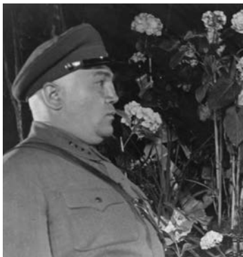
Начальник Управління прикордонної охорони і військ ОДПУ СРСР М.П. Фриновський біля труни голови ОДПУ СРСР В.Р. Менжинського (Москва, 14 травня 1934 р.)