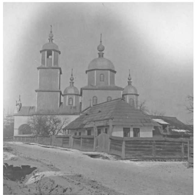
с. Біла Криниця на початку ХХ ст.

дослідників, зокрема служителя губернського правління у Львові С. Бредецького. У праці «Липовани і меноніти у Австрії» автор робить помилкові висновки, зараховуючи старообрядців до менонітів. В 1863 р. у світ виходить інше невелике дослідження В. Гелерта «Липовани в Буковині». В 80–90-ті роки ХІХ ст. пошуковці друкують декілька статей присвячених у т. ч. білокриницьким старовірам. На достатньо високому науковому рівні були виконані роботи Ф. Віккенгаузера, який у редактованих ним збірниках опублікував кілька десятків документів з історії буковинського старообрядства. В 1885 р. доктор філософії Чернівецького університету Й. Полек видав статтю «Липовани в Буковині», де в т. ч. досліджував історію Білої Криниці 5 . Однак самою відомою роботою на цю тему стало фундаментальне дослідження професора австрійської історії Чернівецького університету Р. Кайндля «Возникновение и развитие липованских поселений в Буковине», де Білій Криниці автор присвятив окремий розділ.