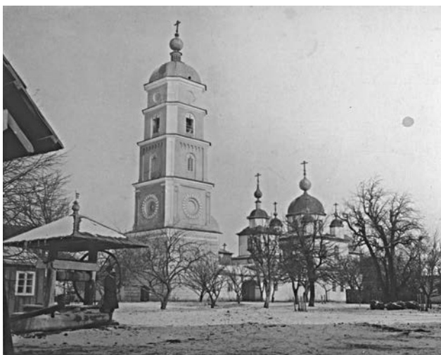
Покровський чоловічий монастир на початку ХХ ст.