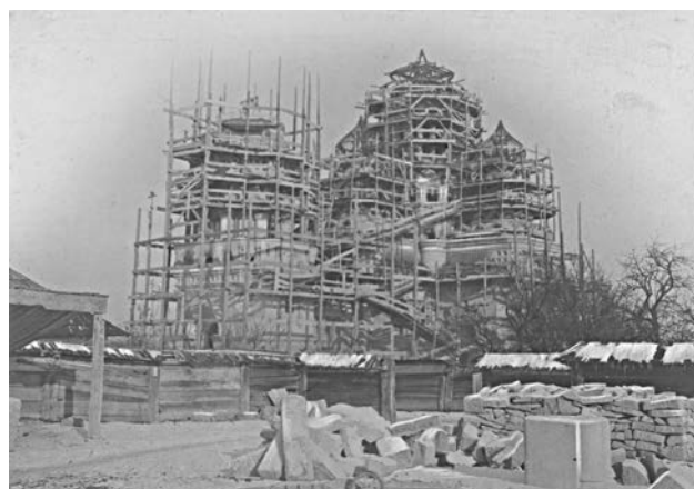
Будівництво Успенського кафедрального собору на початку ХХ ст.

У 1843 р. Павло Великодворський звернувся з клопотанням до австрійського імператора Фердинанда I, у якому вказав на необхідність заснування для липованів, котрі мешкають в Австрійській імперії, окремої архієрейської кафедри. Він дав зрозуміти австрійським чиновникам, що виконання цього прохання буде неприємним для Росії, однак, незважаючи на це, білокриницька делегація отримала від уряду дозвіл. Можливість утримання старообрядцями власного митрополита стала головною умовою дозволу на заснування старообрядської митрополії на Буковині.