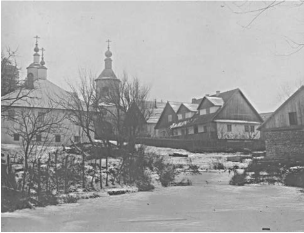
Успенський жіночий монастир на початку ХХ ст.

Значну дослідницьку роботу виконав чиновник слідчої поліції І. Аксаков, який за доручен-