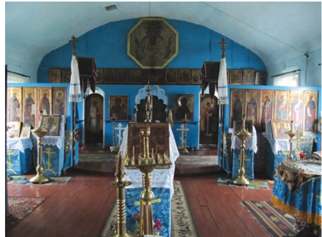
Інтер'єр Микільського храму в с. Біла Криниця. Фото 2016 р.

Там перебудували Покровський собор, возвели зимовий храм на честь Миколи Чудотворця, а також великий братський корпус. У 1899 р. за сприяння митрополита Афанасія чоловічий монастир відкрив своє представництво на Головній вулиці Чернівців.