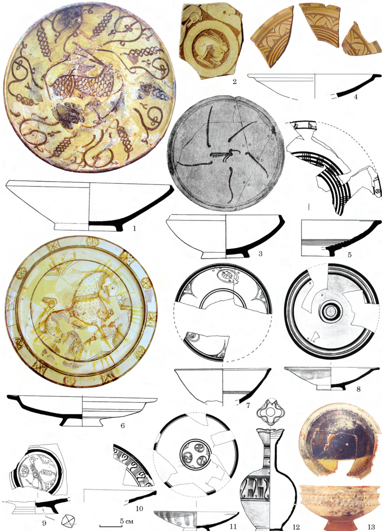
Рис. 1. Червоноглиняні полив'яні вироби з археологічних комплексів Криму XIII ст.: 1—5 — Middle Byzantine Production (Incised Sgraffito Ware, Champlevé); 6—13 — Zeuxippos Ware, class IA&II (1, 2, 3, 5—12 — Херсонес, за: Яшаева и др. 2011; Якобсон 1979; Седикова 2018; 4, 13 — середньовічне городище в Алушті, малюнок автора)