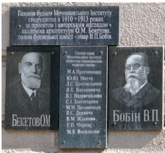
Меморіальна дошка по вул. Пушкінській, 14, НДІ мікробіології та імунології імені І.І. Мечникова НАМН України