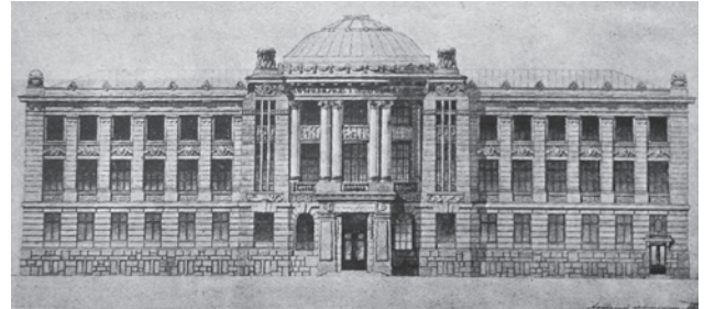
Проект будівлі для Харківського медичного товариства

теку, музей, редакцію «Харьковского медицинского журнала». Перлиною будівлі стала двоповерхова зала засідань на 600 місць. Сьогодні тут розташовано НДІ мікробіології та імунології імені І.І. Мечникова Національної академії медичних наук України.