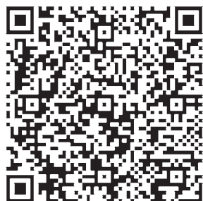
Відро (див. рис. 5)

Таким чином, під час досліджень поховання X ст. експедицією О. П. Моці було виконано цифрову фіксацію як всього об'єкта, так і окремих речей із поховального інвентарю. Кістки та дерев'яне відро не підлягали музеєфікації, тому лише 3D-модель зберігала їх для майбутніх досліджень. Новітній метод дає змогу провести будь-які точні виміри речей та візуалізувати об'єкт для загального доступу.