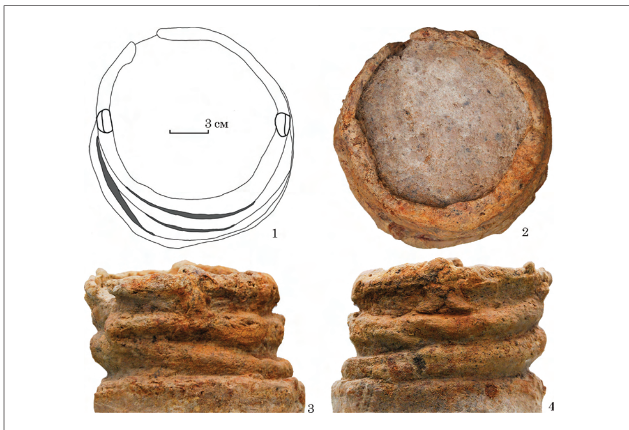
Рис. 4. Відро із поховання 3: 1 — кресленик; 2—4 — ортофото на основі 3D-моделі