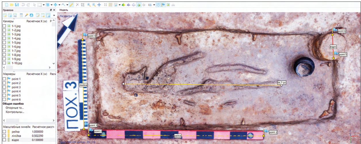
Рис. 2. Виміри елементів поховання на 3D-моделі