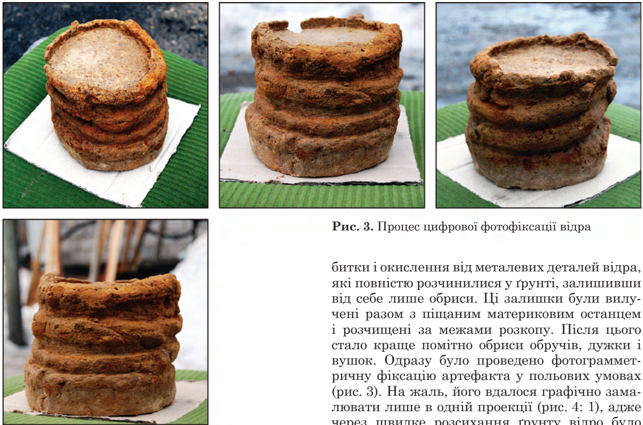
Рис. 3. Процес цифрової фотофіксації відра

В інтерфейсі програми у нижньому лівому куті показано, що розміри на моделі відповідають фізичним розмірам об'єктів, що перевірено довжиною рейки (1,0 м) та лінійки (0,5 м). Надалі за допомогою інструмента «лінійка» під потрібним кутом проводяться будь-які виміри ситуації in situ , що майже неможливо або дуже складно робити на фотографіях чи кресленнях поховання. Так, наприклад, довжина залягання збережених кісток 95 см, ширина — 25 см, вціліла довжина правої ноги 38 см, лівої — 34 см і т. д.