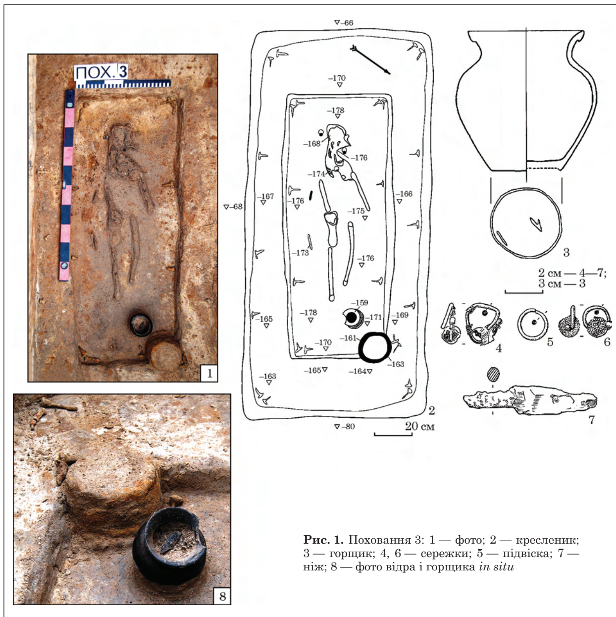
Рис. 1. Поховання 3: 1 — фото; 2 — креслення; 3 — горщик; 4, 6 — сережки; 5 — підвіска; 7 — ніж; 8 — фото відра і горщика in situ

домовини зафіксовано значну кількість цвяхів, що вказує на наявність дерев'яної конструкції облаштування стін як могильної ями, так і домовини всередині неї. У центрі домовини досліджено залишки кістяка дитини, від якого збереглися лише окремі кістки кінцівок, фрагмент щелепи і сліди кісткового тліну в ґрунті. Стан кісток унеможливує їхнє антропологічне визначення, проте з їх положення можна стверджувати, що вони лежали в анатомічному порядку головою на захід і являли собою інгумацію дитини або підлітка жіночої статі.