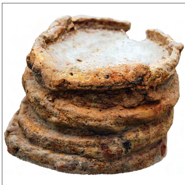
Рис. 5. 3D-модель відра