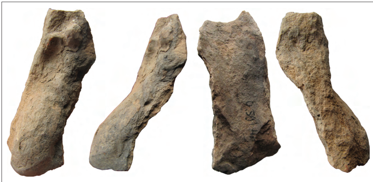
Рис. 3. Фрагмент погруддя-фіміатерія Афродіти (О-59/4341), розкопки О. І. Леві, О. М. Карасьова, Східний Теменос. НФ ІА НАНУ