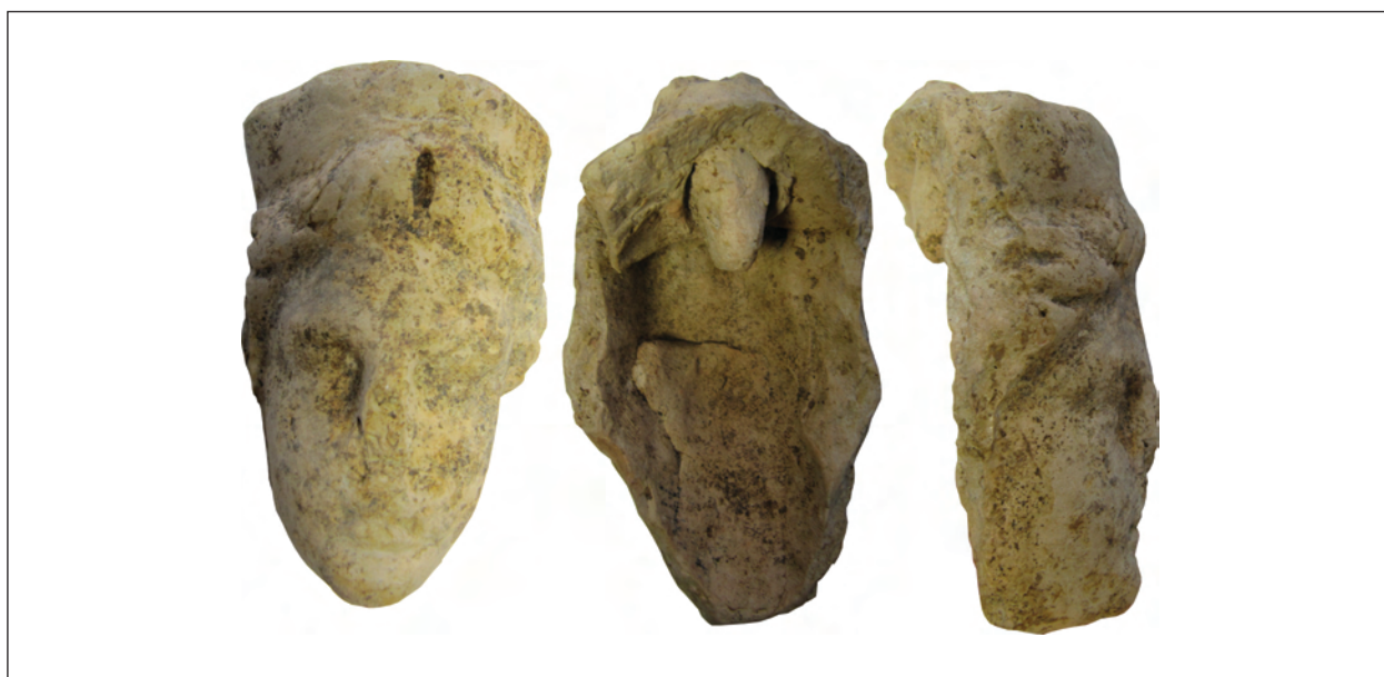
Рис. 14. Фрагмент погруддя-фіміатерія Афродіти (О-74/АГД/477), розкопки А. С. Русяєвої, ботрос на Західному Теменосі.