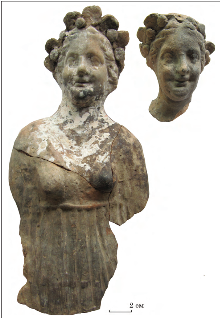
Рис. 10. Півфігурні зображення учасниць фіаса Діоніса, розкопки Л. М. Славіна, ділянка біля агори. НФ ІА НАНУ

лермо, на якому богиню показано в намисті з довгих підвісок, як на ольвійському зразку О-55/2979 (кат. № 13). Голови еротів тут виготовлено в окремих формах і доліплено до теракоти на краю плечей. На погруддях з Ольвії є зображення еротів на плечах впритул до шиї Афродіти на зразок тих, що були зображені у повен зріст.