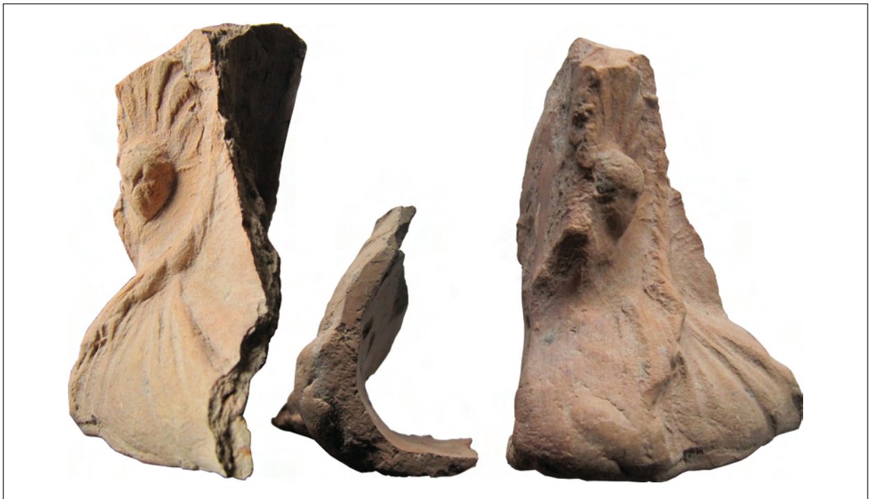
Рис. 12. Фрагмент погруддя-фіміатерія Афродіти (О-55/3103), розкопки О. І. Леві, О. М. Карасьова, ботрос на Східному Теменосі. НФ ІА НАНУ

ши в коропласта. Адже майстер працював, а, можливо, й продавав свій крам на священній ділянці. Ботрос слугував місцем захоронення залишків зі священної ділянки, тож ці погруддя-фіміатерії втратили свою цінність перед тим, як потрапили в цей контекст.