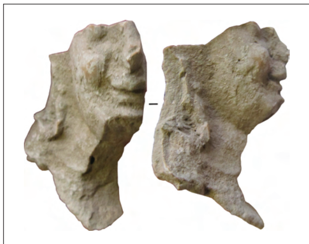
Рис. 7. Фрагмент погруддя-фіміатерія Афродіти (О-60/3373), розкопки О. І. Леві, О. М. Карасьова, Східний Теменос. НФ ІА НАНУ

копіюють одне одного, що уможливило припустити не лише той самий час виготовлення їх, а й руку одного коропласта чи його майстерні. Образ, змальований з однієї жінки, так сподобався майстрові, що він повторював його в різних фігурках, можливо й різних богинь. До виготовлених у формі півфігурних зображень додано ліпні деталі, а саме: листя і плоди, з яких створено вінок, традиційний для культу Діоніса. Так втілили образ учасниці діонісійського фіаса (рис. 10).