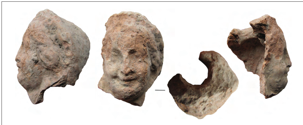
Рис. 5. Фрагмент погруддя-фіміатерія Афродіти (О-55/2155), розкопки О. І. Леві, О. М. Карасьова, Східний Теменос. НФ ІА НАНУ