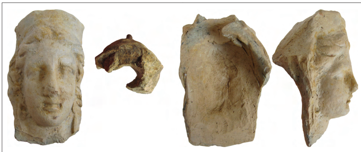
Рис. 13. Фрагмент погруддя-фіміатерія Афродіти (О-74/АГД/476), розкопки А. С. Русяєвої, ботрос на Західному Теменосі.