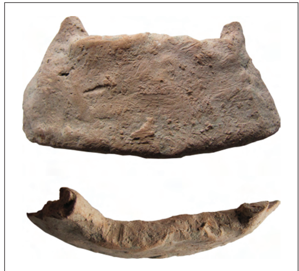
Рис. 9. Фрагмент погруддя-фіміатерія Афродіти (О-55/2989), розкопки О. І. Леві, О. М. Карасьова, ботрос на Східному Теменосі. НФ ІА НАНУ

рою, яку короласти мали на увазі, створюючи нові образи богині та її супутників.