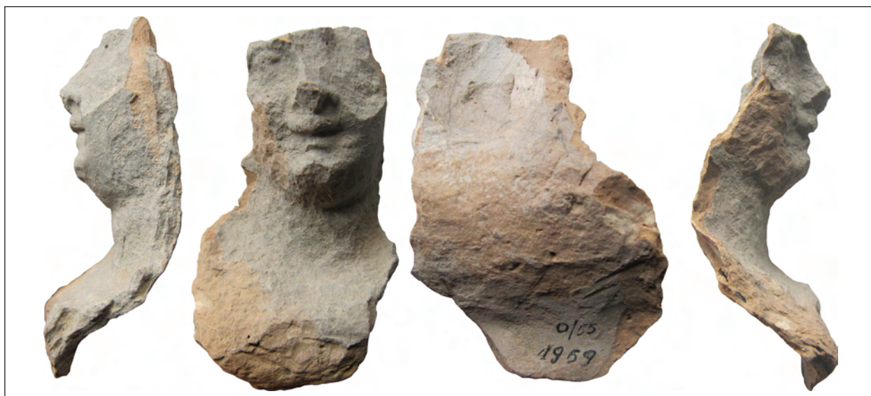
Рис. 6. Фрагмент погруддя-фіміатерія Афродіти (О-55/1959), розкопки О. І. Леві, О. М. Карасьова, Східний Теменос. НФ ІА НАНУ