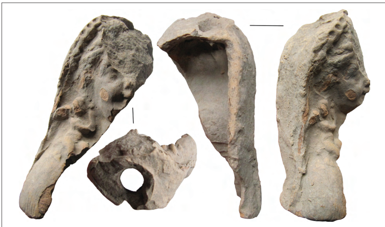
Рис. 4. Фрагмент погруддя-фіміатерія Афродіти (О-55/1958), розкопки О. І. Леві, О. М. Карасьова, Східний Теменос. НФ ІА НАНУ

ційний стан зображуваних тощо не є визначальним для віднесення фігурок до того чи іншого культу. Та ж Афродіта, зображена одним майстром юною і тендітною, в іншого постає ледь не огрядною. На погруддях-фіміатеріях богиня постає усміхненою повновидою жінкою, з важкими повіками, округлими випуклими щоками, повною шиею, ледь розкритим ротом, більше вираженою верхньою губою, випнутим підборіддям. Крім Ольвії, таке лице, як на серії аналізованих