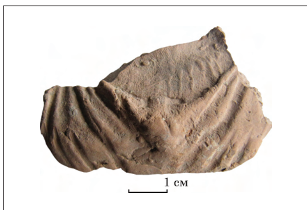
Рис. 15. Фрагмент погруддя-фіміатерія Афродіти (О-55/2979), розкопки О. І. Леві, О. М. Карасьова, ботрос на Східному Теменосі. НФ ІА НАНУ

Погруддя Афродіти з цілими фігурками еротів знайдено на ділянці Центрального Теменоса, але не в контексті ботроса, звідки походить Афродіта з еротами на тлі пальмет. Їх не використовували одночасно, зображення традиційних фігурок еротів передувало схематичному образу у вигляді стилізованих голів. Не лише ця, а й інші деталі на погруддях-фіміатеріях спрощувалися і схематизувалися, все менше нагадуючи тиражовані італійські зразки. Та це спрощення не стосувалося загального вигляду фіміатеріїв, їм і надалі надавали форми погруддя, не скорочуючи до голови, як це було в Італії (напр.: Bedello Tata 1990, tav. IV: 3), незмінною лишалася також проста ліпна чаша фіміатерія, прикметна короластиці Ольвії.