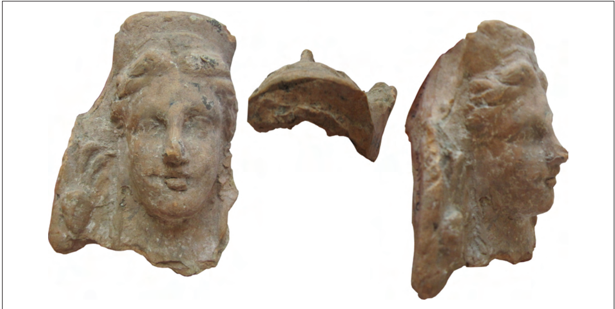
Рис. 11. Фрагментоване погруддя-фіміатерій Афродіти (О-36/1970), розкопки М. М. Худяка на ділянці И. Національний музей історії України