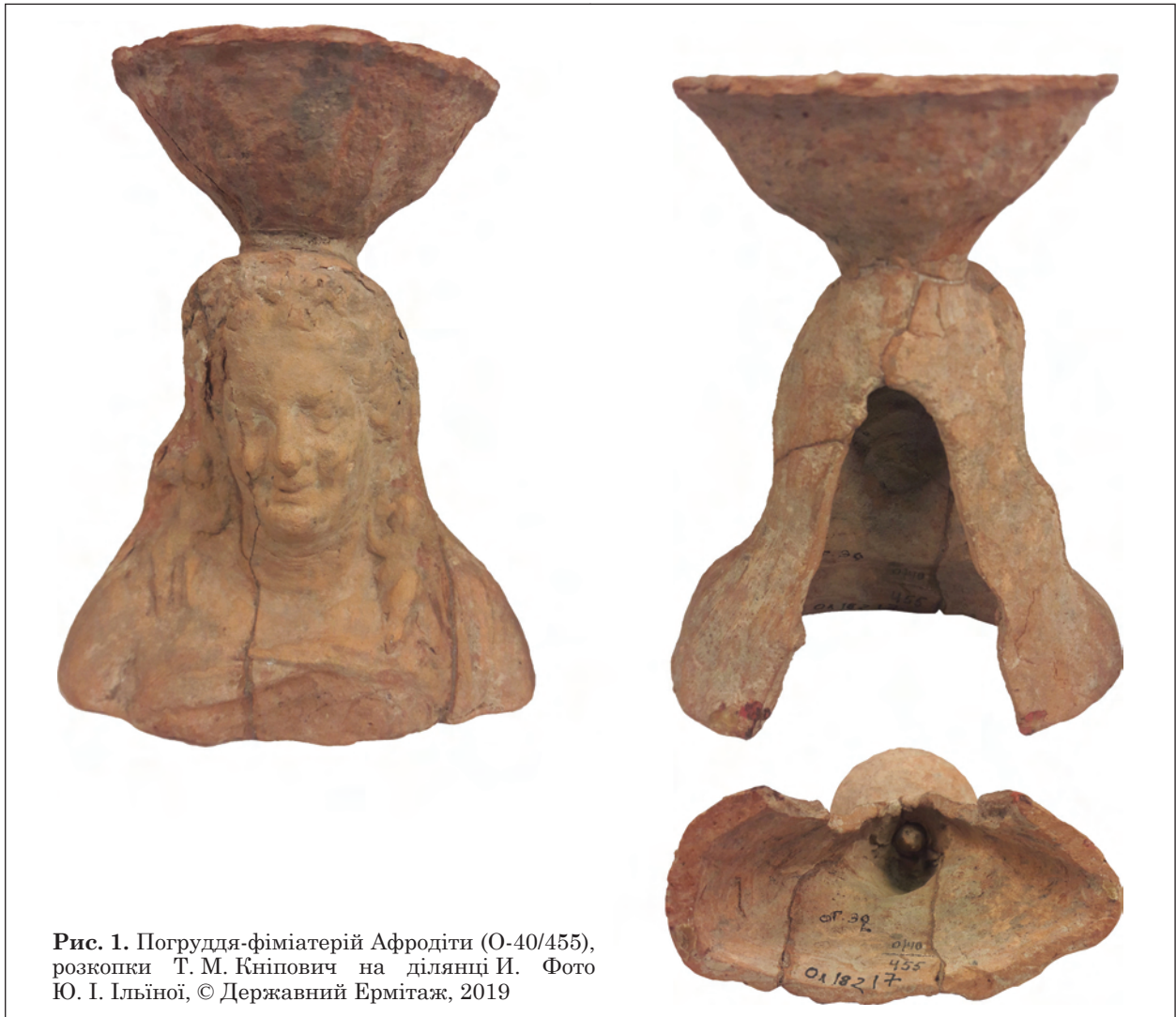
Рис. 1. Погруддя-фіміатерій Афродіти (О-40/455), розкопки Т. М. Кніпович на ділянці ІІ.

тероса — як у метелика. Образи Ерота і Гімероса, кохання і пристрасті, зазвичай нічим не відрізнялися між собою, через що в літературі зображення їх називають просто еротами.