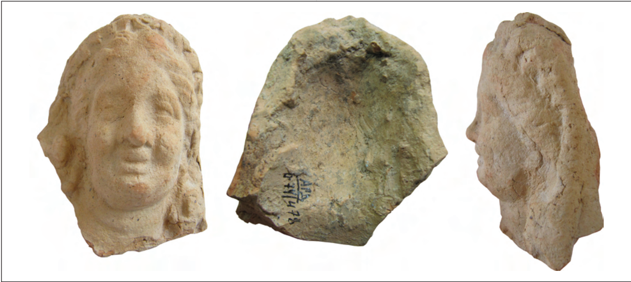
Рис. 2. Фрагментована протома Афродіти (О-74/АГД/478), розкопки А. С. Русяєвої, Західний Теменос.

лено у формі, хоча, як і більшість ольвійських ліпних чаш, розташована вона не по центру голови. Чаша має дуже розплющені, аж відігнуті краї. Руки Афродіти, опущені вздовж тулуба, показано майже до ліктів. На обох плечах маленькі ероти тягнуться руками до обличчя Афродіти. Погруддя є близьким до ольвійських за розміром, а також за оформленням одягу. Завважимо, є паралелі і з тими зображеннями, які зазвичай трактують як Кору-Персефону (Русяєва 1979, с. 56, рис. 32). Це безрукавий хітон з трикутним вирізом на шиї, підв'язаний під грудьми. Виріз, близький до V-подібного, був популярний у короластиці початку III ст. до н. е. Його рідко виконували на великій скульптурі, він відповідав доволі розкутим образам (Burr Thompson 1963, p. 23, 80).